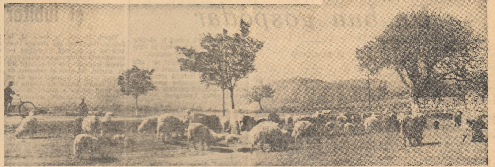
S-a dezvoltat mult în ultima vreme ferma de ovine a gospodăriei agricole colective „Tractorul Roșu” din comuna Cristian, regiunea Brașov. În fotografie: o parte din cele 2.000 de oi, la pășunat.