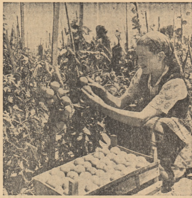
Harnice grădinișe din Cricin, regiunea Plovdiv, la culesul roșiilor.

Ce va da aceasta gospodăriei? Înainte de toate va deschide „cale liberă” metodei de producție în bandă rulantă a bumbacului. Din coșul mașinii de recoltat, „aurul alb” va fi descărcat în niște cărucioare mecanice, care, fără a mai trece pe la magaziele colhozului, îl vor duce direct la uscătorie, iar de-acolo bumbacul va fi luat în primire de mașinile fabricii de egrenat. Pentru prima oară în Uniunea Sovietică, colhoznicii vor livra statului nu bumbac brut, ci fibre pure pentru combinatele textile.