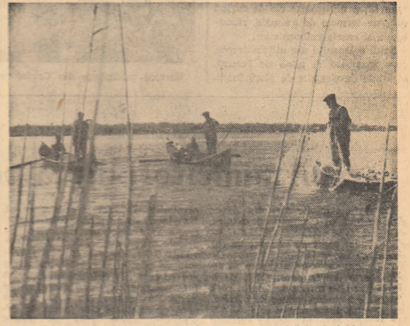
Pescuitul este în toi. Iată-l la lucru pe membrii brigăzii piscicole a gospodăriei agricole colective din Jiriu, regiunea Galați.

Membrii gospodăriei agricole colective „Steagul Roșu” din comuna Beian vor ține stîmbei la toate ani, pe bază de contract, 76 tone grîu, 6 tone orzoaică, 53 tone porumb, 30 tone floarea-soarelui și 66 tone cartofi. Ei vor realiza din contractări circa 1.000.000 lei.