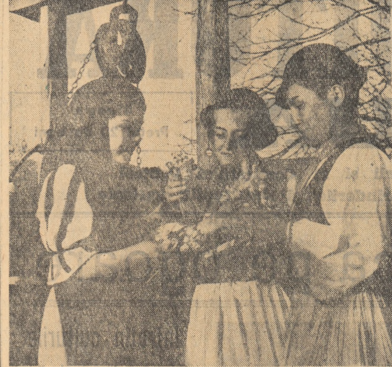
Frumoase costume naționale sînt purtate cu mîndrie de către tineretul din comuna Polovraci, regiunea Oltenia.