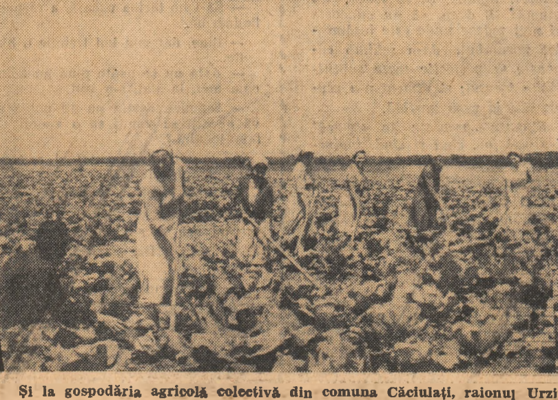
Și la gospodăria agricolă colectivă din comuna Căciulați, raionul Urziceni, prașitul culturilor este în toi. Așa cum se vede în fotografie, colectivitățile prășesc în grădina de legume și zarzavat a gospodăriei