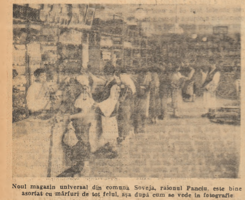
Noul magazin universal din comuna Soveja, raionul Panciu, este bine asortat cu mărfuri de tot felul, așa după cum se vede în fotografie