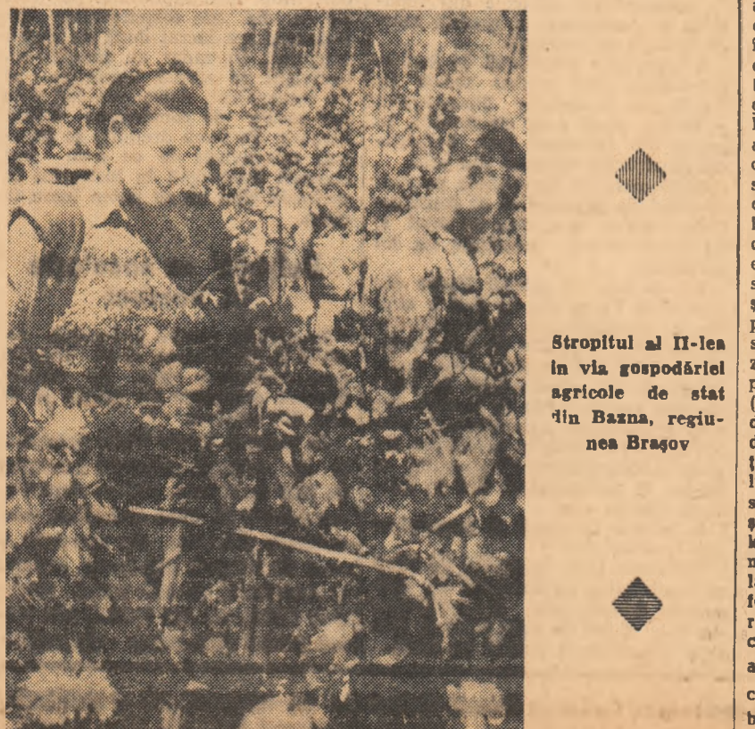
Stropitul al II-lea în via gospodăriei agricole de stat în Bazna, regiunea Brașov