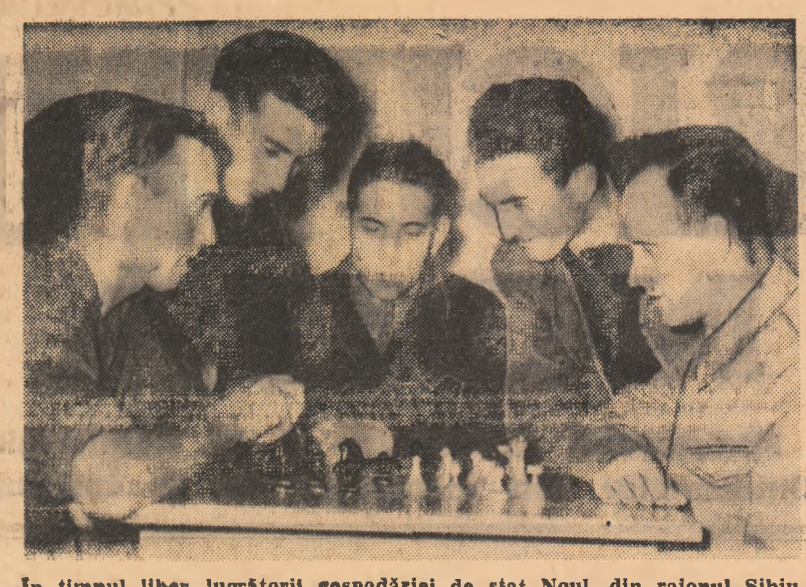
În timpul liber lucrătorii gospodăriei de stat Nou, din raionul Sibiu, se întâlnesc adesea la club în jurul mesei de șab