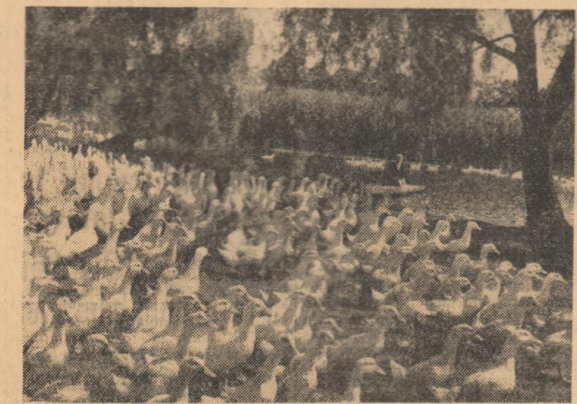
Folosind condițiile naturale pe care le are, gospodăria agricolă de stat Mogosoaia din regiunea București, a dezvoltat mult creșterea păsărilor de apă. În fotografie: un cîrd de rațe ale gospodăriei.