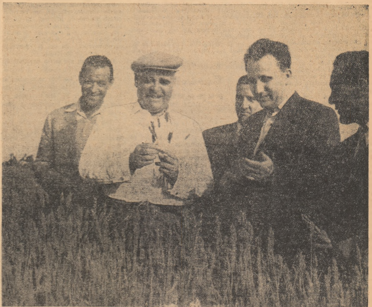
În lanurile de grâu ale G.A.S.-Grabăi