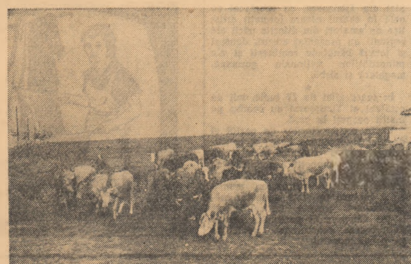
O parte din vacile gospodăriei colective din comuna Comana, regiunea Dobrogea