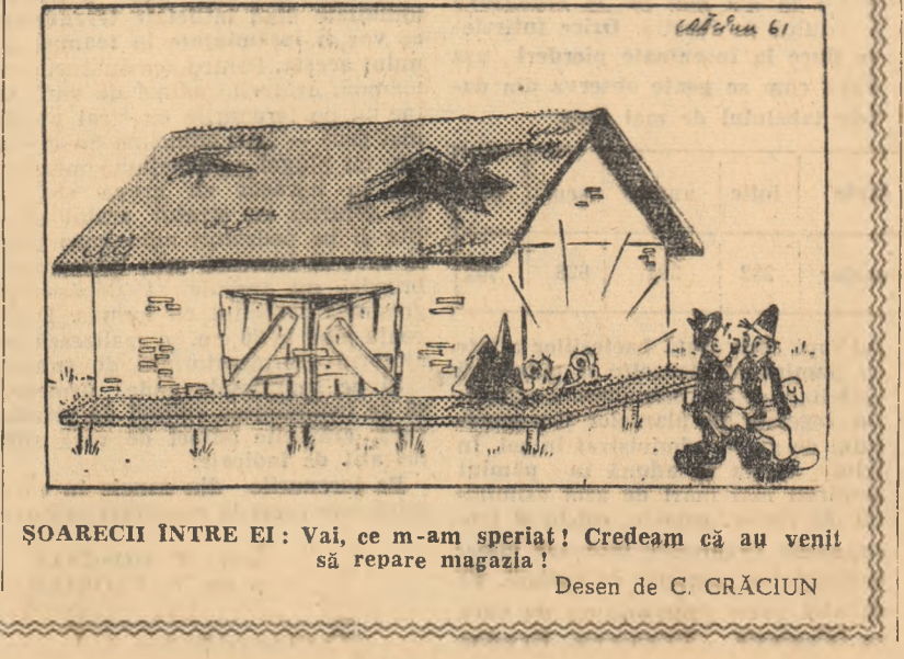
Desen de C. CRĂCIUN

ȘOARECH ÎNTRE EI: Vai, ce m-am speriat! Credeam că au venit să repare magazia!