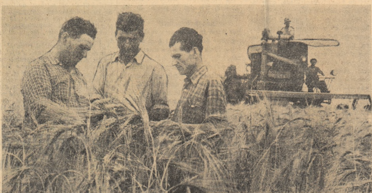
Gospodăria agricolă colectivă din Băilești, regiunea Oltenia, are de recolat aproape 800 de ha de păsoase. Pentru a se prinde momentul optim al începerii recoltării, lanurile au fost controlate de câteva ori pe zi de către conducerea gospodăriei. Și cînd păsoasele au ajuns în pirgă, combinele au și intrat în lan

În săptămâna trecută, s-a început recoltatul grâului în regiunile Oltenia, București, Banat și altele. S-a intensificat, de asemenea, secerișul și treierul orzului de toamnă, îndeosebi în regiunile Banat, Oltenia și Dobrogea. Până acum, recoltarea orzului s-a efectuat pe aproape 12 la sută din suprafața cultivată. Este necesar să fie luate măsuri în vederea grăbirii și mai mult a recoltatului orzului, îndeosebi în gospodăriile agricole de stat. Munca trebuie astfel organizată, încât să fie folosite toate mijloacele pentru recoltarea în grădă a acestei culturi.