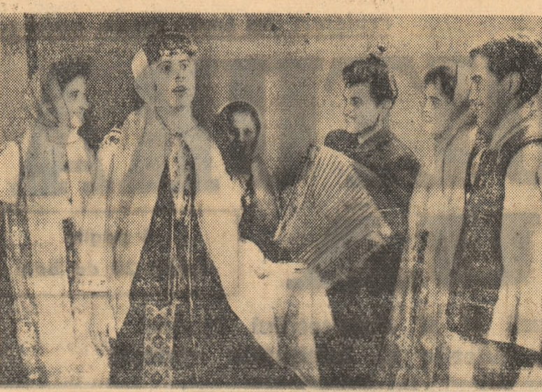
Ne aflăm cu aparatul fotografic în comuna Țigănești, raionul Alexandria. La căminul cultural i-am prins în obiectiv pe membrii brigăzii artistice, în timpul unui frumos spectacol

— Iată dar că e folositor să ai o fată președintă și care a participat la Olimpiada de fizico-matematică, adăugă laudativ tovarășul inginer Negritu, directorul adjunct al școlii.