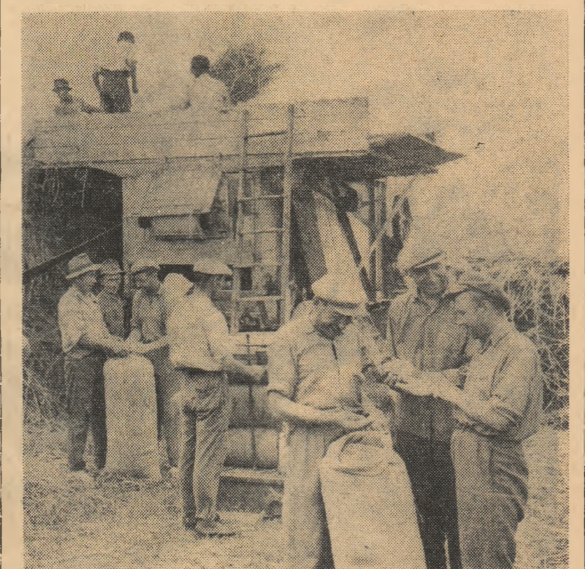
La gospodăria agricolă colectivă din comuna Vaidai, regiunea Crișana, a început treierul orzului. Colectiviștii sînt bucurînd de recolta obținută: peste 3.400 kg. la ha.