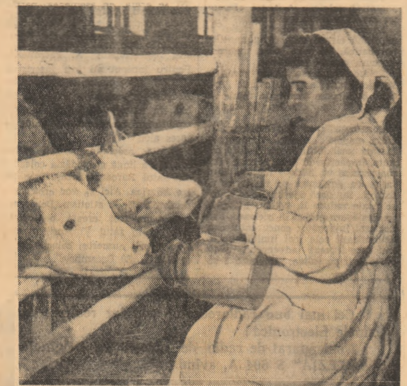
La gospodăria colectivă din comuna Comsoșul Mare, raionul Sînnicolau Mare, se aplică, printre alte metode înaintate și metoda alăptatului vițelilor cu biberonul. Fotograful nostru a surprins un astfel de moment.