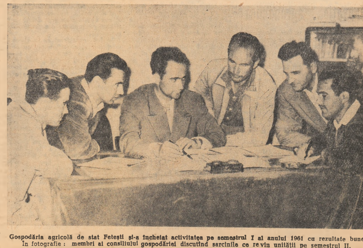
Gospodăria agricolă de stat Fetești și-a încheiat activitatea pe semestrul I al anului 1961 cu rezultate bune. În fotografie: membri ai consiliului gospodăriei discutînd sarcinile ce revin unității pe semestrul II.