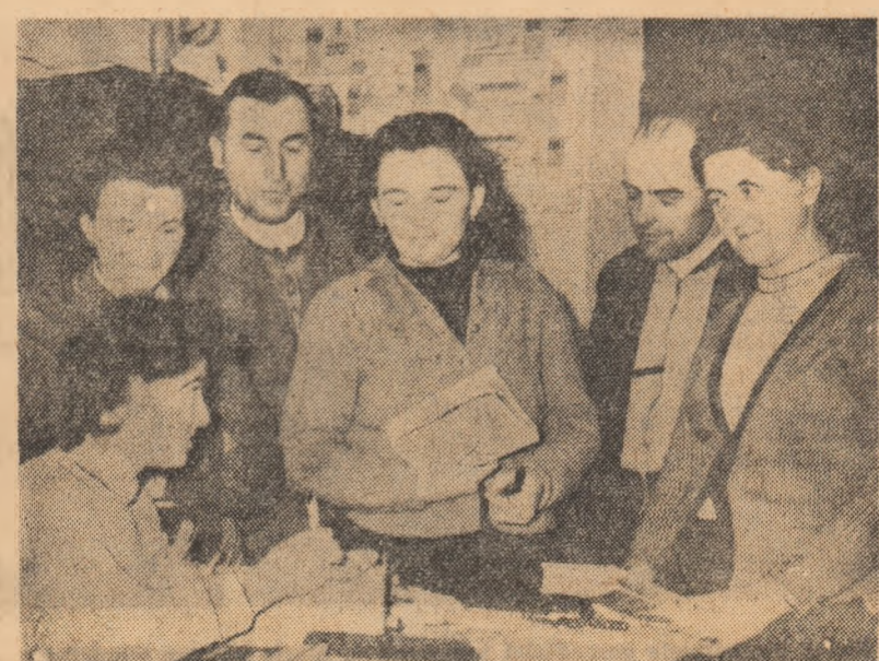
La căminul cultural din comuna Bors, regiunea Crișana, există o frumoasă bibliotecă. Aci, așa cum se vede în fotografie, vin zilnic numeroși tineri și vîrstnici spre a împrumuta cărți literare și agro-zehnice.