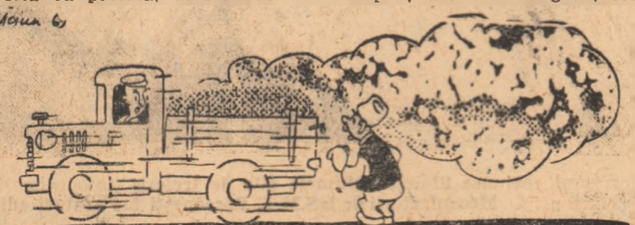
CETĂPEANUL: De ce gonești așa de tare? ȘOFERUL: Ca să mai ajung cu ceva țărîțe acasă.

G.A.S. Măicînești, regiunea Galați, a transportat din gara Hanu Conache cu autocamionul țărîțe de griu. Mașina nefînd acoperită cu prelată, acestea au fost împrăștiate de-a lungul soselei.