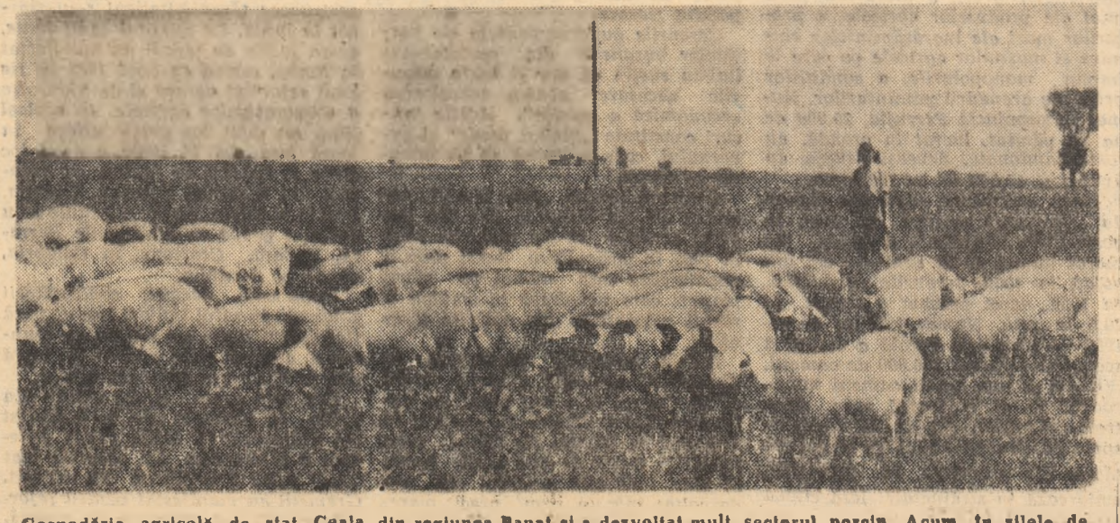
Gospodăria agricolă de stat Coala din regiunea Banat și-a dezvoltat mult sectorul porcin. Acum, în zilele de vară, godaci, (turma numără peste 3.500 de capete) sînt duși la păscut de lucernă, așa cum se vede în fotografie.