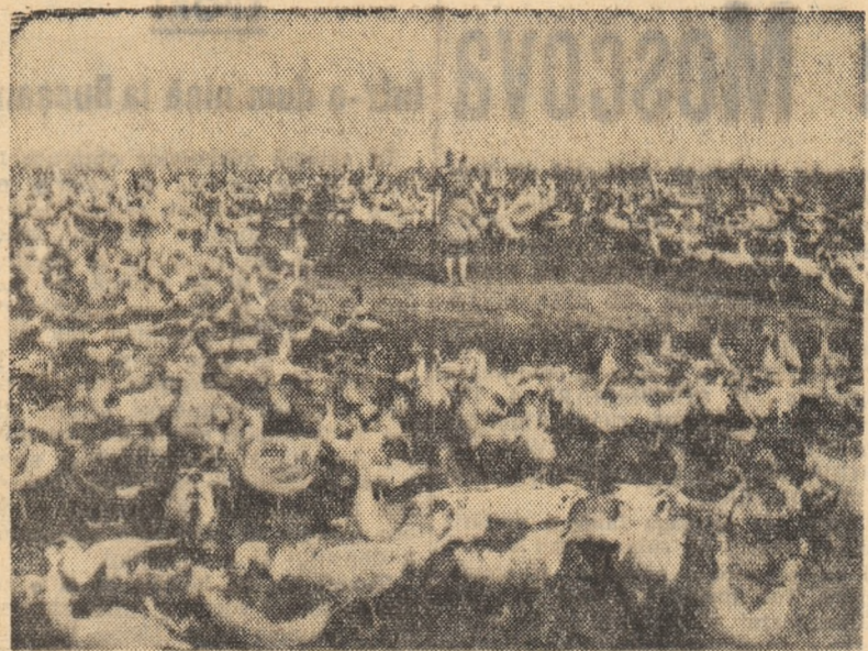
La gospodăria colectivă Cocargea, raionul Fetești, se crește anul acesta un număr dublu de găște față de anul trecut.