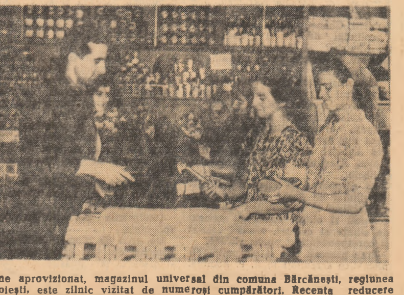
Bine aprovizionat, magazinul universal din comuna Bărcănești, regiunea Ploiești, este zilnic vizitat de numeroși cumpărători. Recenta reducere de prețuri a făcut ca numărul celor care vin să cumpere mărfuri de la magazin să fie din ce în ce mai mare.