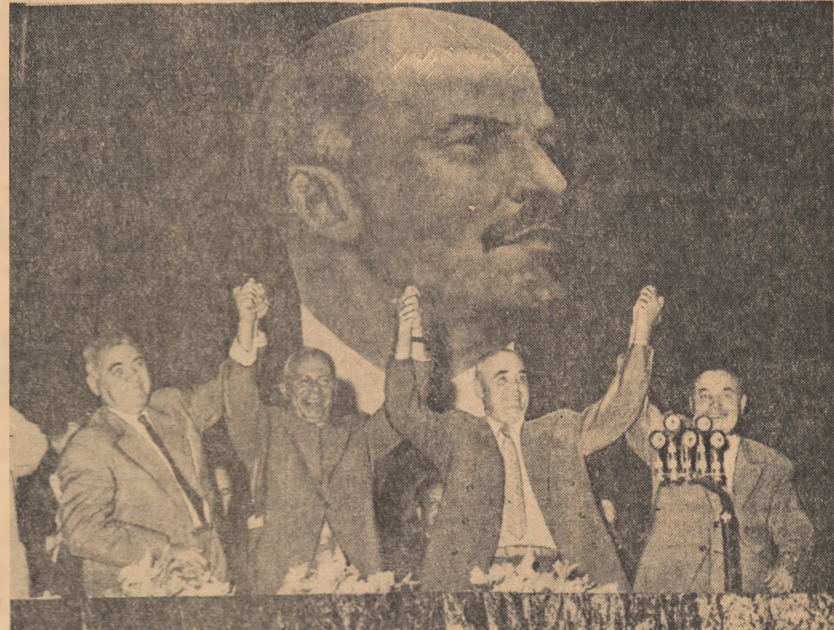
La mitingul oamenilor muncii din Kiev

KIEV 9 (Agerpres). — La 9 August a avut loc la Kiev la Palatul Sporturilor un mare miting al oamenilor muncii care s-a transformat într-o demonstrație grăitoare, emoționantă a prieteniei sovieto-romîne indestructibile. Sala Palatului Sporturilor era pavozată cu drapelul de stat ale R.P. Romîne, U.R.S.S. și R.S.S. Ucrainene, cu panouri roșii pe care erau scrise în limbile romînă, rusă și ucraineană cuvinte de salut fierbinte, adresate de poporul ucrainean oamenilor muncii din Republica Populară Romînă.