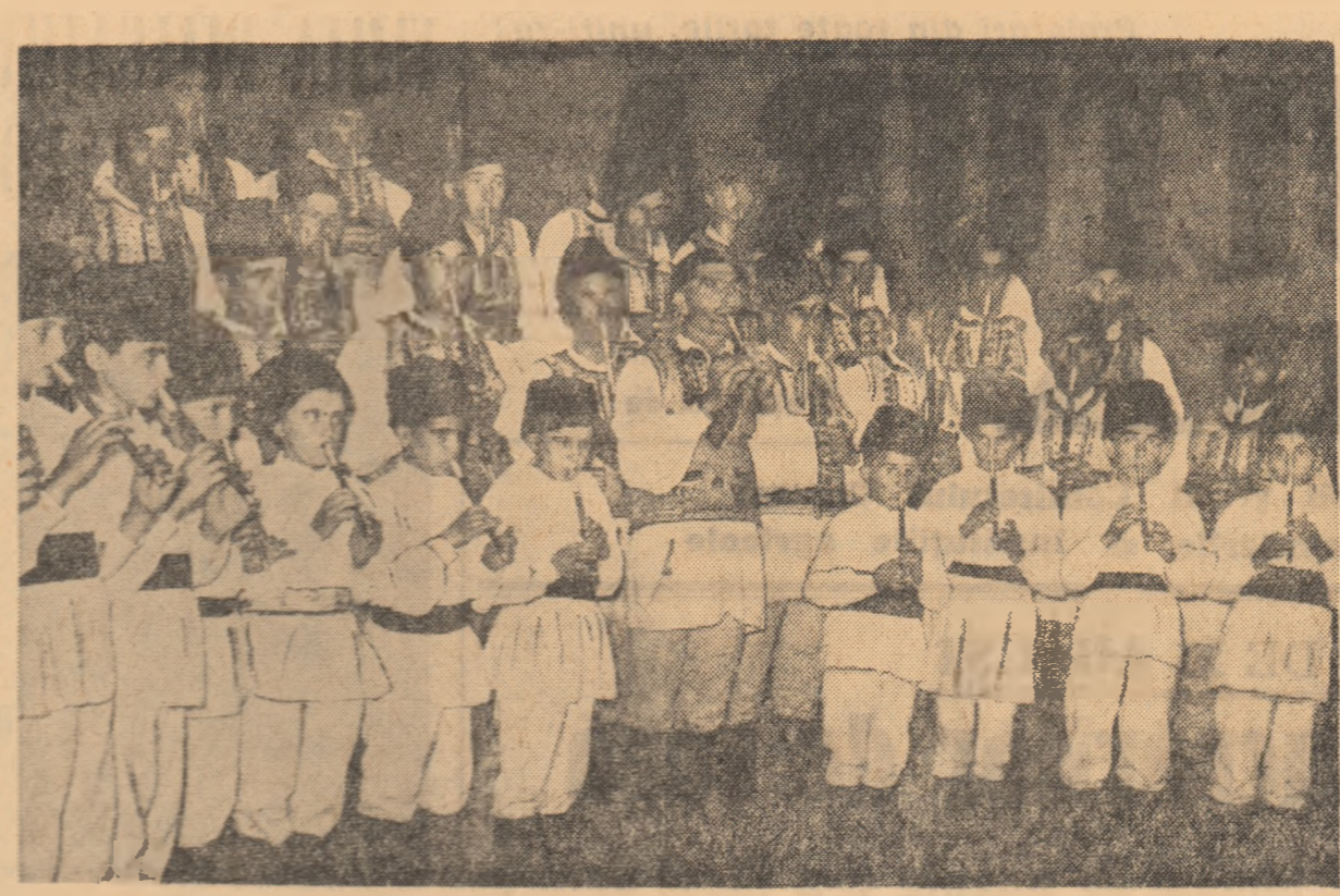
Căminul cultural din comuna Șercălia, raionul Făgăraș, se mîndrește cu o lăscușită formație de fluterași, care obține succese deosebite la numeroase spectacole pe care le prezintă.