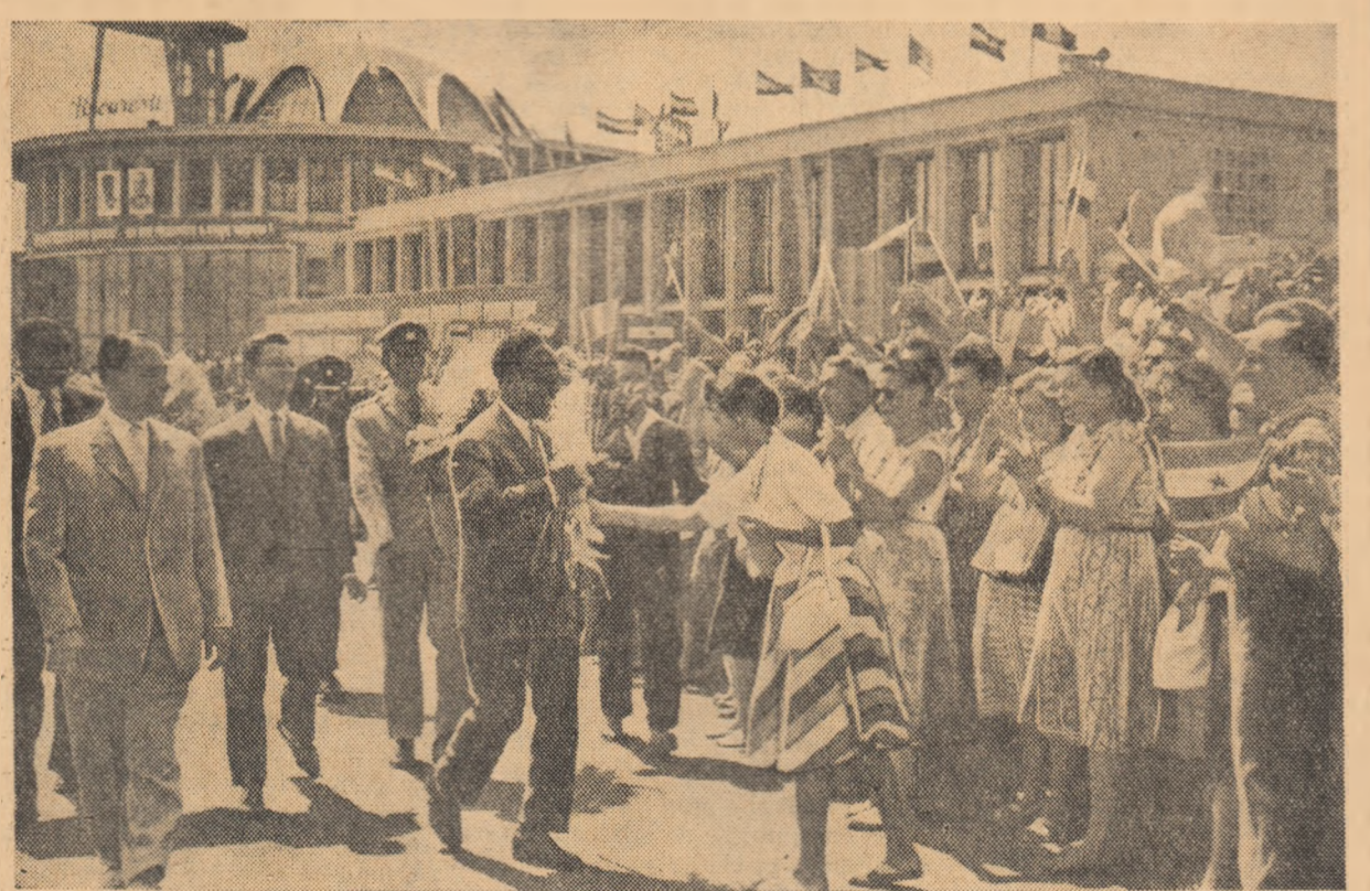
La sosirea pe aeroport.

Miercuri dimineața a sosit la București dr. Kwame Nkrumah, președintele și primul ministru al Republicii Ghana, care, la invitația Consiliului de Stat și a Consiliului de Miniștri al Republicii Populare Romîne, a făcut o vizită oficială în țara noastră.