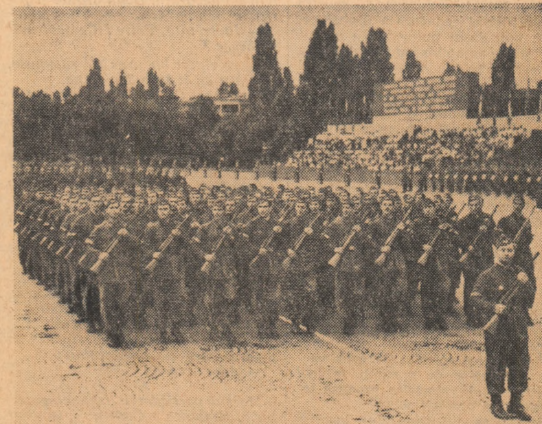
Cu pas viu și cadențat, în sunetele „Marșului Partizanilor”, trec gările muncitorești.