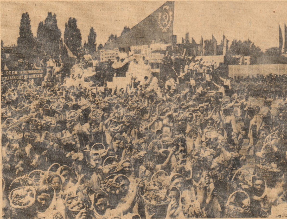
Prin fața tribunei, manifestîndu-și dragostea și încrederea față de partid, hotărîrea de a obține noi succese în creșterea producției agricole, au trecut și oamenii ai muncii din agricultura regiunii București, cea de-a doua regiune din țară cu agricultura complet colectivizată.