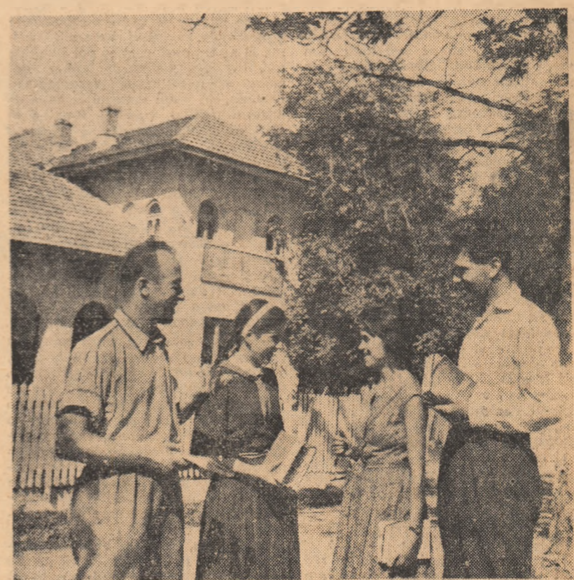
Biblioteca căminului cultural din comuna Puchenii-Mosnei, regiunea Ploiești, este înzestrată cu peste 5.000 de volume. Cei peste 1.000 de cititori găsesc întotdeauna, după preferință, cărți literare, politice și agrotehnice. Iată un grup de cititori discutînd despre cărțile pe care le-au împrumutat cu cîteva minute înainte.