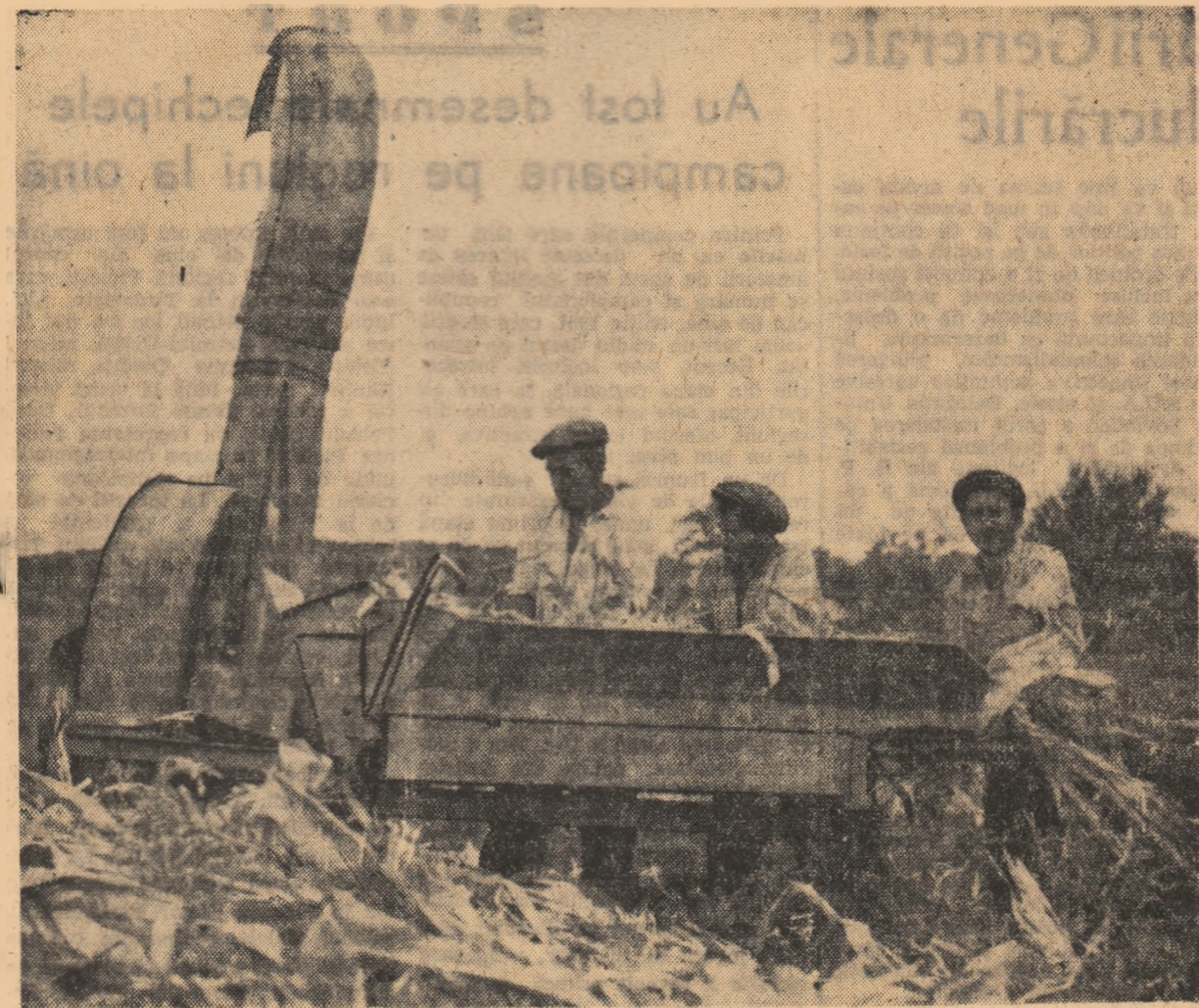
Colectivisti din Cireșov, regiunea Argeș, pun un accent deosebit pe dezvoltarea creșterii animalelor. De aceea ei se îngrijesc de pe acum pentru asigurarea hranei în timpul iernii însoțind mari cantități de furaje.