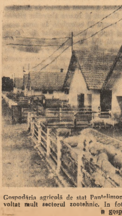
Gospodăria agricolă de stat Pantelimon din regiunea București, a dezvoltat mult sectorul zootehnic. În fotografie: aspect de la ferma de porci a gospodăriei.