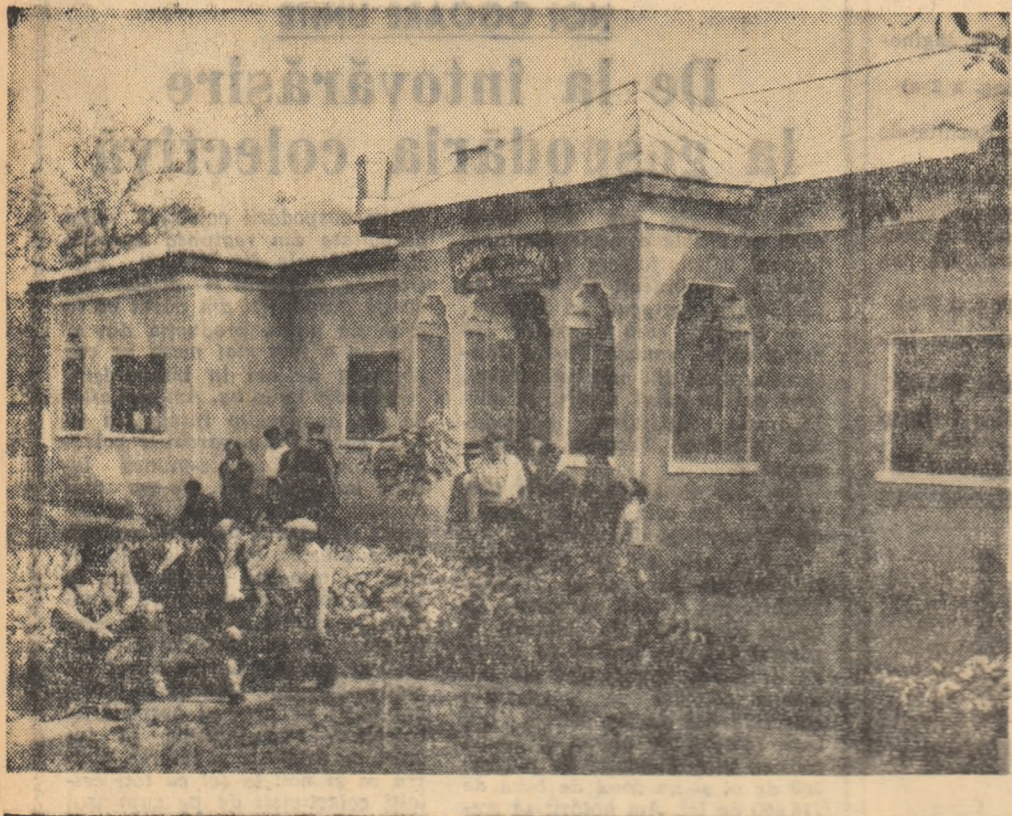
Colectivii din comuna Gologanu — regiunea Galați — au acum un frumos câmin cultural unde își petrec timpul liber în mod plăcut și instructiv.