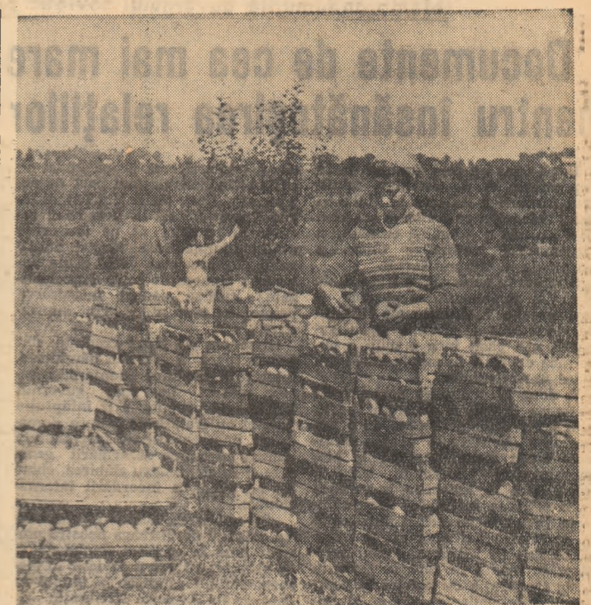
Culesul merelor la gospodăria agricolă de stat Copou, regiunea Iași