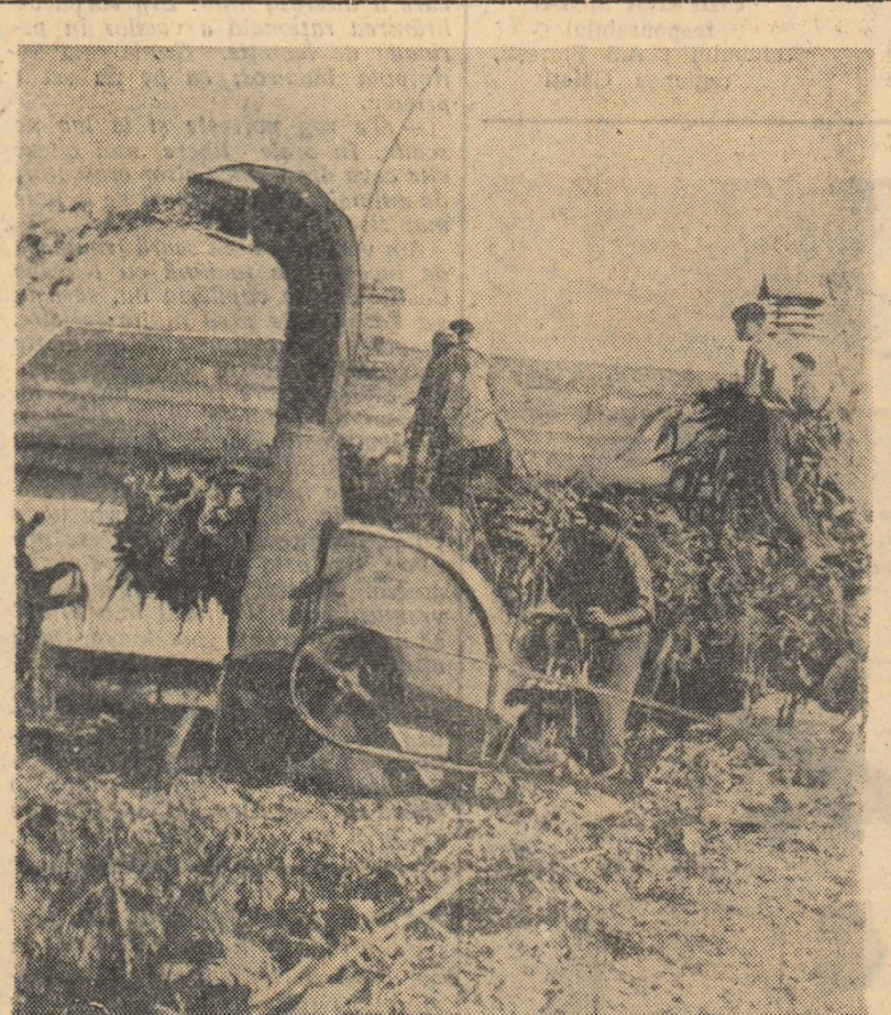
La gospodăria agricolă de stat din Cristești, regiunea Iași, însilozarea porumbului se apropie de sfîrșit. În fotografie: aspect de la această lucrare