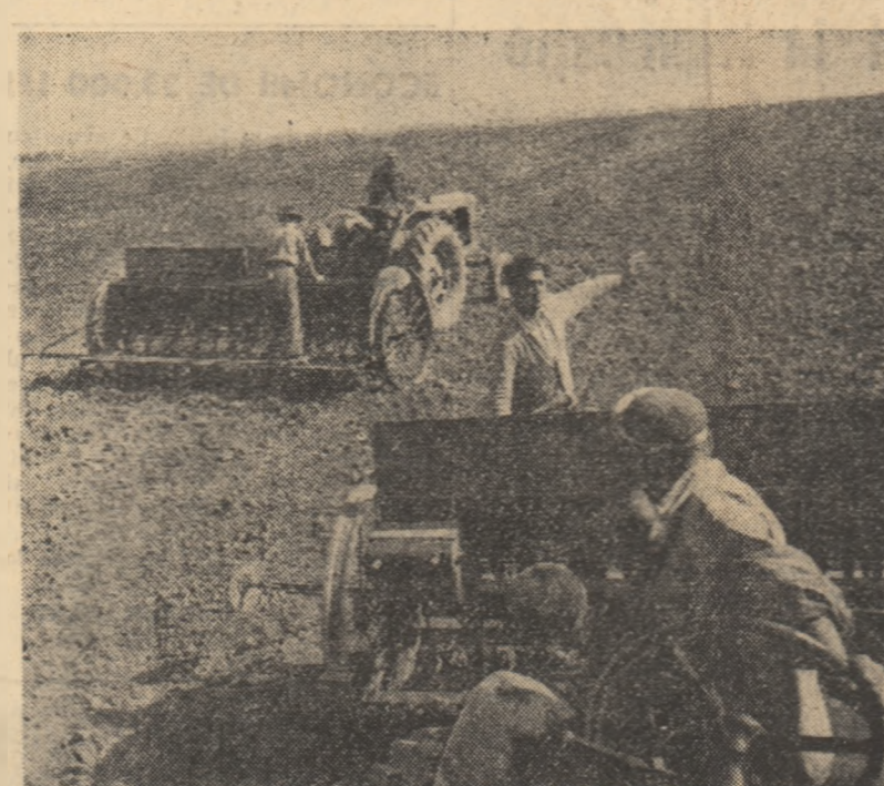
„Fiecare zi bună de lucru și se folosește din plin la semănatul grîului”. Sub această lozincă deslășoară membrii gospodăriei colective din comuna Herești, regiunea București, întrecerea la lucrările agricole de toamnă.