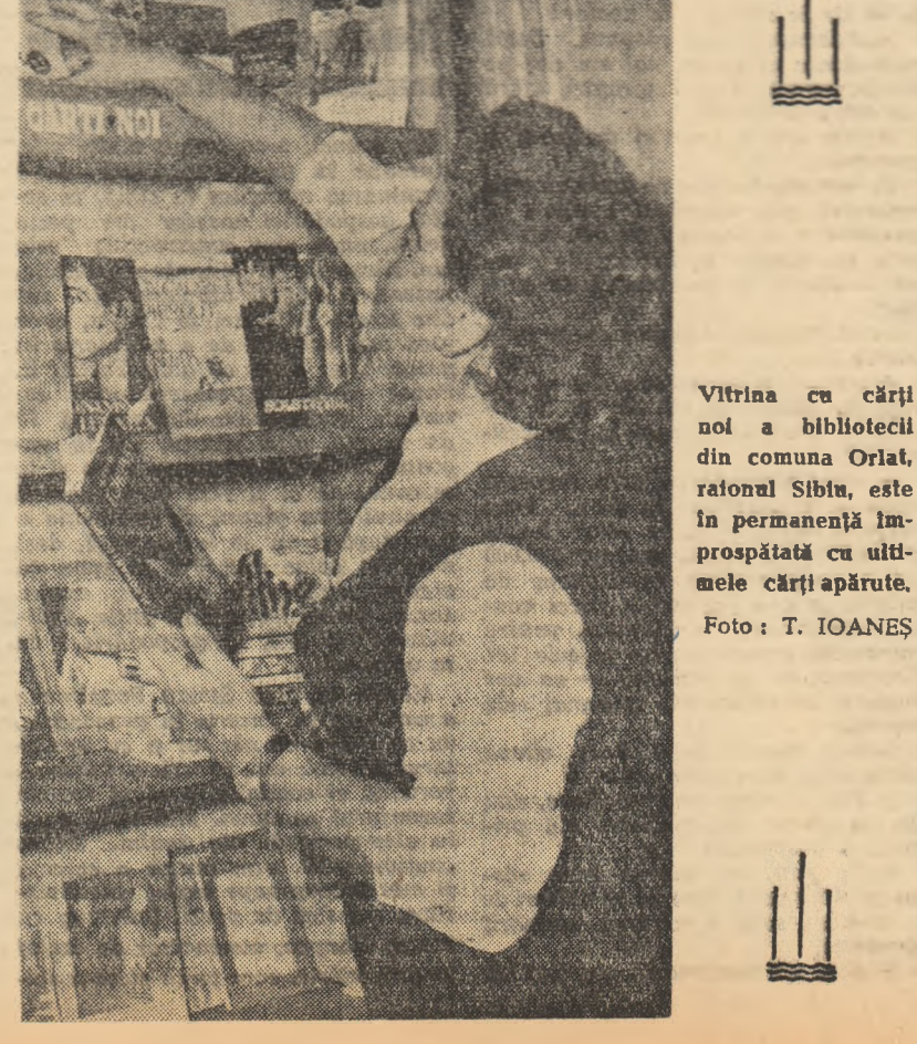
Vitrina cu cărți noi a bibliotecii din comuna Oriat, raionul Sibiu, este în permanență în prospăritate cu ultimele cărți apărute.