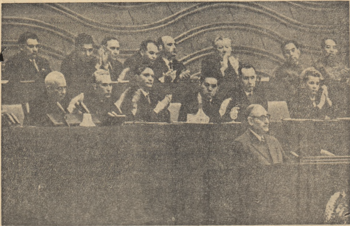
Tovarășul Gheorghe Gheorghiu-Dej rostindu-și cuvîntarea.