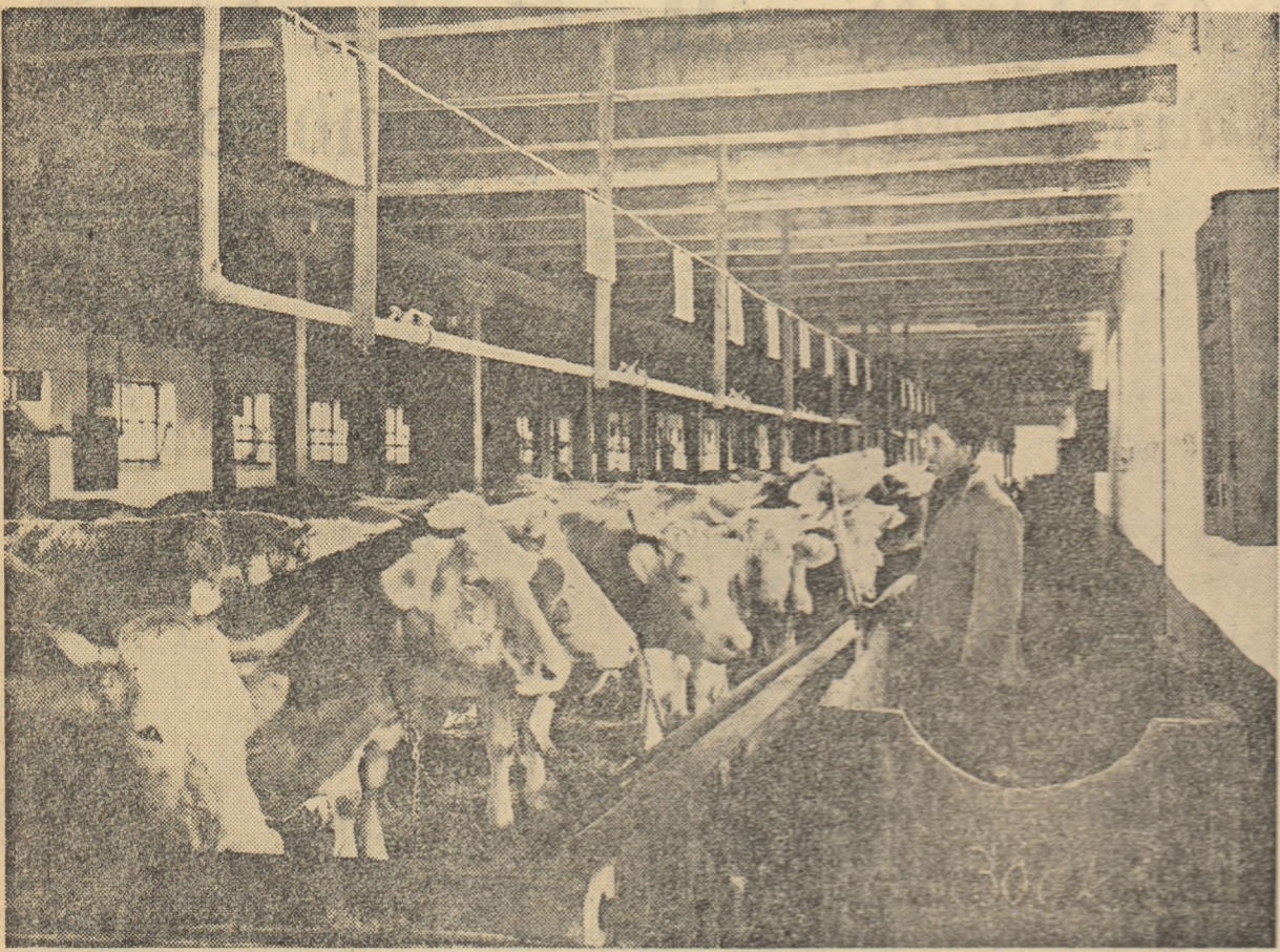
Membrul gospodăriei colective din comuna Hălchiu, regiunea Braşov, au acumulat o bună experienţă în creşterea vacilor de lapte. În fotografie: unul dintre îngrijitorii „servind” vacilor raţia de dimineaţă.