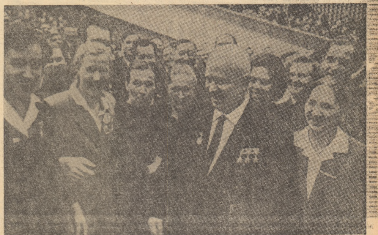
N. S. Hruşcov în mijlocul unui grup de delegaţi

Cu cuvîntarea lui D. A. Kunaev, prim secretar al C.C. al P.C. din R. S. S. Kazahă, care sa ocupat de