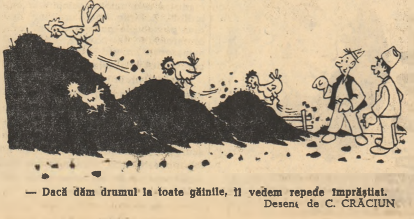
Dacă dăm drumul la toate găinile, îl vedem repede împrăștiat.