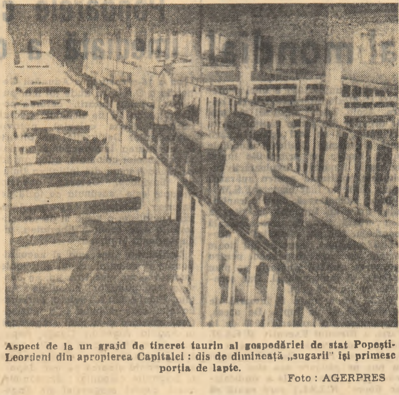
Aspect de la un grajd de tineret taurin al gospodăriei de stat Popoștii-Leordeni din apropierea Capitalei...