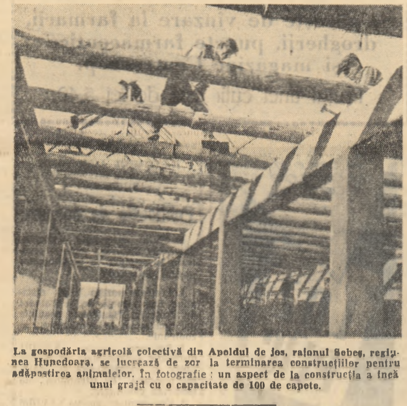
La gospodăria agricolă colectivă din Apoldul de Jos, raionul Bebeș, regiunea Hunedoara, se lucrează de zor la terminarea construcțiilor pentru adăpostirea animalelor...