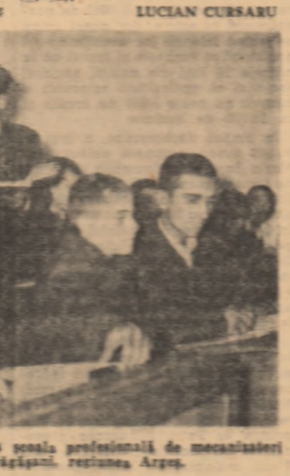
Un aspect de la o oră de curs la școala profesională de mecanicizatori de pe lângă S.M.T. Drăgășani, regiunea Argeș.

Un sprijin eficient trebuie să îl dea însă și Direcția Generală S.M.T. și alte organe din Minister, însoțind, prin organizațiile de bază, activitățile școlare și rezolvarea în privința lipsei unor mese, de menajonieră, a echipamentului de lucru pentru elevi. Dacă acesta din urmă nu poate fi reparat în întregime de către Baza centrală M.A., pentru a nu se face modificări de talie — operație în fond de durată și neeconomică — ar fi poate mai indicat să se comande acest echipament în unitățile specializate și confecție în cadrul regiunii. De asemenea, fiindcă un păș și în luna decembrie și fiindcă popile nu pleacă pe plan regional rezolvate necesarul construcției școlilor din adănc de clad și dormitoare, se impune găsirea unor modalități cât mai eficiente: repartizarea acestui material din alte regiuni, blocarea lui etc.