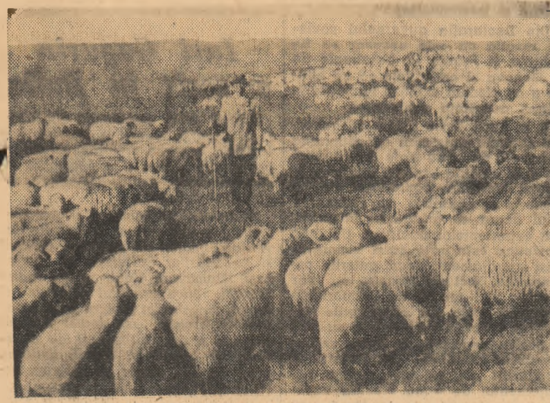
Zilele frumoase din toamna acestui an au înlesnit ca turmele de oi să continue pășunatul. În fotografie: o parte din oile gospodăriei agricole colective din Bratovoesti, regiunea Oltenia