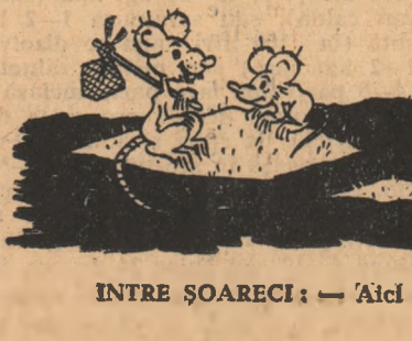
INTRE ȘOARECI — Aici ne putem face o nouă casă!

mai bună calitate. Din păcate, mai sînt și tractoriști care umbresc succesele celorlalți și care în goană după hantri uită de calitate; ei ridică plugul mai în față executînd arături la adîncimi necorespunzătoare, nu trag capetele la marginea tarlelor sau lasă porțiuni nearete. Așa au procedat unii tractoriști din brigăzile a X-a și a XIV-a de la S.M.T. Receaș care de cîrind au fost aspru criticați în foaia volantă. Nici mecanizatorii de la S.M.T. Costești, care deservesc gospodăria colectivă „Drumul belșugului” din comuna Ionești, nu se pot lăuda cu calitatea arăturii făcute de ei pe unele tarle.