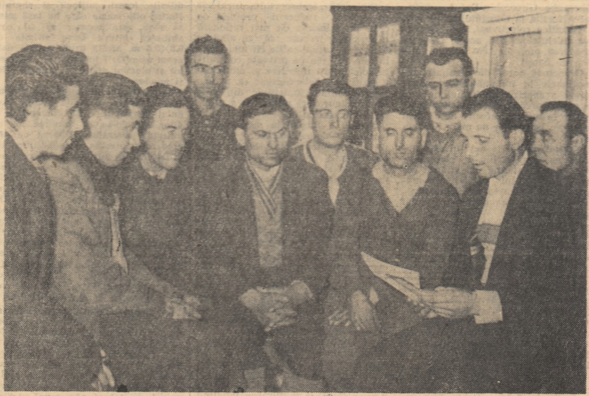
La colțul roșu al gospodăriei colective din comuna Colacu, regiunea București, s-a adunat din nou un grup de colectivisti. De astă dată ei ascultă cu interes lectura recomandărilor Consfățirii pe țară a țărănilor colectivisti.