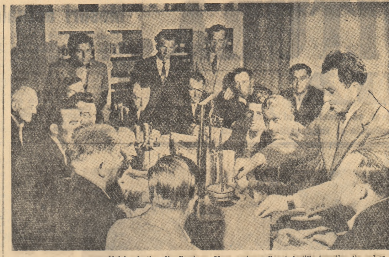
La masa laborator a gospodăriei colective din Comloșu Mare, regiunea Banat, lecțiile teoretice din cadrul cursurilor agrozootehnice se împletesc cu demonstrații practice de laborator.