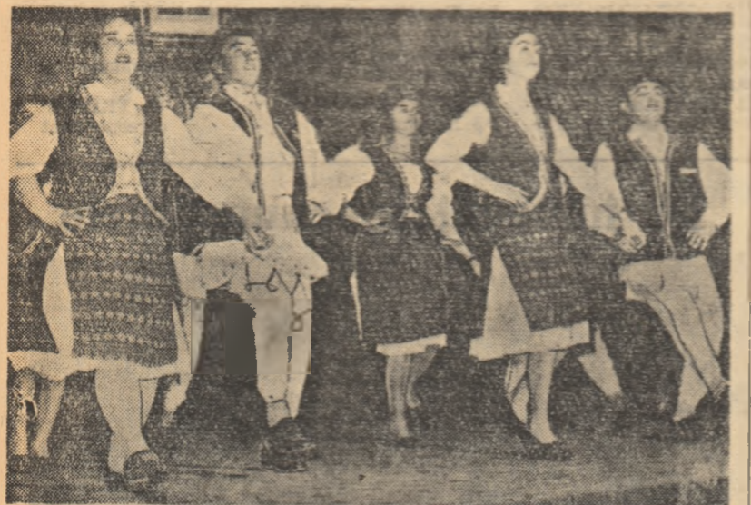
E-hiba de dansuri a gospodăriei colective din Ianca, regiunea Galați, este mult apreciată atîc de colectivisti din această comună, cît și de cei din satele învecinate.

cărți bune. În sat funcționează 20 cercuri de citit cu 310 participanți. De asemenea, s-au ținut 3 recenzii, iar la concursul „Iubiți cartea” au concursat de curînd 14 colectivisti care au primit insigna de „Prietenii cărții”. De asemenea, mai trebuie remarcat și faptul că în cele 3 luni biblioteca a fost înzestrată cu încă 1105 volume în valoare de 7737 lei. I. PETEAN correspondent