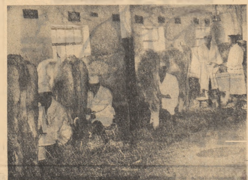
Echipa de mulgători a gospodăriei colective din Lunca execută mulsul în condiții din cele mai igienice.

— Îmi pare rău că n-am la mine Chemarea Consfătuirii pe țară a țărănilor colectivști să vă arăt ce-am însemnat în ea. Multe mi-au rămas întipărite în minte despre traul bun pe care-l duc colectivștii și din alte documente ale Consfătuirii pe țară a țărănilor colectivști care au fost dezbătute și prelucrate în ședințele de partid și în adunările de la câminul cultural. Bunde trebă fac colectivștii din Ceacu, care au mii de animale, milioane de lei la fondul de bază, iar viața colectivștilor îi tocmai ca a orșenilor. Dar nu numai documentele Consfătuirii m-au ajutat să mă conving și mai mult de viața nouă, îmbelșugată, pe care ne-o putem fi în gospodăria colectivă. Prin grîni organizatelor noastre de partid, la câminul cultural au fost organizate multe întîlniri cu colectivștii fruntași din satele vecine. Aceștia ne povesteau despre munca și traul lor. Apoi, de multe ori, am fost și noi întovărășii din Vișoara în vizită pe la alte colective din satele de prin împrejurimi. Am văzut că toți colectivștii o duc bine. Tot așa vreau s-o duc și eu cu familia mea. Uite de aceea m-am trecut la colectivă.