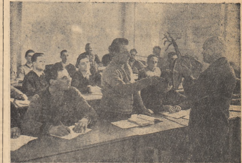
În comuna Vidra, raionul Giurgiu, funcționează un centru școlar pentru pregătirea de contabili și brigadierii legumicolii din gospodăriile colective. În fotografie: un aspect de la o oră de legumicultură, la una din clasele de brigadierii legumicolii