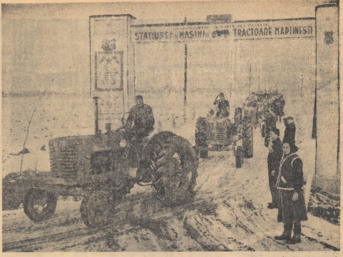
Organizându-și bine munca, mecanizatorii de la S.M.T. Mărdinești, raionul Satu Mare, au terminat de reparat înainte de vreme cele peste 260 de tractoare, precum și mașinile agricole cu care vor lucra în primăvară pe ogoarele gospodăriilor colective. O bună parte din ele se îndreaptă de acum — așa cum se vede în fotografie — spre unitățile agricole socialiste din raza lor de activitate.