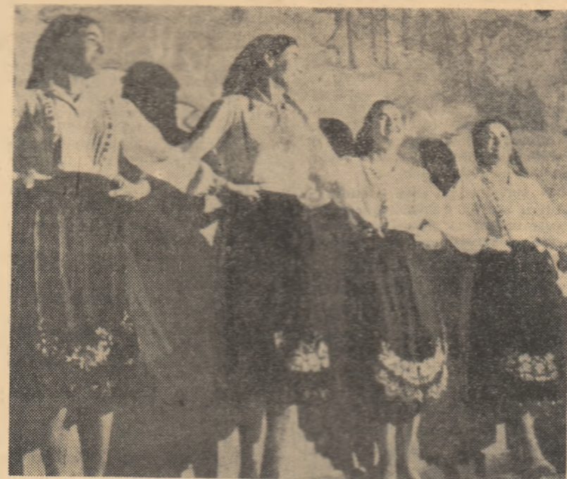
Echipa de dansuri a colectivului de artiști amatori din comuna Tenovo, raionul Iambol.