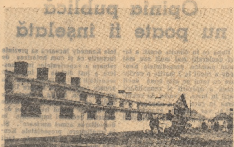
Gospodăria colectivă din Mădăraș, regiunea Crișana, este cunoscută pentru rezultatele sale bune obținute în sectorul zootehnic. Acestea se datoresc într-o mare măsură și faptului că gospodăria a asigurat animalelor condiții bune de adăpostire. Priviți în fotografie un nou grajd construit de colectivisti de aici.