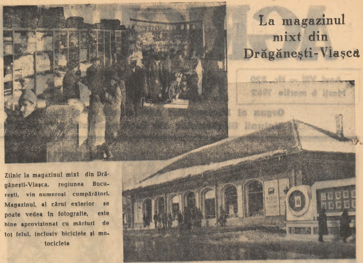
Zilnic la magazinul mixt din Drăgănești-Vlașca, regiunea București, vin numeroși cumpărători. Magazinul, al cărui exterior se poate vedea în fotografie, este bine aprovizionat cu mărfuri de tot felul, inclusiv biciclete și motocicletele.