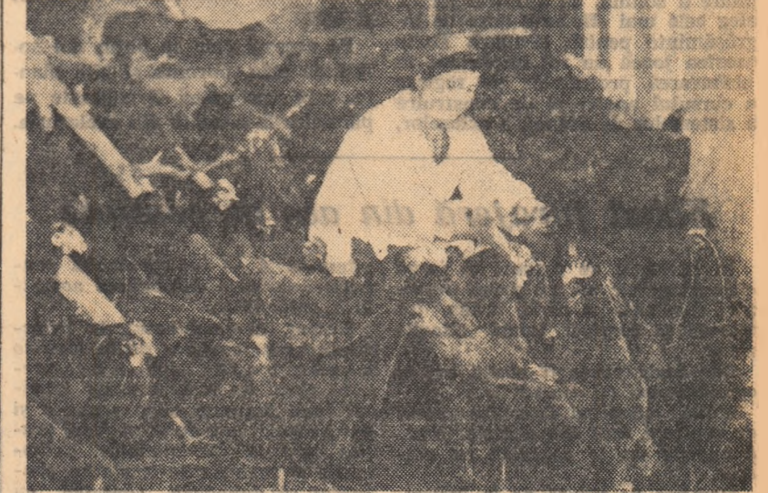
La gospodăria agricolă de stat Zorleni, regiunea Iași, a fost mult dezvoltat sectorul avicol. În fotografie apare dintr-îngrijitoare din rația de dimineață păsărilor pe care le îngrijeste.