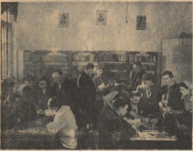
La clubul gospodăriei agricole colective din comuna Tibucani, regiunea Băcu, unde există și o frumoasă bibliotecă, se adună în fiecare seară zeci de colectiviști tineri și vîrstnici, pentru a împrumuta cărți de citit, a juca șah etc., așa cum se vede în fotografie.