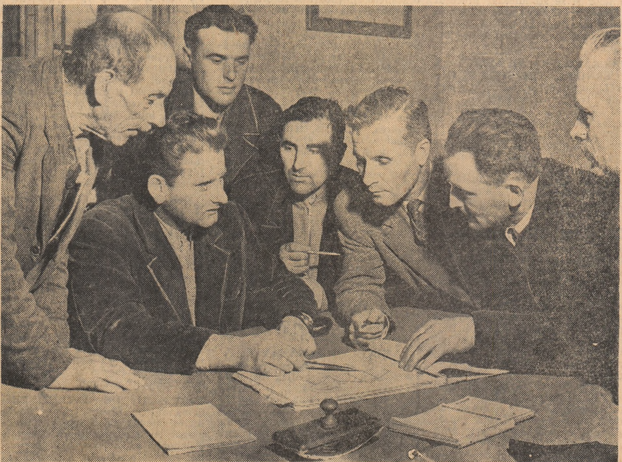
De curînd, colectiviiștilor din satele Luncași și Gilgorești, regiunea Cluj, și-au unit gospodăriile colective, formînd o singură unitate mare, cu largi posibilități de dezvoltare. In fotografie: noul consiliu de conducere al gospodăriei colective unificate, discutînd despre măsurile ce trebuie luate pentru buna desfășurare a muncilor agricole de primăvară.