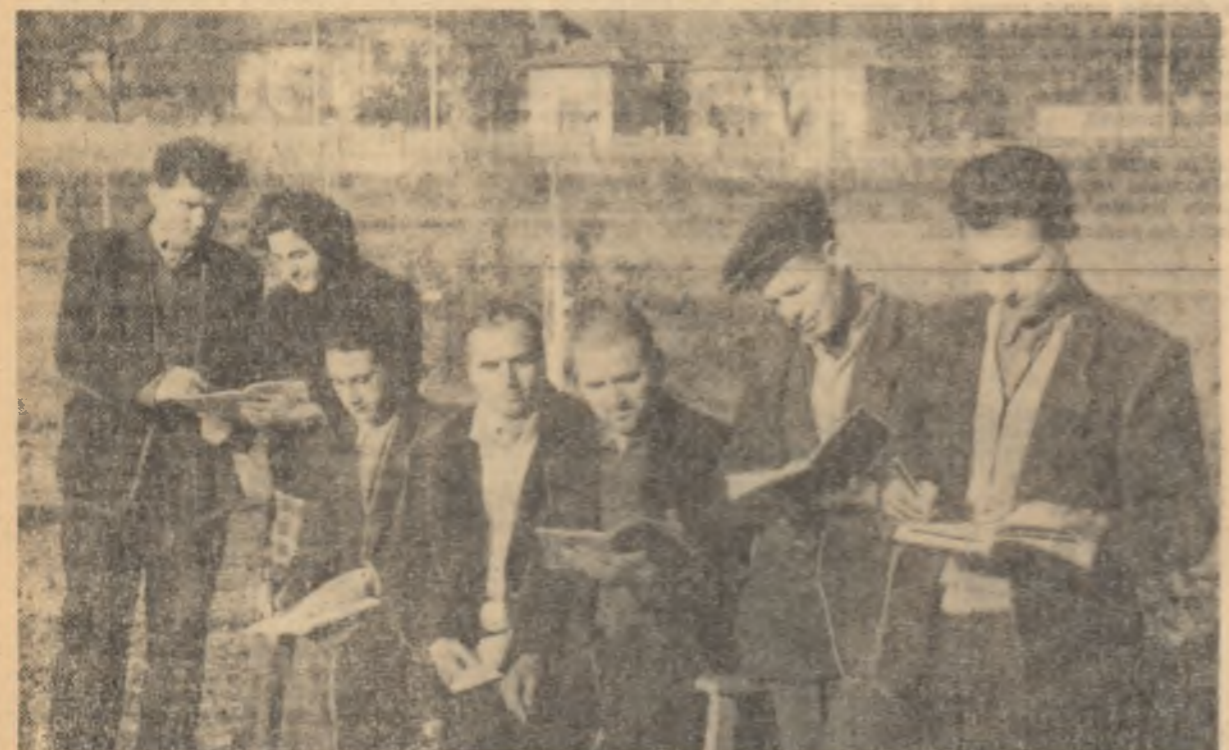
O zi frumoasă, cu soare, te atrage fără îndoielă în parcul școlii „Elevii” pe care îi vedeți sînt colectivști veniți la cursuri la centrul școlar agricol din Rm. Sărat

la centrul de combaterea eroziunii solului de la Aldeni și „Exploatarea mașinilor de semănat porumb”. Închelarea colectivizării agriculturii a pus la ordine zilei școlarizarea unui număr și mai mare de cadre de colectivști și într-un ritm mult intensificat. Dar fiindcă spațiul