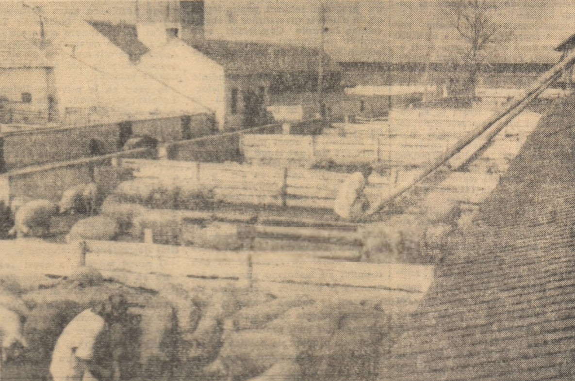
Un aspect din îngrășătorie

De asemenea, trîgînd învîntăminte din lucrările Consiliului de Stat și ale Jărilor Colectiviste, la care am participat și eu, noi vom dezvolta mult și ferma de păsări. Pînă acum au și fost aduși peste 14.500 pui de o zi și cît 16.500 cît am prevăzut în plan. În felul acesta numărul de păsări ce revine la suta de hectare va fi de peste 500 capete.