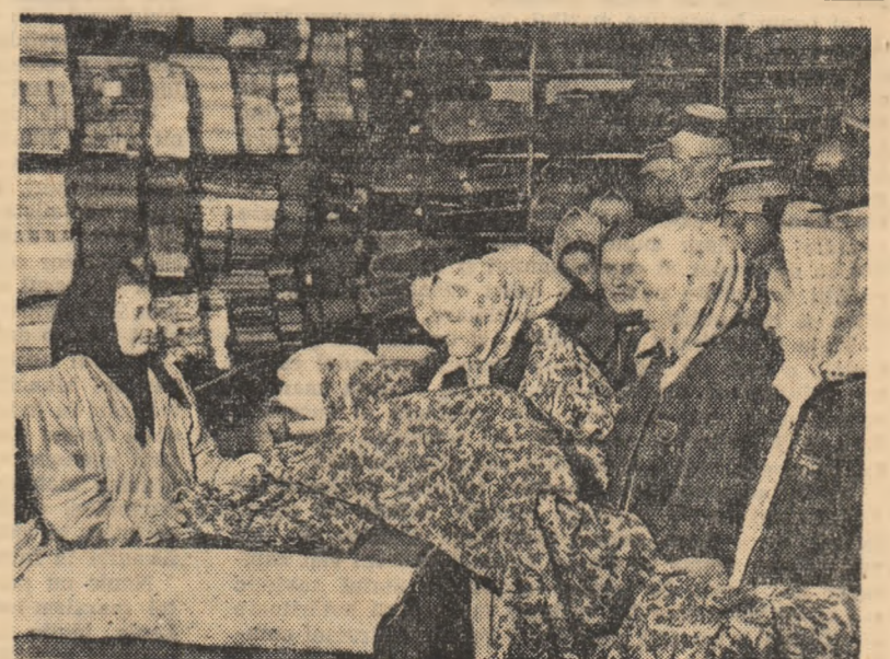
Bine aprovizionat, la magazinul universal din comuna Negrești, raionul Oaș, vin zilnic zeci de colectivști pentru a-și cumpăra mărfurile dorite.