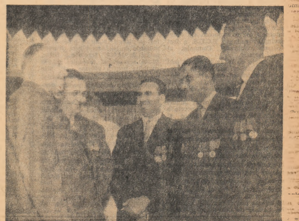
Un grup de deorați într-una din pauze

În să-mi exprim, ca și tovarășii care au luat cuvîntul anterior, deplina probare față de măsurile propuse dezbaterii în sesiunea extraordinară a Marii Adunări Naționale, convingerea că sînt uniți în jurul partidului, Comitetului său Central în frunte cu tovarășul Gheorghe Gheorghiu-Dej, clasa muncitoare, țărănimia colectivivistă, intelectualitatea, desfășurînd întregul elan, energia și capacitatea creatoare ce le sînt caracteristice, vor înfăptui cu deplin succes noile sarcini cerute de avîntul general al economiei și culturii socialiste din patria noastră. (Cuvîntarea a fost subliniată cu puternice aplauze).