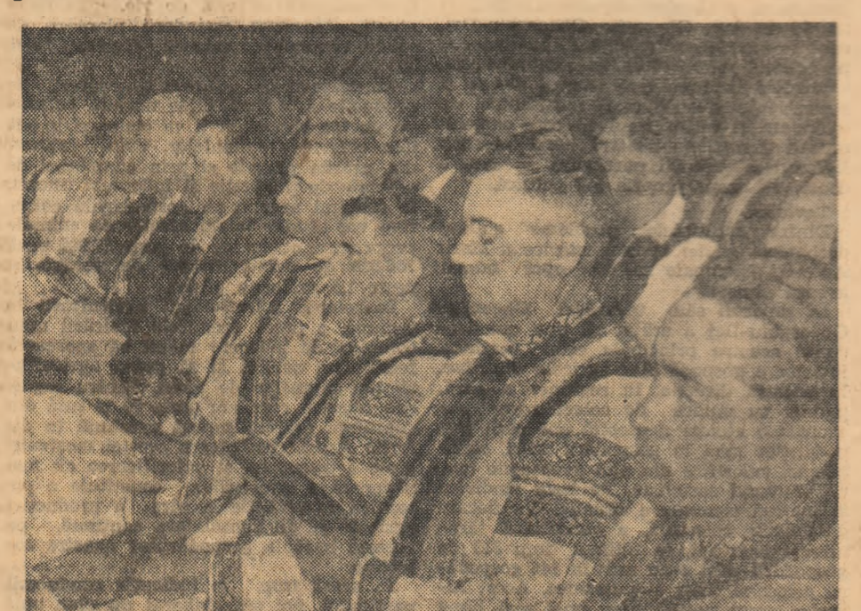
Aspect din timpul lucrărilor