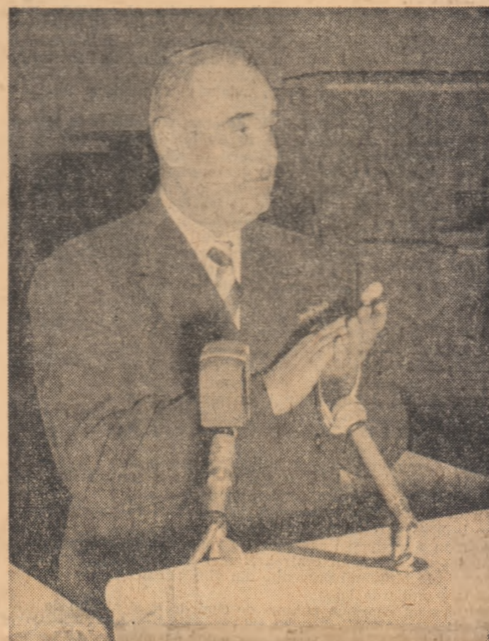
oglindește profundul democratism al regimului nostru, participarea nemijlocită la conducerea statului a poporului muncitor, făuritor al destinului sale.

Acest caracter cu adevărat reprezentativ al sesiunii de față