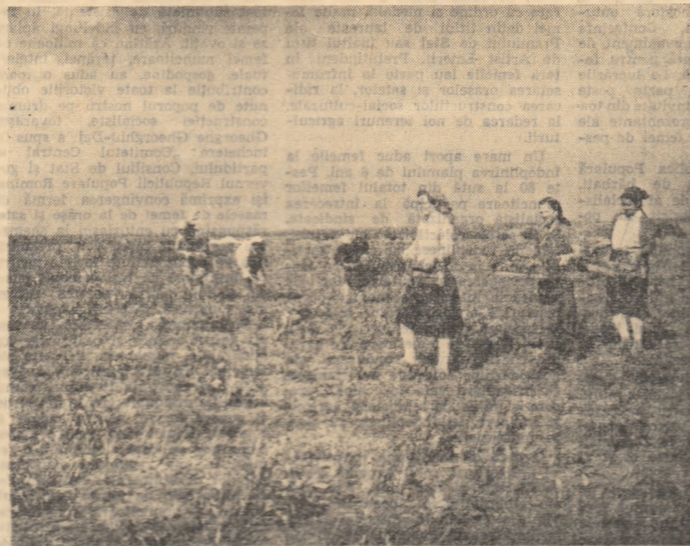
Gospodăria agricolă colectivă „22 August, din regiunea Dobrogea, a acordat o atenție deosebită culturii de ceapă verde. În fotografie: un grup de colectiviste recoltează ceapa verde pentru a fi livrată pe piața orașului Constanța.

ardel iulii, 2.000 de castraveți, 40.000 de legături de ceapă, 50.000 bucăți salată și altele legume de calitate. Gospodăria și-a propus să realizeze în acest an din valorificarea legumelor 1.371.000 lei, față de 960.000 lei cît a obținut anul trecut.