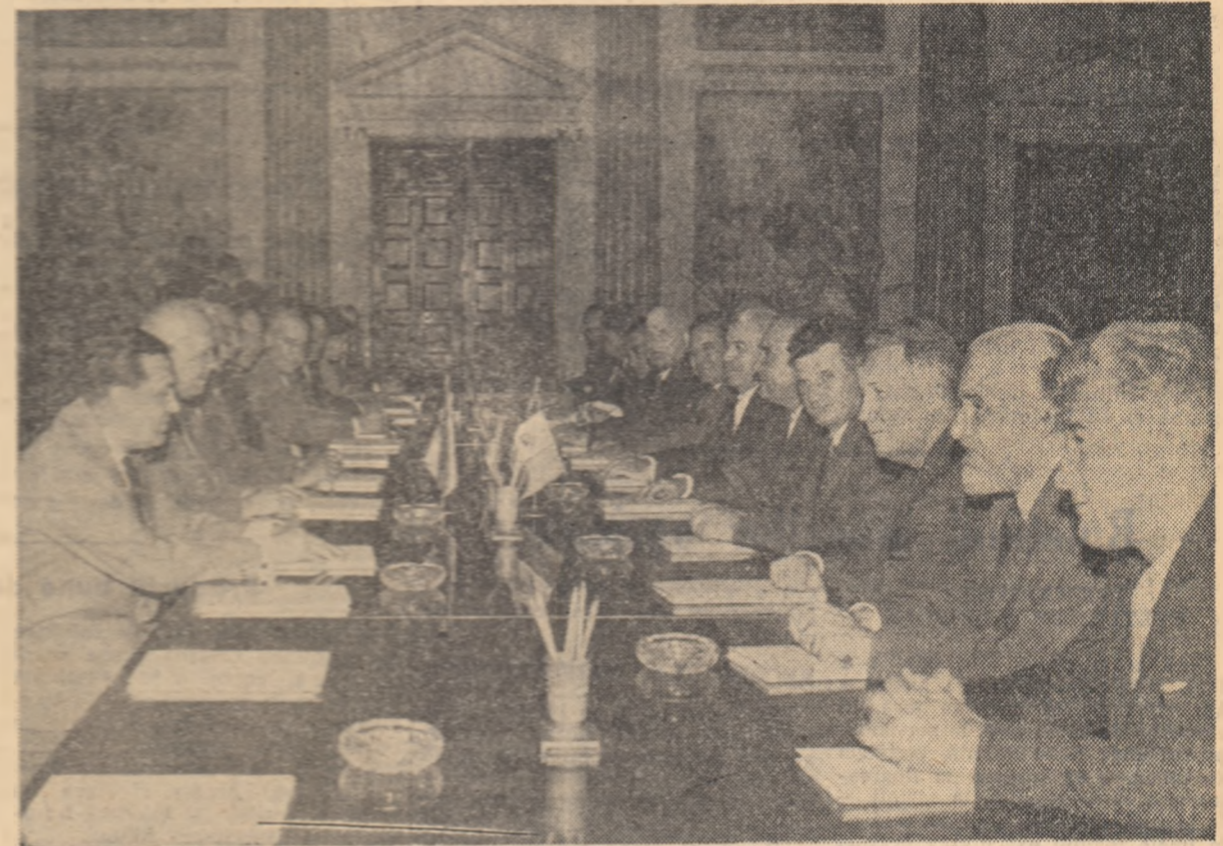
În timpul convorbirilor