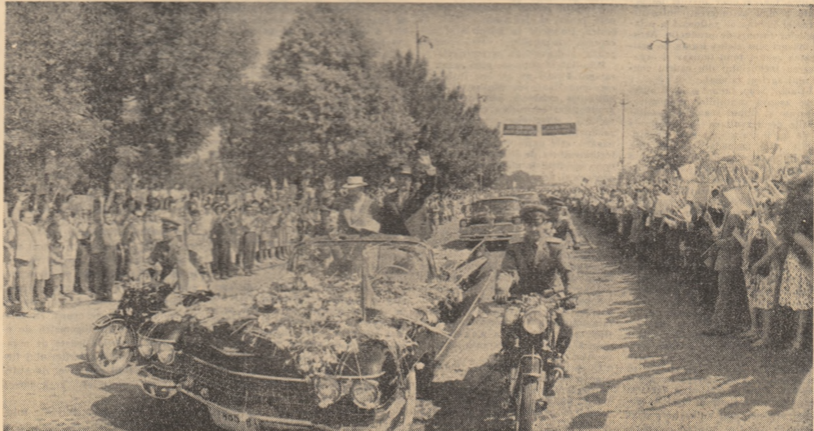
Pe străzile Capitalei

O dată cu caldele urale și multele flori, poporul nostru spune înalților oaspeți: Bun soști!