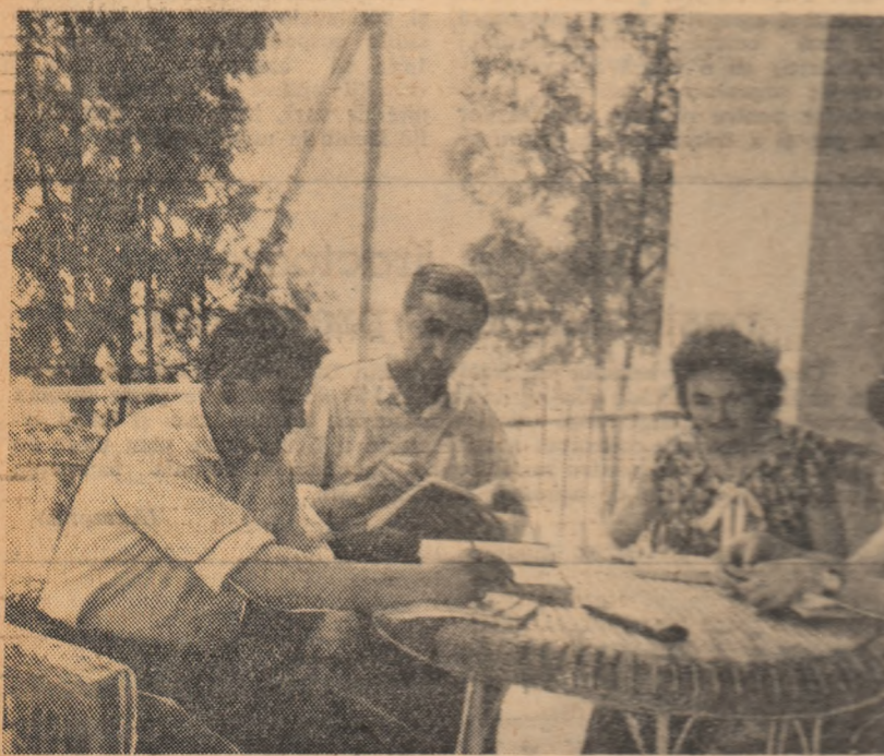
La Casa Agronomului din Timișoara a venit pentru pregătire o nouă serie de cursanți din gospodăriile agricole colective din regiunea Banat. Înălțat-lătr-o după-amiază, la stațiune industrială.