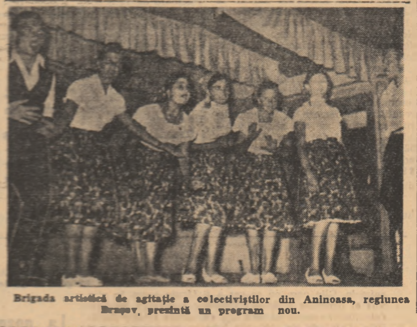
Brigada artistică de agitație a colectiviștilor din Aninoasa, regiunea Brașov, prezintă un program nou.