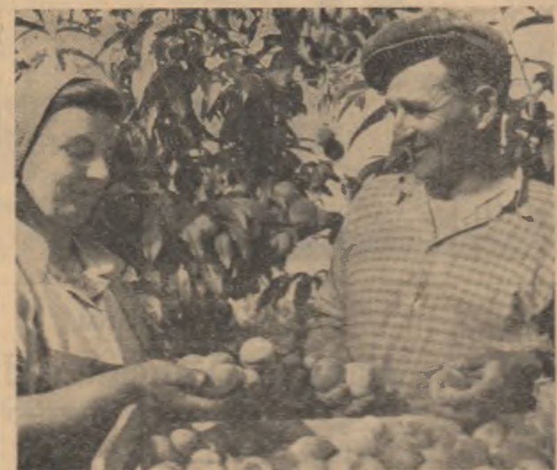
La gospodăria colectivă din Cenad, raionul Sînzicului Mare, recolțatul piersticilor este în toi.