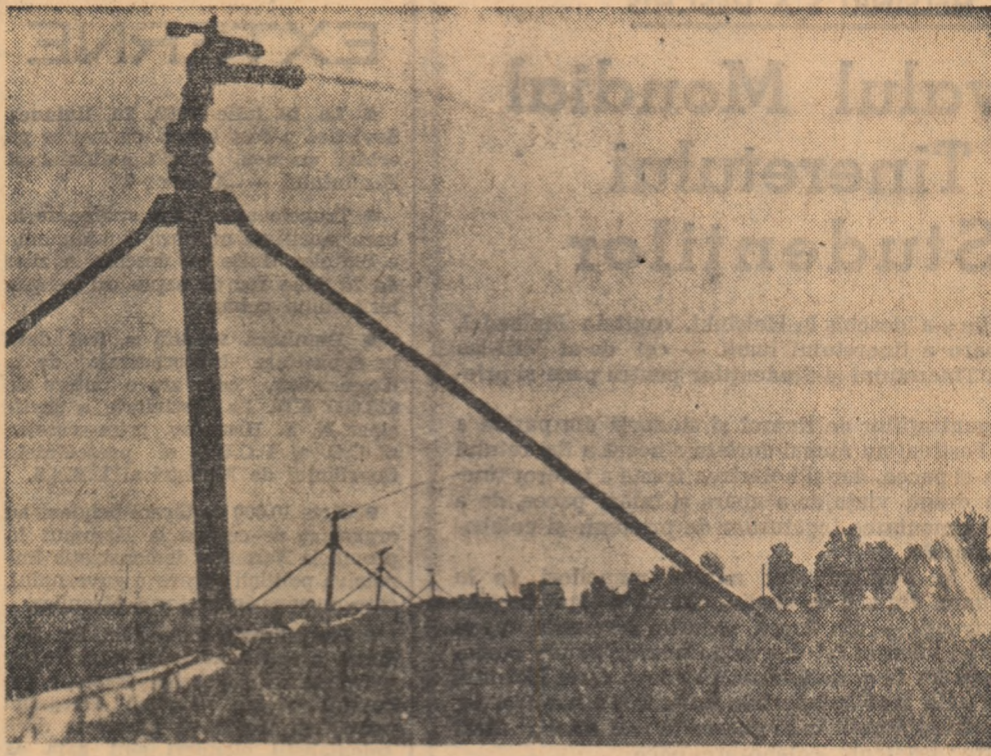
Gospodăria de stat Ottenita, regiunea București. Irigatul culturii de porumb prin aspersiune.

Pînă în prezent, în cadrul sondării și concentrării culturilor în cele mai favorabile locuri sub aspect pedoclimatic, în R.P.R. au fost create primele 80 centre specializate în culturi medicinale. Alci se formează cultivatori specializați. Se cuvine de subliniat cu deosebire că la aceste centre, prin aplicarea întotdeauna măsurilor agrotehnice recomandate de știința agricolă, au fost obținute producții medii de 2-3 ori mai mari