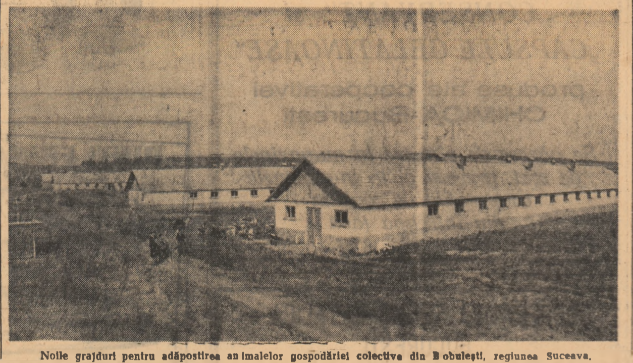
Noile grajduri pentru adăpostirea animalelor gospodăriei colective din Bobulești, regiunea Suceava.