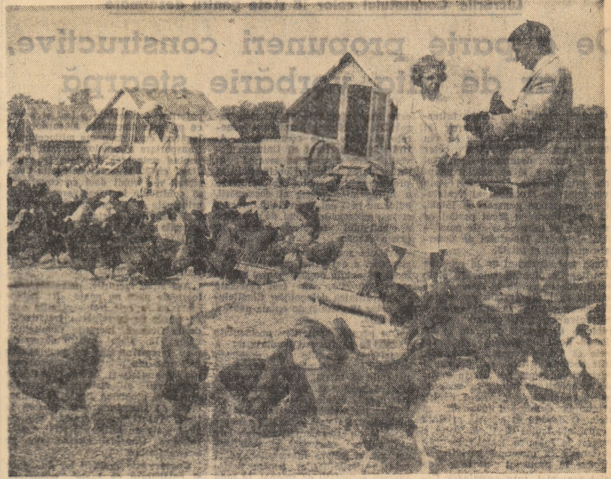
Aspect de la tabăra de vară a Stațiunii experimentale zootehnice Popăuți, regiunea Suceava.

tehnic. În anul 1961, am cultivat porumb pentru siloz pe o suprafață de 150 de hectare. Un deosebit accent am pus — ca și în acest an de altfel — pe asigurarea densității de plante la hectar, care a fost de peste 45.000. Însămînțatul s-a făcut în rînduri cît mai drepte, sîmînța fiind îngropată la adîncimea de 10—12 cm. Ca lucrări de întreținere am aplicat 3—4 prașile mecanice și 2 prașile manuale. Brigadierul de cîmp, în perioada prașirilor manuale — cînd s-a efectuat rîritul plantelor — a supravegheat în permanență această lucrare, dînd indicațiile necesare și luînd măsurile corespunzătoare în scopul asigurării