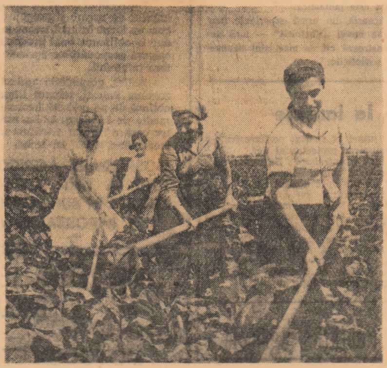
Tutunul cultivat la gospodăria colectivă din comuna Spătăreasa, regiunea Ploiești, este întreținut în continuare cu multă grijă.