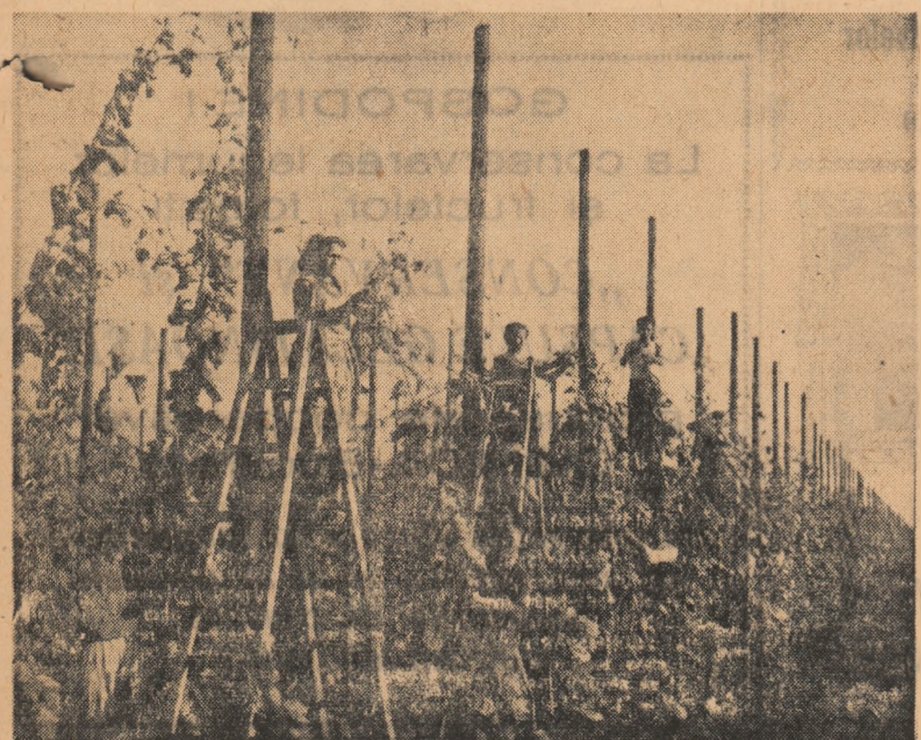
Plantația de port-altei din gospodăria agricolă de stat Răducești, regiunea Ploiești, este bine îngrijită și promite o producție bună de coarde. În fotografie: un aspect din timpul cîmpului și legatului coardelor de port-altoi.