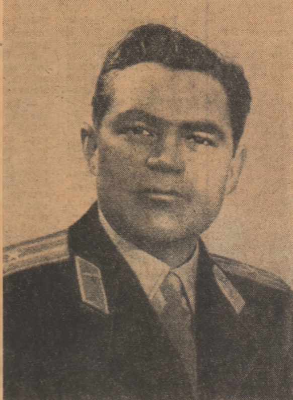
Cosmonautul maior ANDRIAN GRIGORIEVICI NIKOLAEV