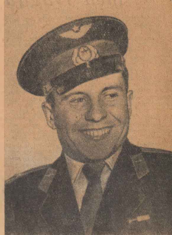
Cosmonautul Lt.-colonel PAVEL ROMANOVICI POPOVICI

La 11 august 1962, ora 11.30 (ora Moscovei) în Uniunea Sovietică a fost plasată pe o orbită circumterestră nava cosmică satelit „Vostok-3”, pilotată de maiorul ANDRIAN GRIGORIEVICI NIKOLAEV, cetățean al Uniunii Sovietice. La 12 august 1962, ora 11.02 (ora Moscovei) pe orbita de satelit al Pămîntului a fost plasată nava cosmică „Vostok-4”, condusă de pilotul cosmonaut sovietic PAVEL POPOVICI. Obiectivele navelor cosmice „Vostok-3” — — Obținerea de date suplimentare cu privire la influența condițiilor zborului cosmic asupra organismului omenesc. — Studierea capacității de muncă a omului în condițiile imponderabilității. — Efectuarea de către om a unui anumit volum de observații științifice în condițiile zborului cosmic. — Perfecționarea sistemelor navelor cosmice, a mijloacelor de telecomunicație, dirijare și aterizare. După cum a transmis pilotul cosmonaut Nikolaev, precum și potrivit datelor obținute cu ajutorul sistemelor telemetrice și de televiziune, el a su-