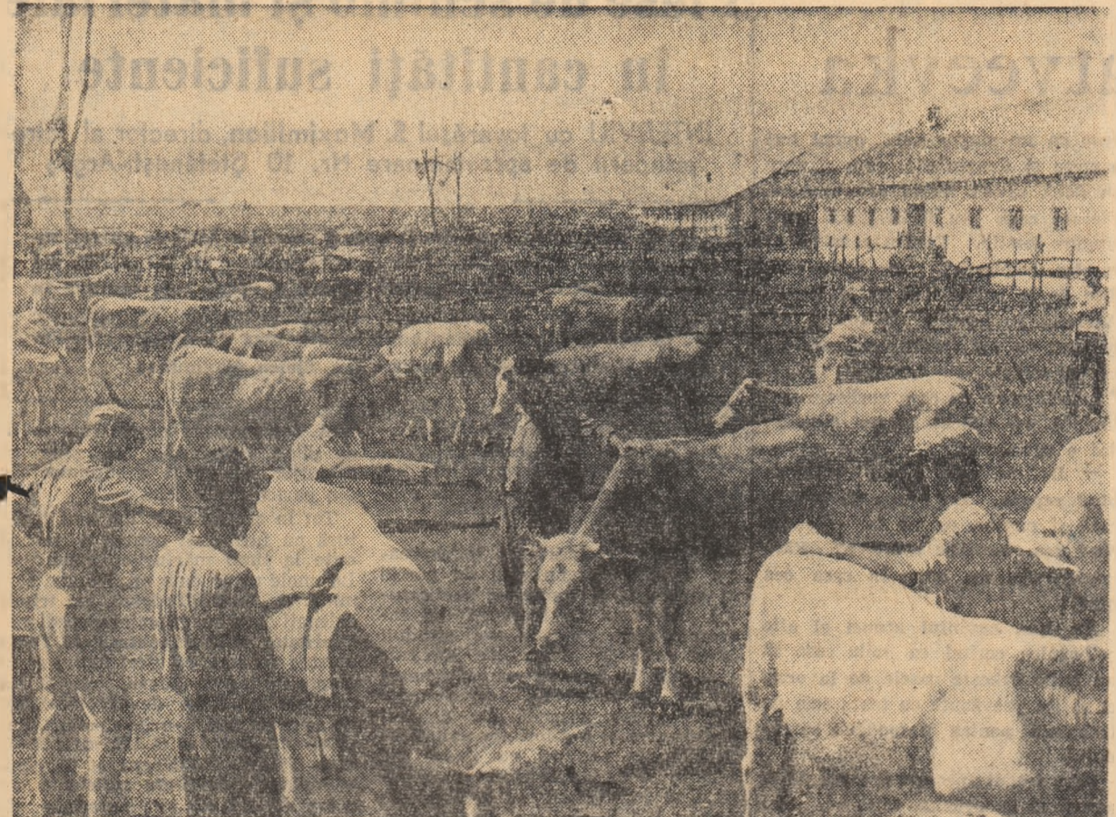
Aspect de muncă la ferma de vaci a gospodăriei colective din comuna Plevna, raionul Lehliu, regiunea București