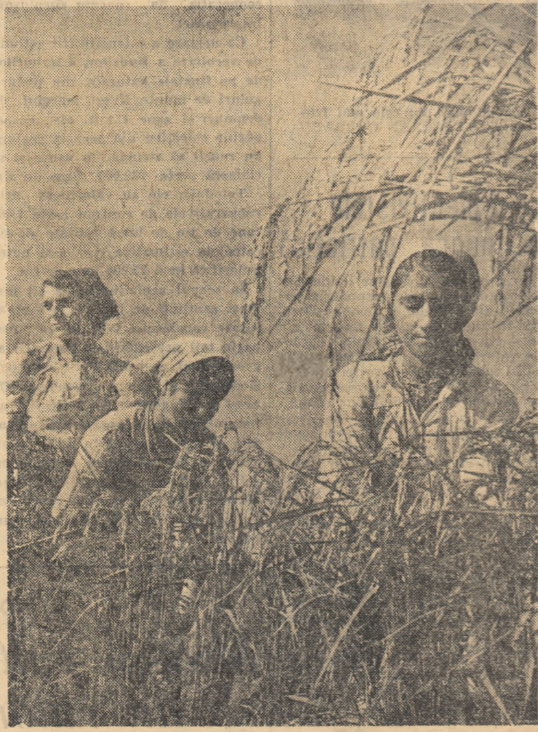
La punctul experimental Chirnoși al Institutului de cercetări pentru cultura cerealelor și plantelor tehnice a început recoltatul orzului.