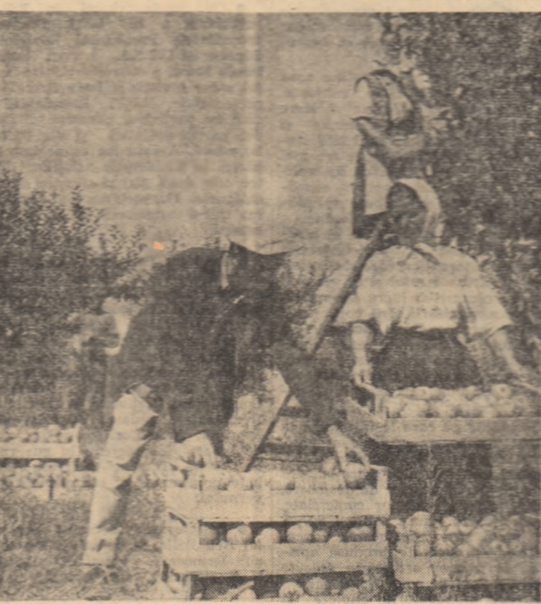
La gospodăria de stat Breasta, regiunea Oltena, au fost recoltate pînă acum peste 7.000 kg. de mere. În fotografie: O parte din brigada a 7-a condusă de Teodor Glib la recoltat