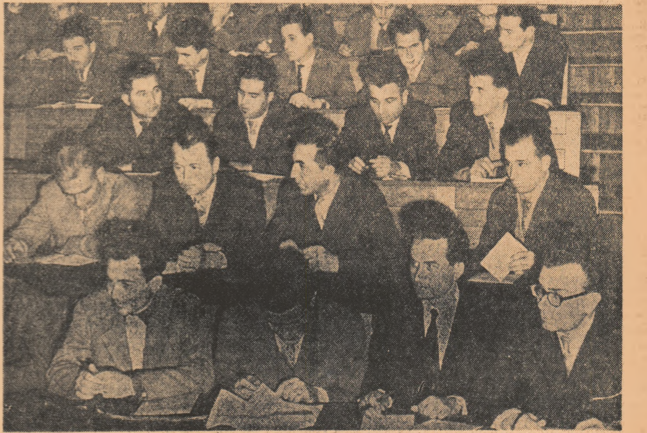
Aspect de la ședința secției de mecanizare a agriculturii

Stațiunile de mașini și tractoare fiind dotate de la an la an cu un număr mare de mașini noi, vor lua măsuri de instruire temeinică a mecanicizatorilor cu privire la exploatarea, întreținerea și păstrarea acestor mașini în bune condiții.