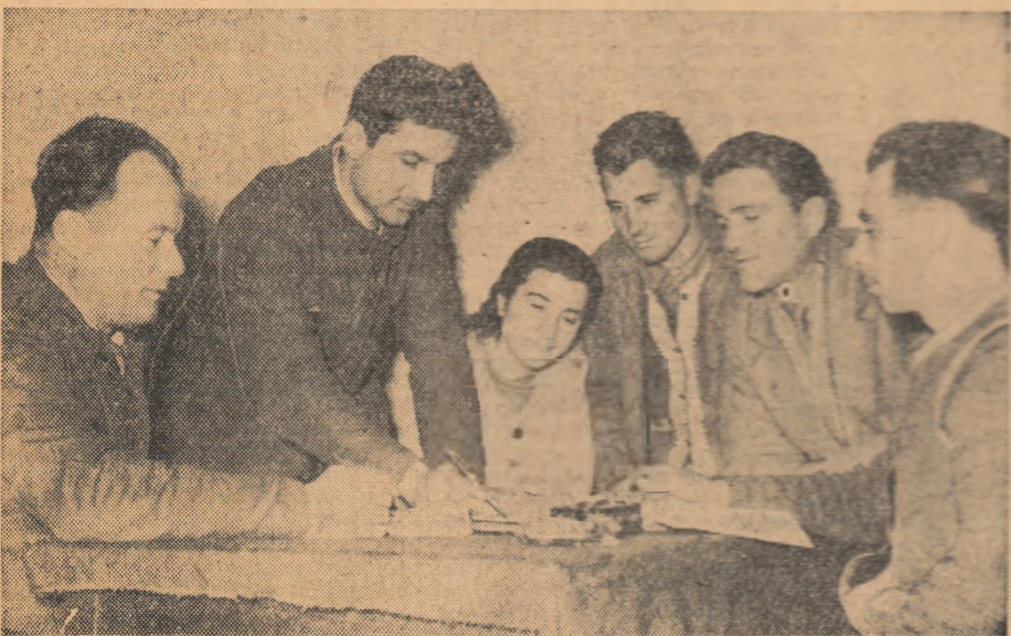
Membrii consiliului de conducere al gospodăriei colective din Sălcuța, raionul Tîu, dezbătau principalii indicatori de plan pe anul 1963.