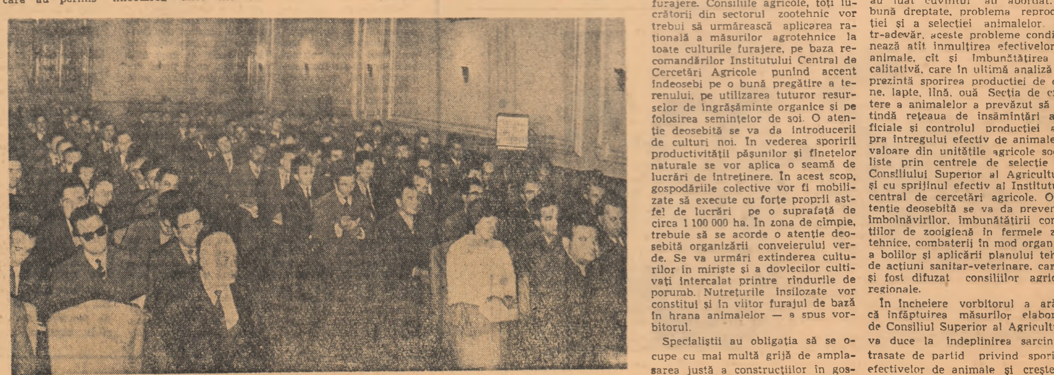
În timpul ședinței secției de creștere a animalelor

În încheiere vorbitorul a arătat că înfăptuirea măsurilor elaborate de Consiliul Superior al Agriculturii va duce la îndeplinirea sarcinilor trasate de partid privind sporirea efectivelor de animale și creșterea productivității acestora.