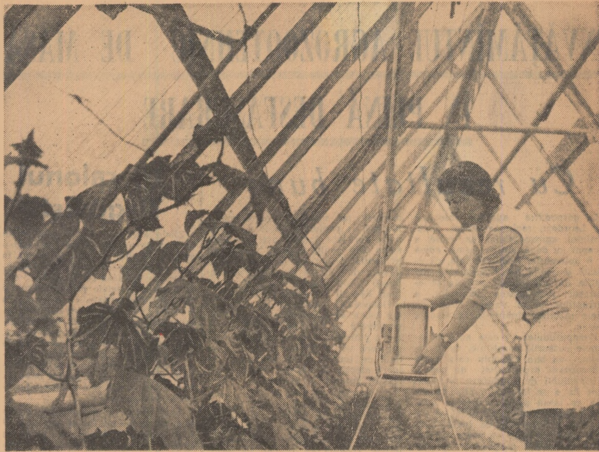
Afară cîmpul e acoperit cu zăpadă, dar în serele Institutului de cercetări hortivocole din Băneasa cultura de castraveți s-a dezvoltat frumos. În fotografie: laboranta Vetu Florica verificînd temperatura aerului din seră