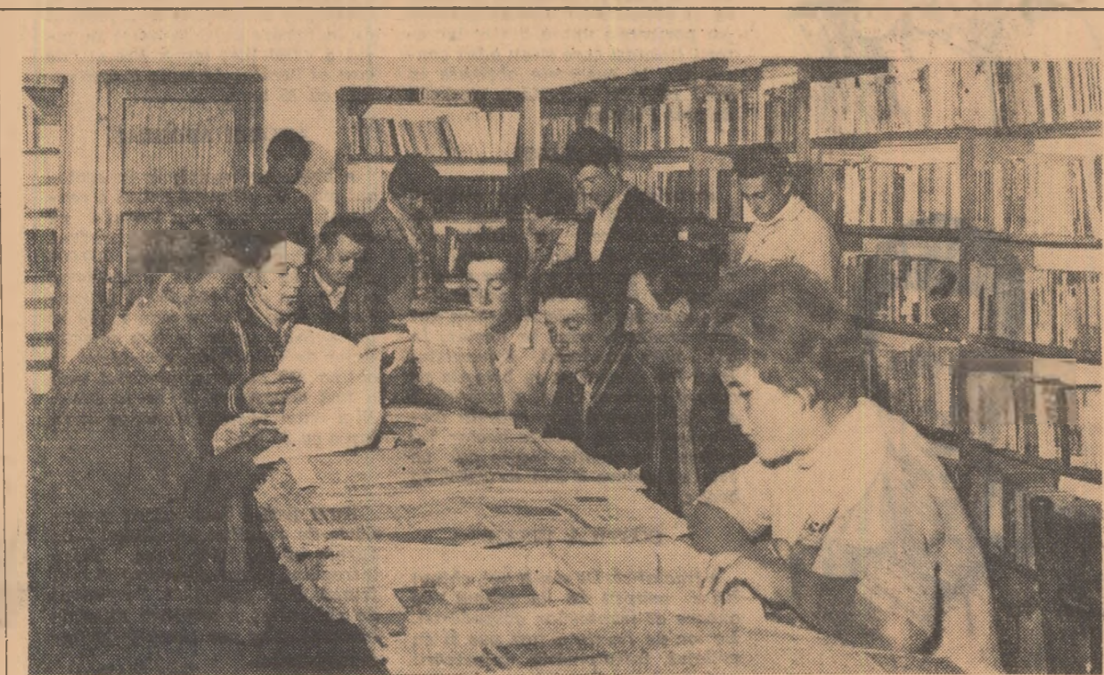
Zeci de cititori tineri și vîrstnici vin în fiecare seară la bibliotecă din comuna Topalu, regiunea Drobeta, pentru a citi ziar și reviste și a cerceta ultimele noutăți literare și agrozootehnice sosele acelu.

Jocul de șah este îndrăgit de un număr tot mai mare de tineri și vîrstnici din satele noastre. Iată un grup de amatori ai acestui sport asaltînd la o partidă aprig disputată, la cîminul cultural din comuna Șocariu, regiunea București.