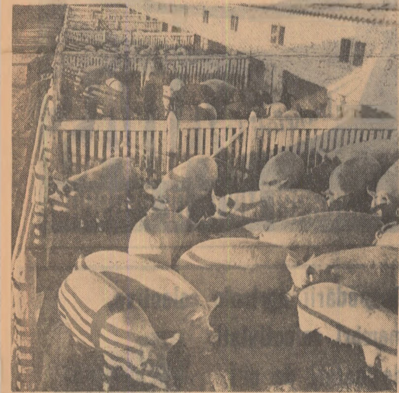
Membrii gospodăriei colective din comuna Corbu de Jos, regiunea Dobrogea, acordă o mare atenție dezvoltării averii obștești. Între altele, ei au mărît mult în 1962 ferma de porcine