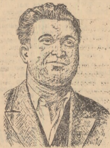
lungi de 28—30 cm cu care măsurau distanța între plante, dornici să asigure densitatea de 37—38 mii de plante recoltabile la hectar. Și acest lucru ne-a reușit pe deplin. La prașit, colectivității intrau de dimineață în lan și lucrau pînă tîrziu pentru a prinde timpul optim. Apoi, cînd sistemul retribuției suplimentare, toate echipele au depus interes ca pămîntul să

echipă a cerut să se mai facă o discuire și o grăpare, asigurînd semințelor un bun pat germinativ. Lucrările de întreținere au fost făcute ca „la carte”. Înainte de prima prașilă colectivității și-au confecționat beșugoare