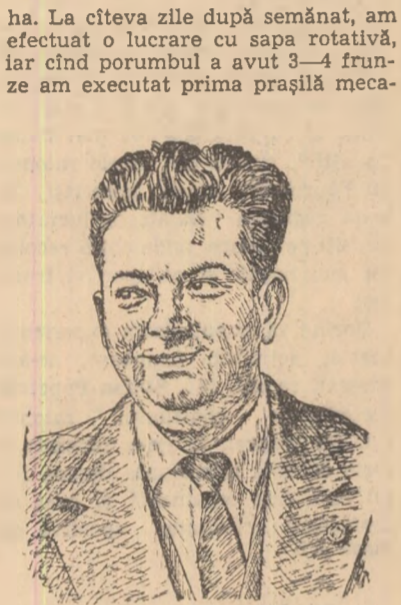
ncă și prașila manuală pe rînd. La cea de-a doua prașilă am făcut răritul manual, lăsînd între cuburii cite 25—28 cm și păstrînd plantele cele mai bine dezvoltate. În anul 1962, noi am efectuat 3 prașile me-

Gospodăria noastră a organizat în ultimii 4 ani loturi demonstrative, încercând diferite hibrizi de porumb. După aceste încercări am ajuns la concluzia că porumbul care se comportă cel mai bine pe terenurile noastre, este hibridul dublu 409. De aceea, în anul 1962, noi am cultivat numai acest hibrid, care ne-a permis să asigurăm o densitate medie de 37—38 mii de plante la