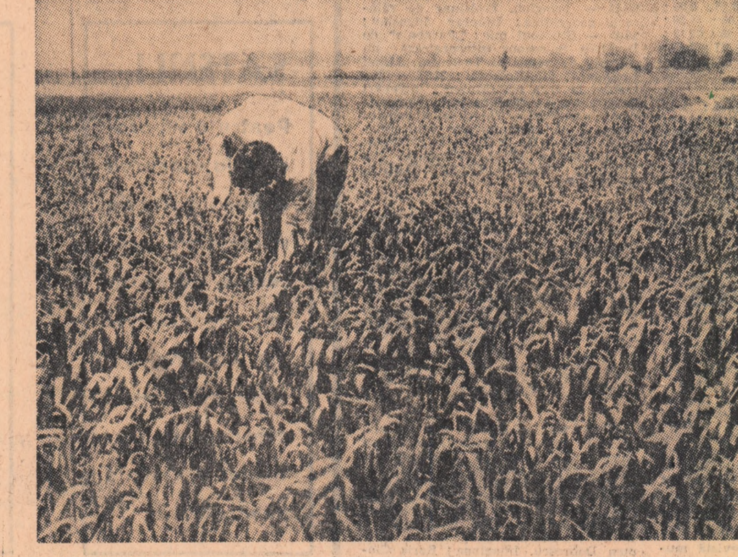
Se fac observații științifice într-un lan de grâu