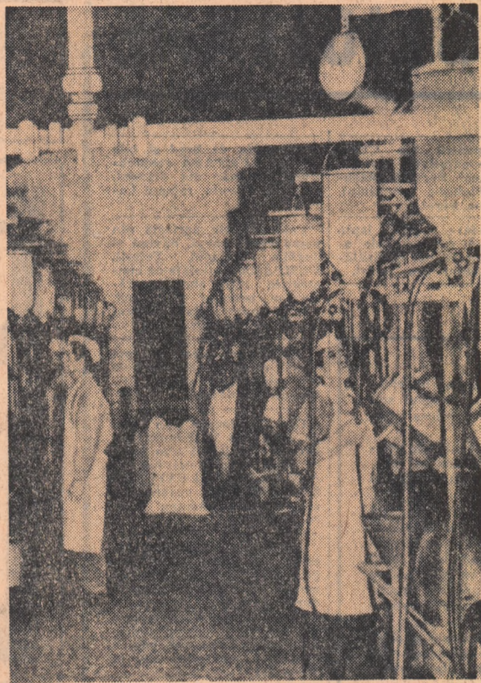
Sală modernă pentru muls mecanic, într-o crescătorie de vaci din Franța.