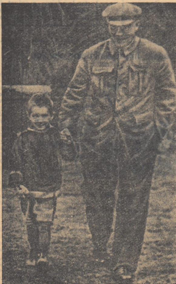
V. I. Lenin și nepotul său