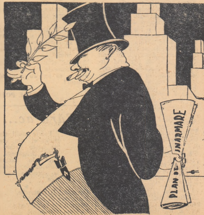
POLITICIANUL: — Niciodată să nu știe sîngă ce face dreapta.

Unii politicieni din S.U.A., purtători de cuvînt ai celor mai reacționare cercuri imperialiste, încearcă să se prezinte în fața opiniei publice drept susținători ai păcii. De curînd însă, Robert Murphy, secretar de stat adjunct al S.U.A., a găsit de cuviință să preamărească iarăși blocul războinic al Atlanticului de nord, și să ceară intensificarea cursei înarmărilor.