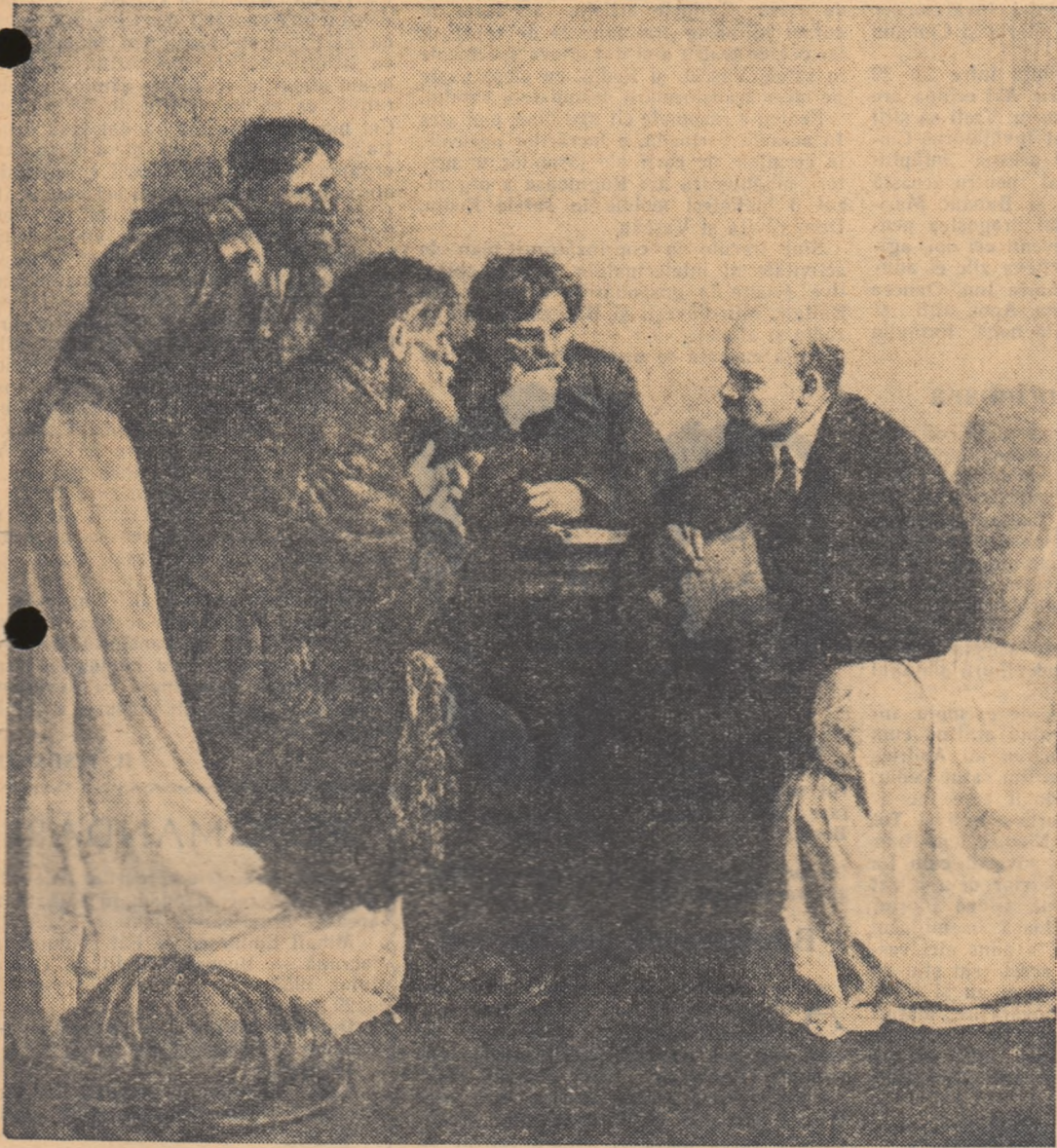
Delegație de țărani în vizită la V. I. Lenin (pictură de V. Serov)

ANUL 59 Seria II-a Nr. 434 | 8 pagini 15 bani | Miercuri 18 aprilie 1956