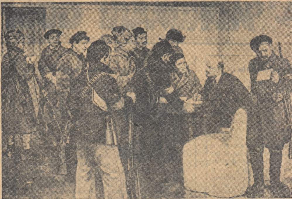
V. I. LENIN la Smolnii în Octombrie 1917