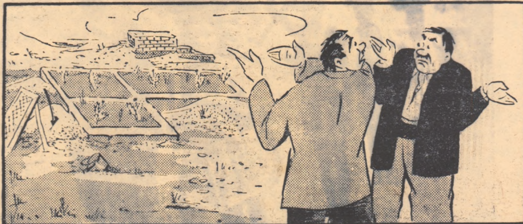
ȘEFUL SECȚIEI CULTURALE: — Ce facem, tovarășe? Pe șantierul căminului au crescut buruienii! PREȘEDINTELE: Eu nu știu! Tehnicianul agricol se ocupă cu plivitul. (Desen de G. BADEA)

Lucrările de construire a căminului cultural din satul Opațița, raionul Ceacova, deși începute acum patru ani, sînt lăsate baltă.