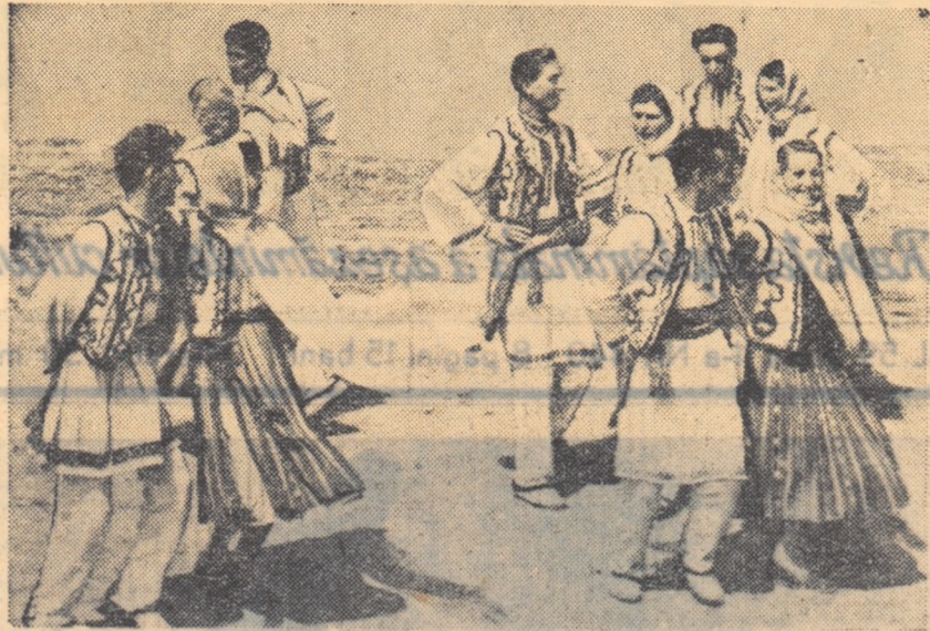
În cadrul fazei regionale al celui de-al 4-lea Concurs, echipa de jocuri a căminului cultural din satul Pantazi, comuna Dirvari, regiunea Ploiești, execută locul „Busuiocul”.

Se extinde inițiativa intelectualilor din regiunile București și Suceava