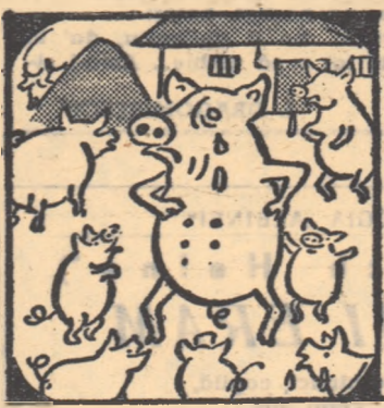
— Cit or mai avea de gînd să ne fie la post negru din cauza cheii ăleia?