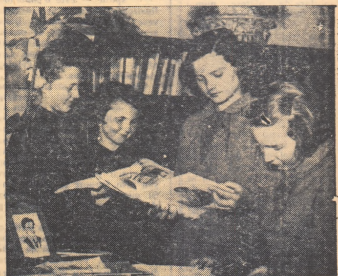
Un grup de pioniere, eleve în clasele a V-a, a VI-a și a VII-a, răsfoiesc ultimele publicații ce au sosit la biblioteca casei de copii Nr. 1 din Timișoara.