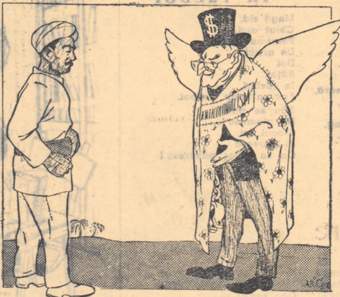
— Apropie-te prietene, doar am venit... să te ocrotesc! (Desen de NIC. NICOLAESCU)