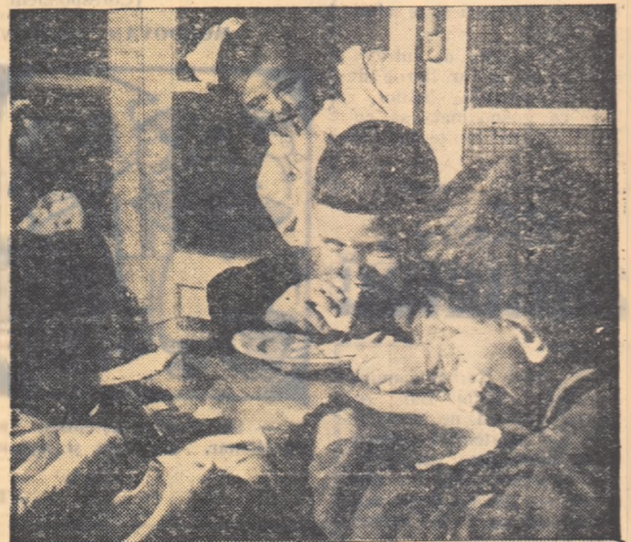
La căminul de copii al fabricii „Ianoș Cserdas” din Oradea.