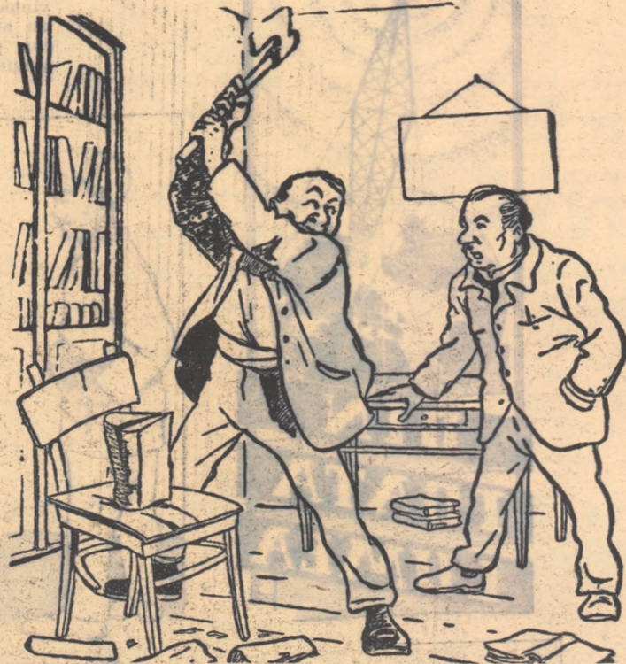
INTR-UN CĂMIN CULTURAL: — Dă mai cu milă, că strici toporul ăla și e-al meu... (Desen de RIK AUERBACH)