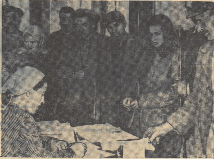
Membrii gospodăriei agricole colective „Ilie Pintilie” se înscriu să vîndă din produsele lor pentru achiziții.

Exemplul colectivizatorilor din Batăr se extinde în toată