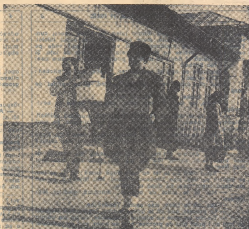
Ce bine e să ai magazin universal în satul tău! Și mai ales să găsești aici tot ce-ți poțtește inima. Așa gîndesc țărăni muncitori din comuna Dor Mărunt, raionul Lehliu, ori de cîte ori se duc să facă cumpărături. În fotografie: După ce își valorifică produsele prin cooperativă, țărăni muncitori își cumpără de la magazinul din sat căldări, crubere, aparate de radio și alte lucruri necesare în gospodăriile lor.

Va-să-zică, ei... oamenii țafia știu totul!