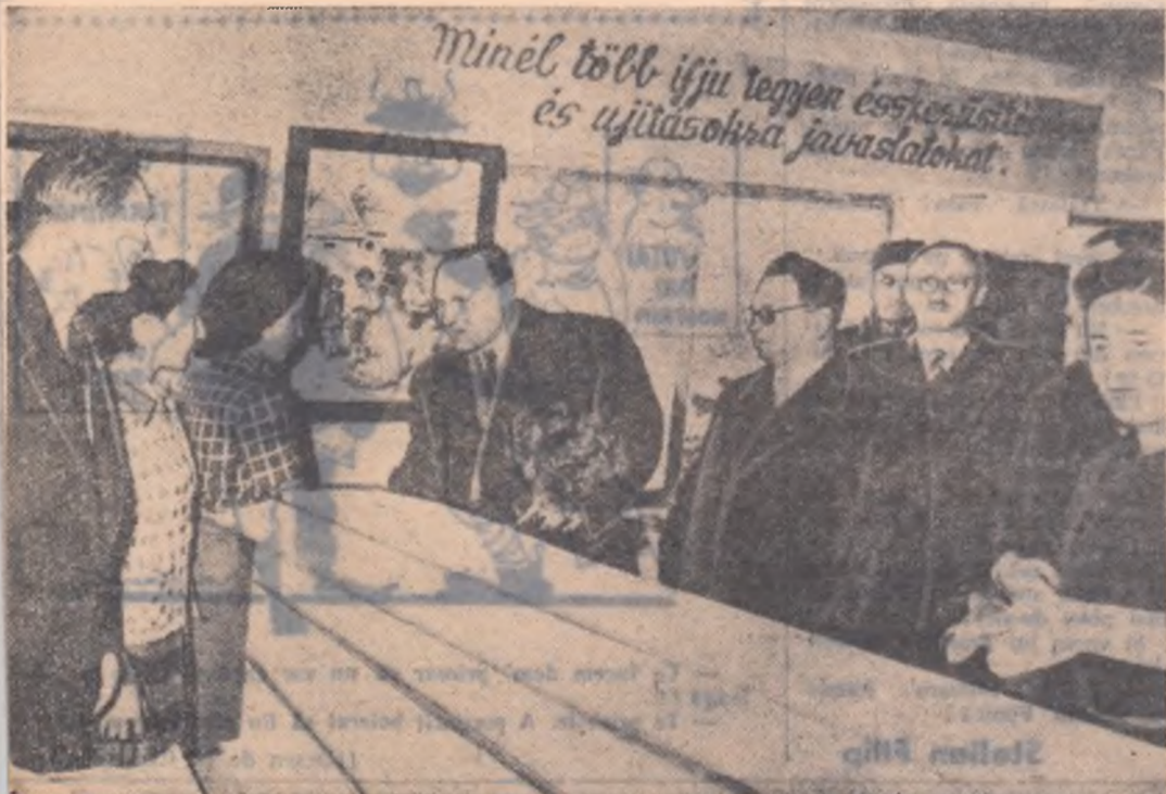
Delegația guvernamentală și de partid a R. P. Ungare în frunte cu tov. Kadar Janos în mijlocul muncitorilor de la fabrica „Simo Geza” din Tirgu-Mureș