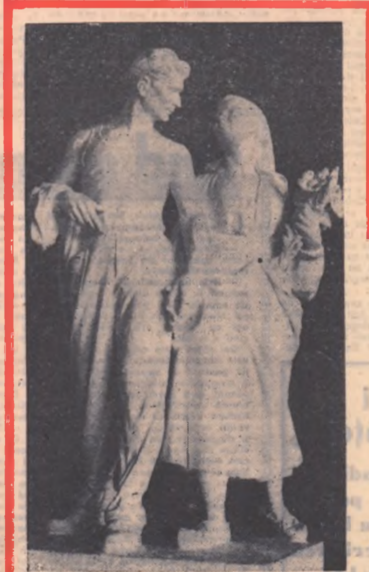
ZOE BAICOIANU Muncitorul și țărancă (sculptură)