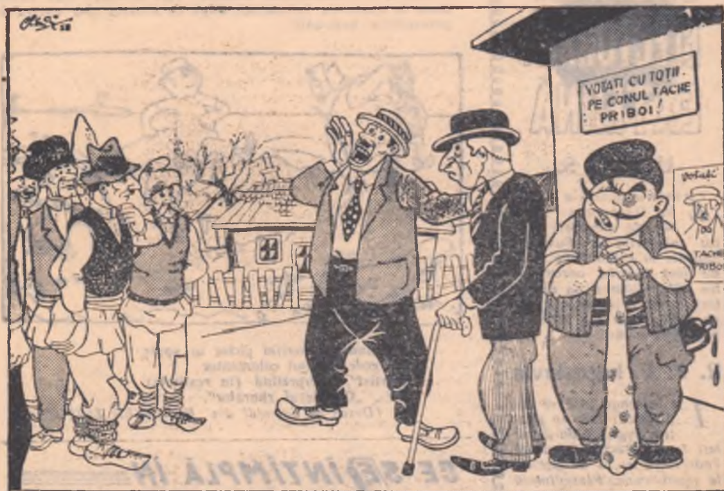
— Frați țărani... În spatele nostru stă o glorioasă tradiție de luptă!... (Desen de A. CLENCIU)