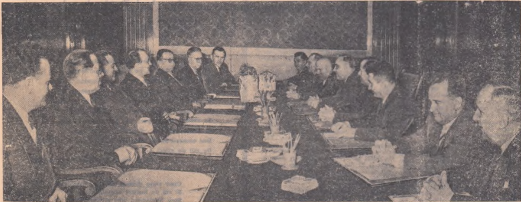
La Consiliul de Miniștri al R. P. Romine au început convorbirile între delegația guvernamentală și de partid romină și cea ungară

La 2 martie, veniți cu toții la vot. Să dăm cu încredere votul nostru candidaților Frontului Democrației Populare!