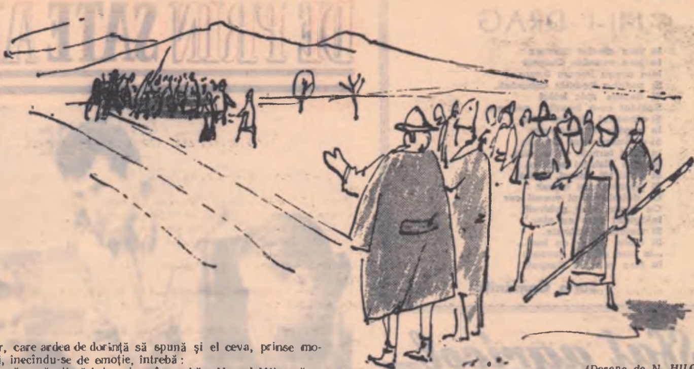
(Desene de N. HILOHT)

Gligor, care ardea de dorință să spună și el ceva, prinse mo- mentul și, înecându-se de emoție, întrebă: