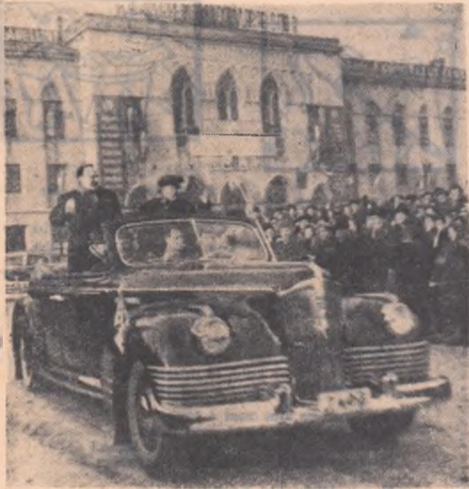
Înălții oaspeți împreună cu conducătorii de partid și de stat romîni sînt aclamați cu căldură de cetățenii orașului Iași.

● Conform hotărîrii Consiliului permanent de solidaritate a popoarelor Asiei și Africii, ziua de 1 martie a fost proclamată zi de luptă pentru interzicerea armei atomice.