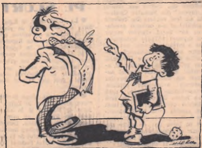
— Măi copile, tu știi că m-au ales primar? — Urta! Inseamnă că o să trec și eu clasa, tată!