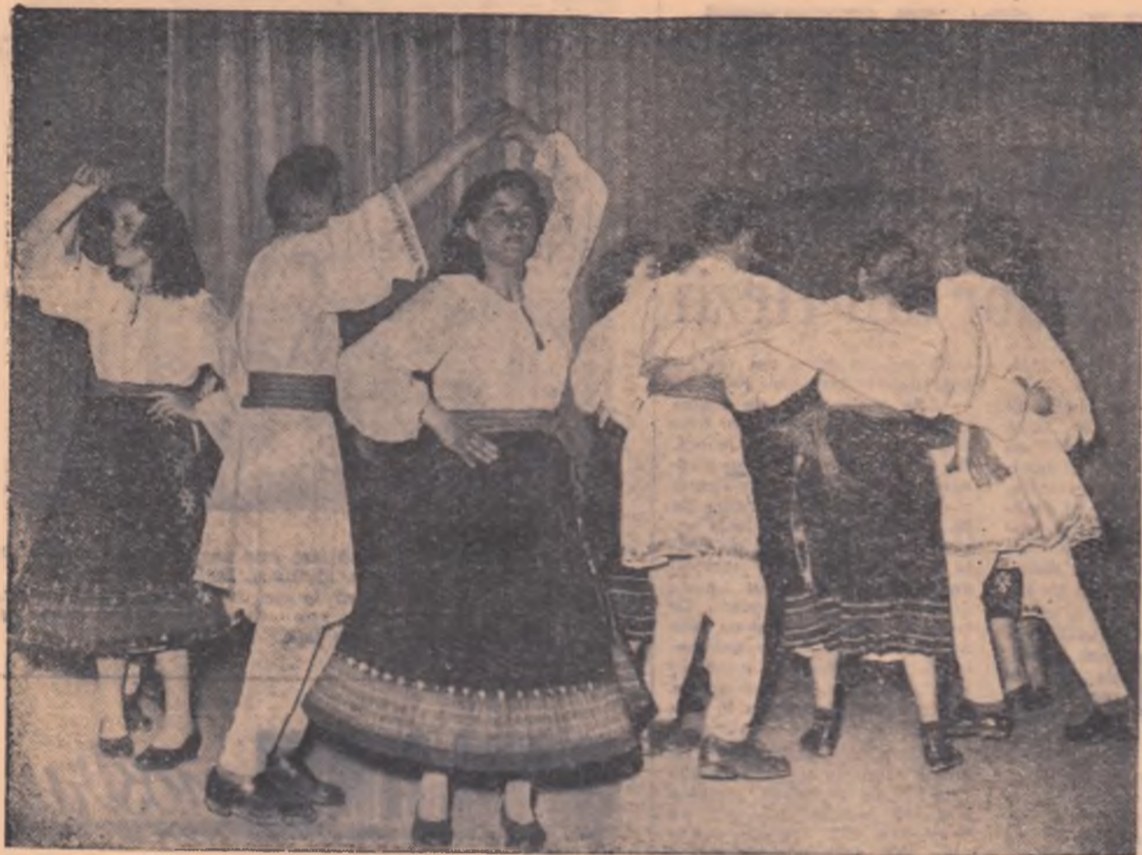
Tineri și tinere din suita de dansuri a gospodăriei agricole de stat din Domnești, executând un joc popular în cadrul întrecerilor culturale a echipelor artistice de amatori din unitățile agricole ale regiunii București.