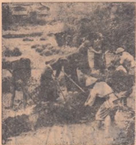
Țăranii vietnamezi prestează o muncă susținută pentru irigarea terenurilor pe care se va cultiva orez — principala produs agricol al țării

După proclamarea Republicii Democrate Vietnam, în toamna anului 1945, imperialiștii francezi au început în grabă războiul sângeros împotriva tinerei republici. Poporul vietnamez s-a ridicat atunci la luptă, hotărât să-și apere cu abnegație libertatea și independența sa națională.