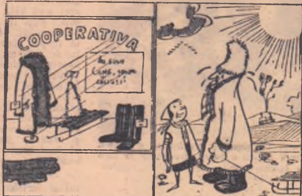
Dacă te-îmbraci cu ce-l în vitrină...

...că la cooperativa din Parincea-Petrești, se aduc mărfuri de sezon.