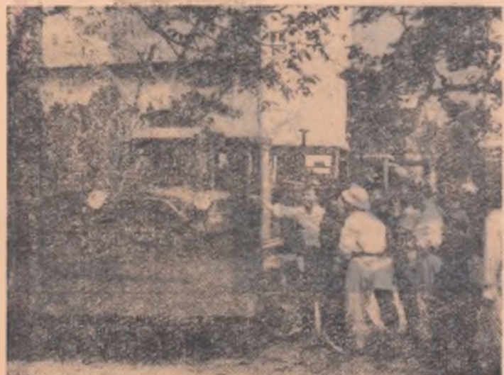
Un nou lot de tractoare sovietice vor brăzda în curînd pămînturile țăranilor vietnamezi. Ajutorul pe care Uniunea Sovietică, R.P. Chineză și celelalte țări socialiste îl acordă R. D. Vietnam este un ajutor prietenesc, multilateral, dat pentru continuă înflorire a economiei vietnameze.

Viața oamenilor se îmbunătățește an de an. Pînă în 1962 în regiunea Viet-Bak analiabetismul va fi complet lichidat. Această regiune, denumită pe drept cuvînt „leagănul revoluției vietnameze”, posedînd bogății nemăsurate ca fier, aur, cositor și altele, va deveni în următorii ani principala bază industrială și de materii prime a R. D. Vietnam. Dezvoltarea Viet-Bakului este caracteristică pentru toate regiunile țării unde se muncește și se construiește cu sîrg o viață înfloritoare.