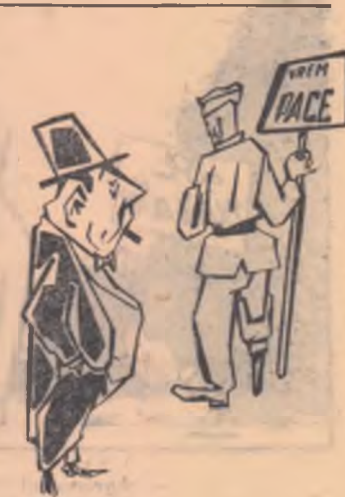
MONOPOLISTUL: Nu-l înțeleg: vechi combatant și să lupte pentru pace?!

lui, și la care participă principalele partide de opoziție — social-democrații și liberalii — precum și numeroși sindicalisti, oameni de știință, publiciști, membri ai clerului etc.