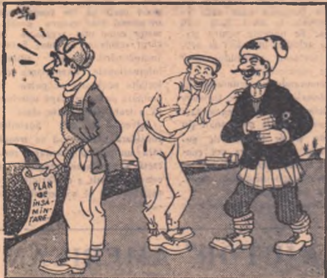
— Grozavă păcăleală i-am tras: i-am spus că pînă azi însămînțăm 20 hectare și am însămînțat... 30! (Desen de A. CLENCIU)