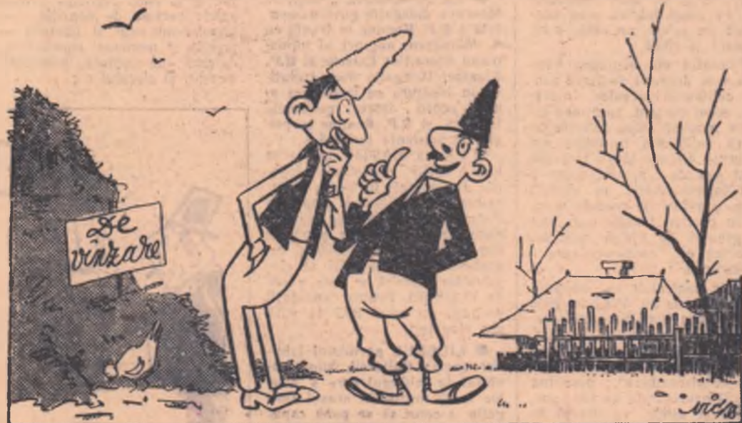
— Agronomul spune că nu e bine să vindem gunoiul!.. — Vezi-ți de treabă. Vrea să ne păcălească de 1 aprilie.

Intovărășiții din comuna Pogoanele, regiunea Ploești, vind gunoiul, în loc să-l folosească la cîmp.