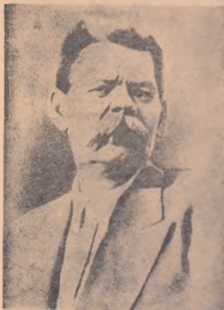
A. M. Gorki (Moscova 1934).

Țoiagul de drumeț al tineretii lui Alexei Maximovici Peșkov, care avea să-și ia mai târziu numele de scriitor pe care îl cunoaștem și care înseamnă, rusește, Maxim cel amar, a bătut multe drumuri ale amărăciunii omenești din Rusia țaristă. Era vremea când