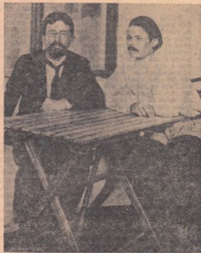
A. P. Cehov și A. M. Gorki la laltă în anul 1900.