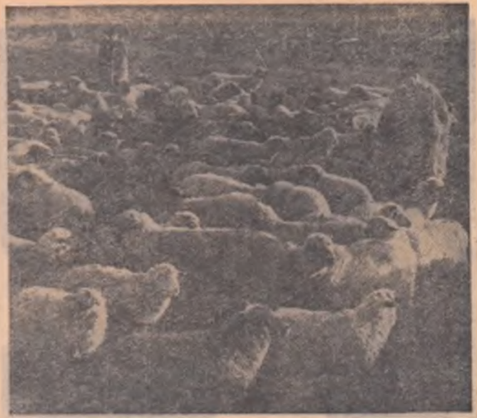
Dezvoltarea fondului obștesc este una din preocupările de seamă ale întovărășitorilor din Micălaca, regiunea Timișoara. Fondul obștesc se ridică la cca. 160.000 lei. Printre altele, o sursă însemnată de venituri este turma de 111 oi mame pe care o vedem în fotografia de față.