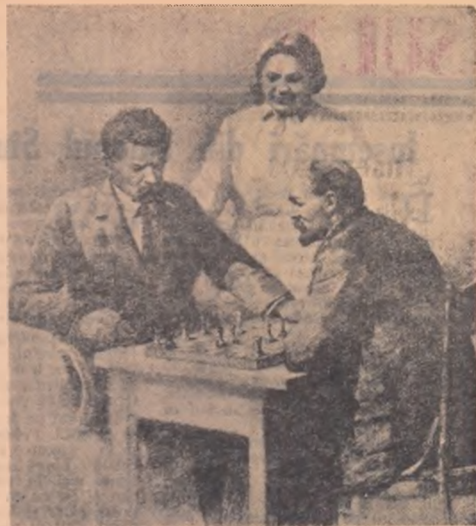
V. I. Lenin, Maxim Gorki și Nadejda Krupskaja la o partidă de șah.

Gorki a creat o operă luminoasă, mare. Adîncea omeniile a ideilor ei, puritatea simțămîntelor calde, vibrația puternică a glasului marelui scriitor rus, ce răsună în inimile cititorilor, sensul ei revoluționar, totdeauna viu, o fac să trăiască, atît cît va trăi omeniile. Sutele de povestiri, amintirile din copilărie și adolescență, cele aproape douăzeci de piese de teatru, romanele, poveștile și versurile lui Maxim Gorki, omul care își zisesese în primele vremi, dinaintea revoluțiilor, cel amar, alcătuieste o lumină de soare care ne învață cum poate fi biruită amărăciunea și cum poate fi omul om. Căci lui Gorki, unul dintre cei mai mari umaniști ai tuturor vremurilor, îi plăcea să scrie foarte nume, care lui îi suna foarte mîndru, cu litere mari, ca numele proprii, Omul.