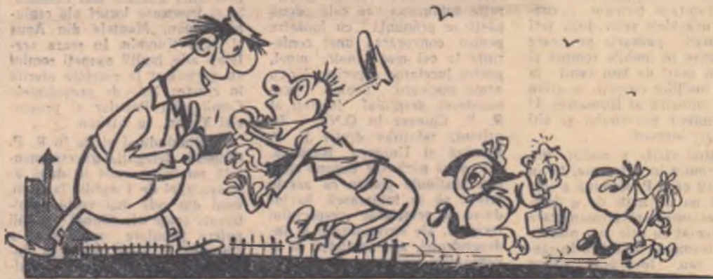
— Pe tine te iert! Pe ziua de azi am obosit!...

Mecanicul șef Rață de la S.M.T. Dîngeni, regiunea Suceava, obișnuiește să-i bată pe tractoriști. Din această cauză, mulți mecanizatori pricepuți părăsesc S.M.T.-ul.