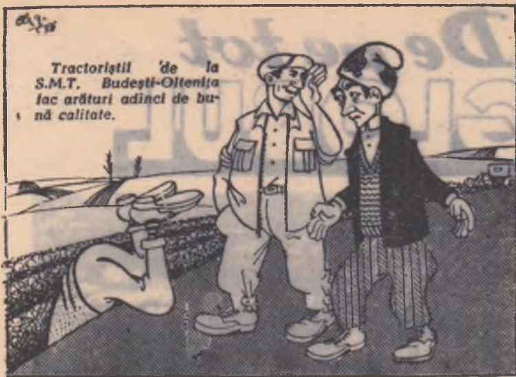
Tractoristii de la S.M.T. Budești-Oltenița fac arături adânci de bună calitate.

— Ce-i cu normatorul nostru? — Vrea să se convingă dacă arătura e într-adevăr adâncă! (Desen de AL. CLENCIU)