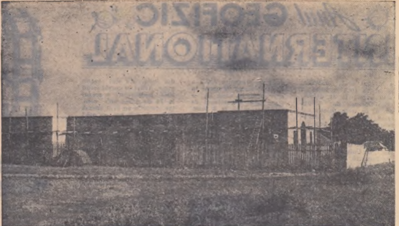
La Comana, — regiunea Constanța, din împrejurirea binalelor, răsare clădirea casei de cultura care va fi terminată în cinstea zilei de 1 Mai.