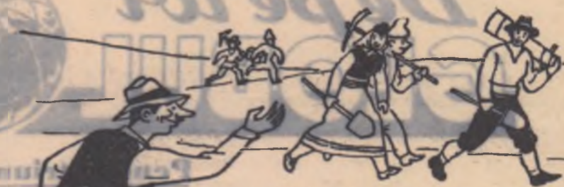
— E rost de v'un ciștig? Aș merge și eu...