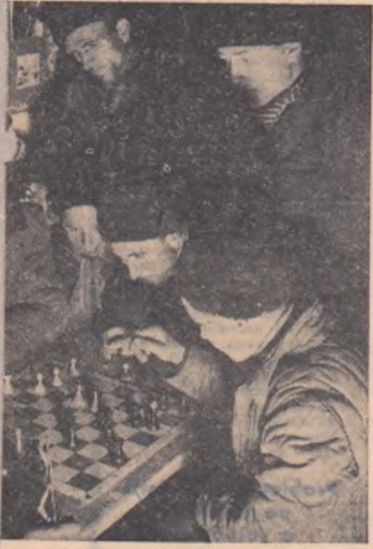
ctivel din Căzănești, raionul Urziceni, se adună liber, colectivisti amatori să joace sau să

Leșu este un sat care face parte dintr-o veche țară de răscruți: Năsăudul. Calea pînă la Leșu — un ceas de mers pe jos de la gară — o străbați pe un drum de munte, cînd în clin, cînd în mîinec, te răsucești capricios pînă ce cobori pe luncile de sub Strîmtura cea mare. Lași în dreapta stîncile Boscadăului și mergi alături cu apa cea mare și calea ferată forestieră. Coastele Heniului, cu brazii pironiți în steiuri, străjulesc mereu drumul. De pe virful muntelui vezi contururile drumurilor și văilor. În vale, casele par puține. Să fie acolo toate cele peste 600 de gospodării cite are satul? Se vede, ce-i drept, peste dealul Bliadarului, un roi de case. E Lunca. Mai sus un alt cătun, Ierboasa; tot puține case. Inima satului bate însă în Gura uliței, la revărsarea Leșului în apa cea mare.