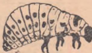
Larva gîndacului de Colorado

În regiunile din vestul țării — Baia Mare, Oradea, Timișoara — și-a făcut apariția gîndacul de Colorado, cel mai periculos dușman al cartofului. În afară de cartofi, gîndacul de Colorado mai atacă roșiile, vinetele, ardeii, turtunul. Pagubele pe care le produce acest gîndac sînt foarte mari. Ele întrec pe cele produse de lăcuste la cereale sau de păduchele de San José la