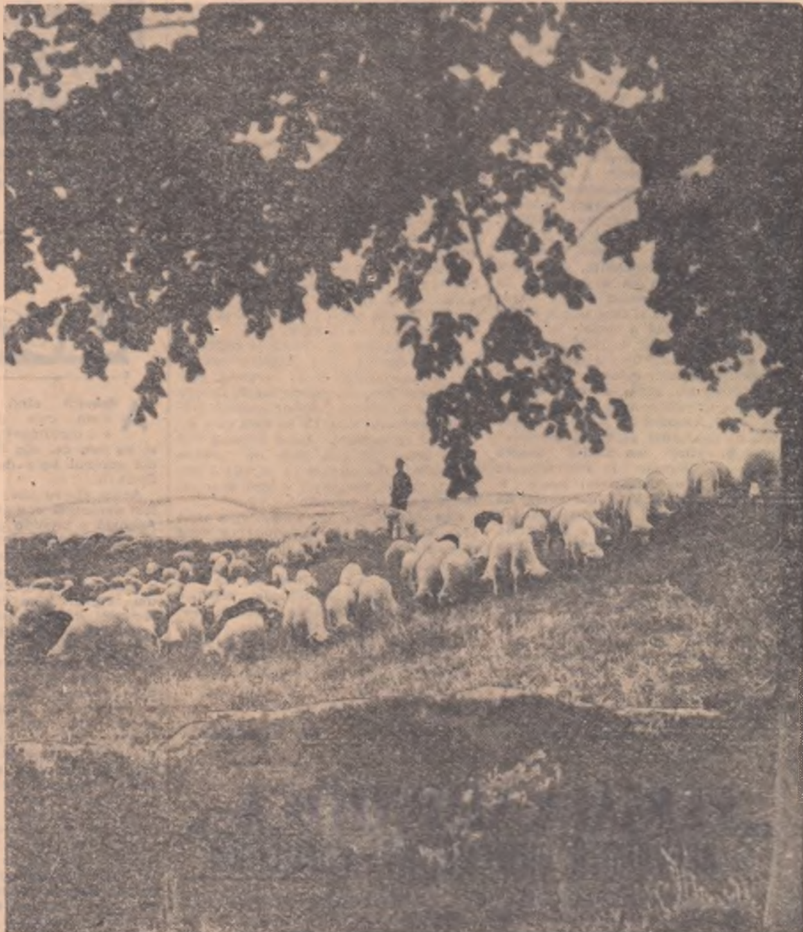
Oile gospodăriei agricole colective din comuna Codlea, regiunea Stalin, sînt urcate pe muntele Măgura.