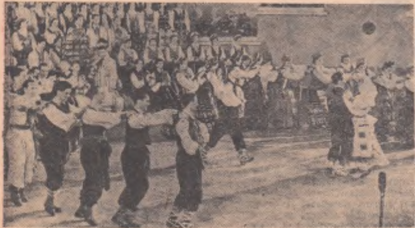
Ansamblul emerit de stat de cîntece și dansuri din R.S.S. Lituania, sosit în țara noastră cu prilejul Decadei culturii Republicilor Sovietice Baltice, execută un dans popular lituanian.

El hotărî, în cele din urmă, să facă ordine și acasă și duminică după amiază, prin ferestrele deschise