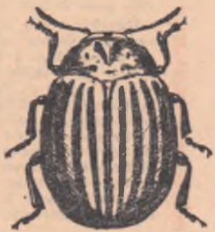
Gîndacul de Colorado

În regiunile din vestul țării — Baia Mare, Oradea, Timișoara — și-a făcut apariția gîndacul de Colorado, cel mai periculos dușman al cartofului. În afară de cartofi, gîndacul de Colorado mai atacă roșiile, vinetele, ardeii, turtunul. Pagubele pe care le produce acest gîndac sînt foarte mari. Ele întrec pe cele produse de lăcuste la cereale sau de păduchele de San José la