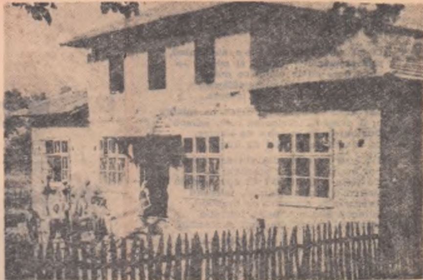
În satul Roșiuța din comuna Ploștina, raionul Baia de Aramă, prin contribuția voluntară a cetățenilor s-a terminat construcția la roșu a unui cămin cultural. Iată un aspect din timpul muncii pentru grăbirea lucrărilor de finisare.