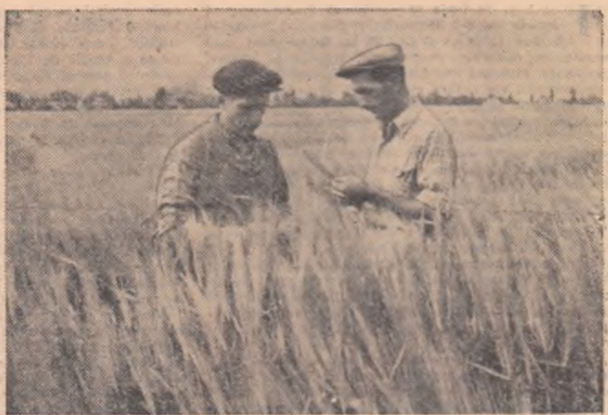
Cultura mare, cerealiară este mîndria colectivităților din Codlea. Lanul de ox iz ajunge curînd la pieptul omului.