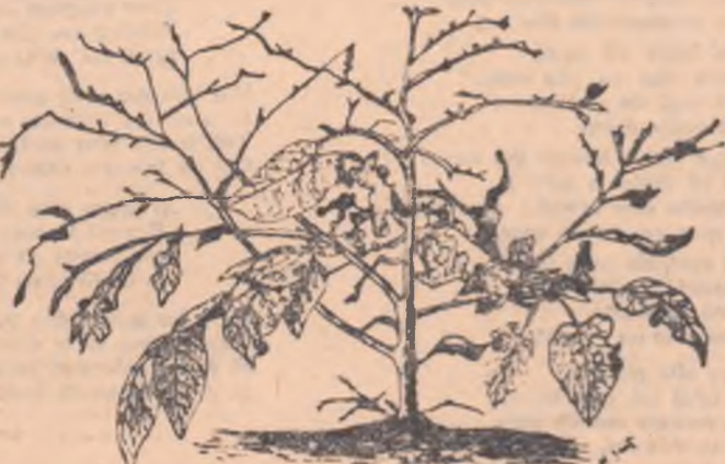
O plantă atacată de gîndacul de Colorado

Datoria fiecărui agricultor este de a sprijini acțiunile organizate de sîturile populare în scopul distrugerii acestui periculos dăunător. Căminele culturale pot și trebuie să dea un sprijin prețios în combaterea gîndacului, mobilizînd pe țărânii muncitori în acțiunea pentru descoperirea și stîrpirea acestui periculos dușman al culturilor.