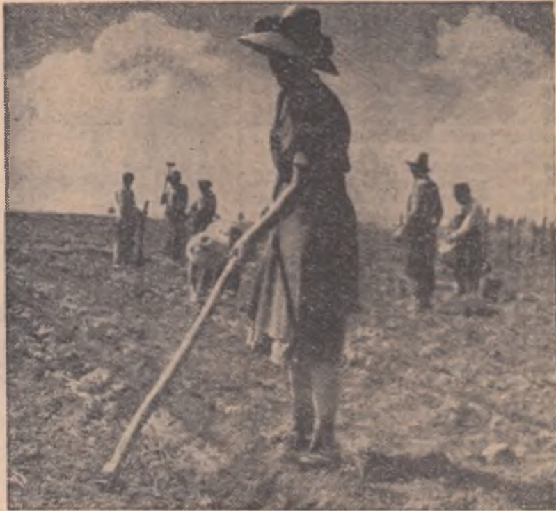
40 hectare de grădină nu-s un fleac! Colectiviștii din Hărman sînt hotărîți să scoată în acest an peste 300.000 lei din vânzarea legumelor și zarzavaturilor.