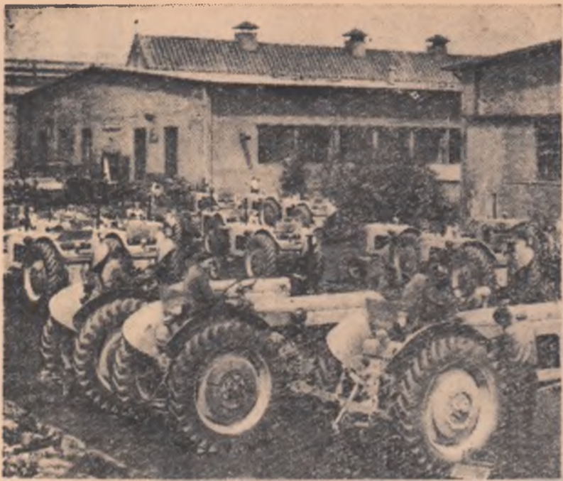
Tractoarele construite de muncitorii uzinelor „Ernst Thälmann” din Orașul Stalin sînt cunoscute astăzi pe trei continente. Iată realizările industriei noastre socialiste, realizări despre care capitaliștii din România spuneau odinioară că sînt cu neputință de înlăptuit.