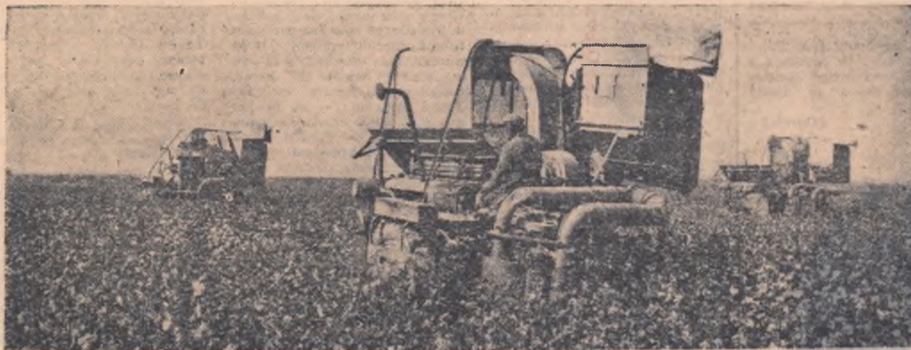
Agricultura sovietică va fi înzestrată în cursul planului de șapte ani cu peste un milion de tractoare, aproximativ 400.000 de combine cerealiere și un mare număr de alte mașini agricole.