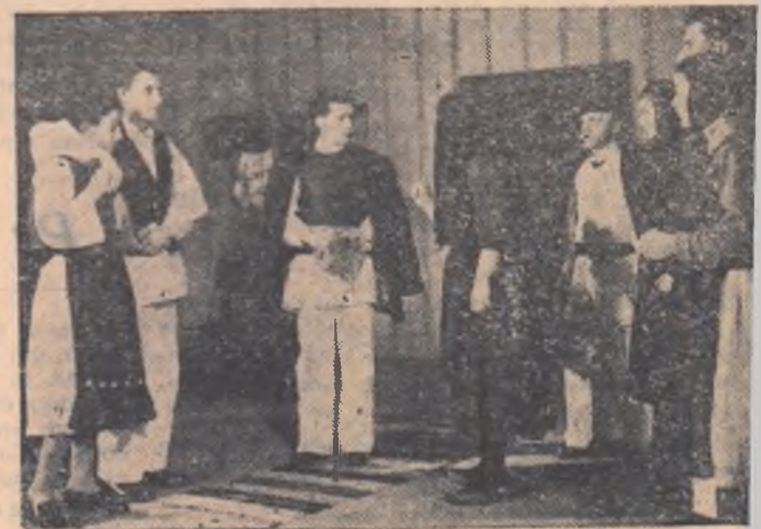
Scenă din piesa „Tîrgul inimilor” de Tiberiu Vornic. Interpretează colectivul căminului cultural din comuna Arment, regiunea Timișoara