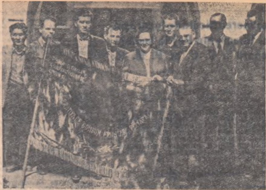
Pentru realizările deosebite în aprovizionarea țărănilor muncitori, pentru depășirea planului de contractări și achiziții, cooperativa din comuna Dragoș Vodă, raionul Călărași, a primit steagul de frunțășă pe țară. În fotografie: Un aspect de la înminarea steagului de frunțășă pe țară.

Cel de al III-lea Congres al cooperativei de consum de care ne mai despart puține zile, va analiza modul în care cooperativa și-a îndeplinit sarcinile trasate de partid în vederea dezvoltării schimbului între oraș și sate, în ce măsură a luptat pentru imprimarea spiritului cooperativist în așa fel ca țărăni muncitori să treacă de la cooperarea de consum la cooperarea în agricultură. Congresul va fi în același timp și un prilej de a scoate la iveală neajunsurile care mai persistă în muncă și va hotărî măsurile care să ducă la îmbunătățirea activității, la dezvoltarea pe mai departe a cooperativei de consum, ca largă organizație de masă pusă în slujba intereselor oamenilor muncii de la orașe și sate din țara noastră.