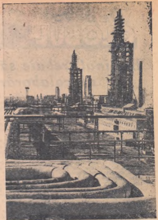
Producția industrială globală a U.R.S.S. va crește în viitorii șapte ani cu aproximativ 80 la sută. În fotografie: o parte a instalației de cracare catalitică a rafinării de petrol din Novokuibîșev.

S-a îndepărtat fluierînd americanul acela de rînd, poate un șofer sau un cleric, sau poate un muncitor