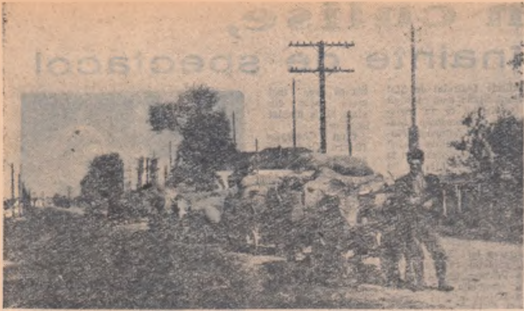
Convoaie de care încărcate cu poveri, duc în fiecare zi, la baza de recepție din Roman, produse contractate cu cooperativele sătești, de către țărani muncitori din comunele Horia, Miron Costin, Buruienesti și Tămășeni.