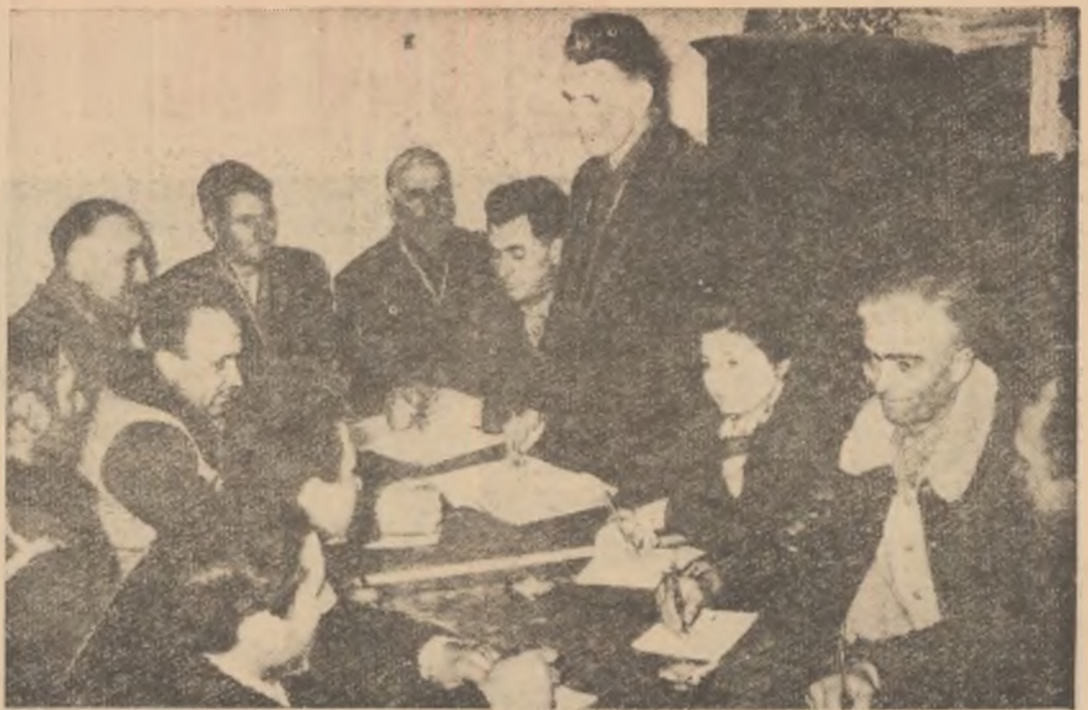
Consiliul de conducere al g.a.c. „Grivița Rosie” din Gimbașani, regiunea București, discută planul de producție pe 1960

Culeasă de GEORGE MUNTEAN de la Varvara Muntean comuna Bilca-Rădăuți