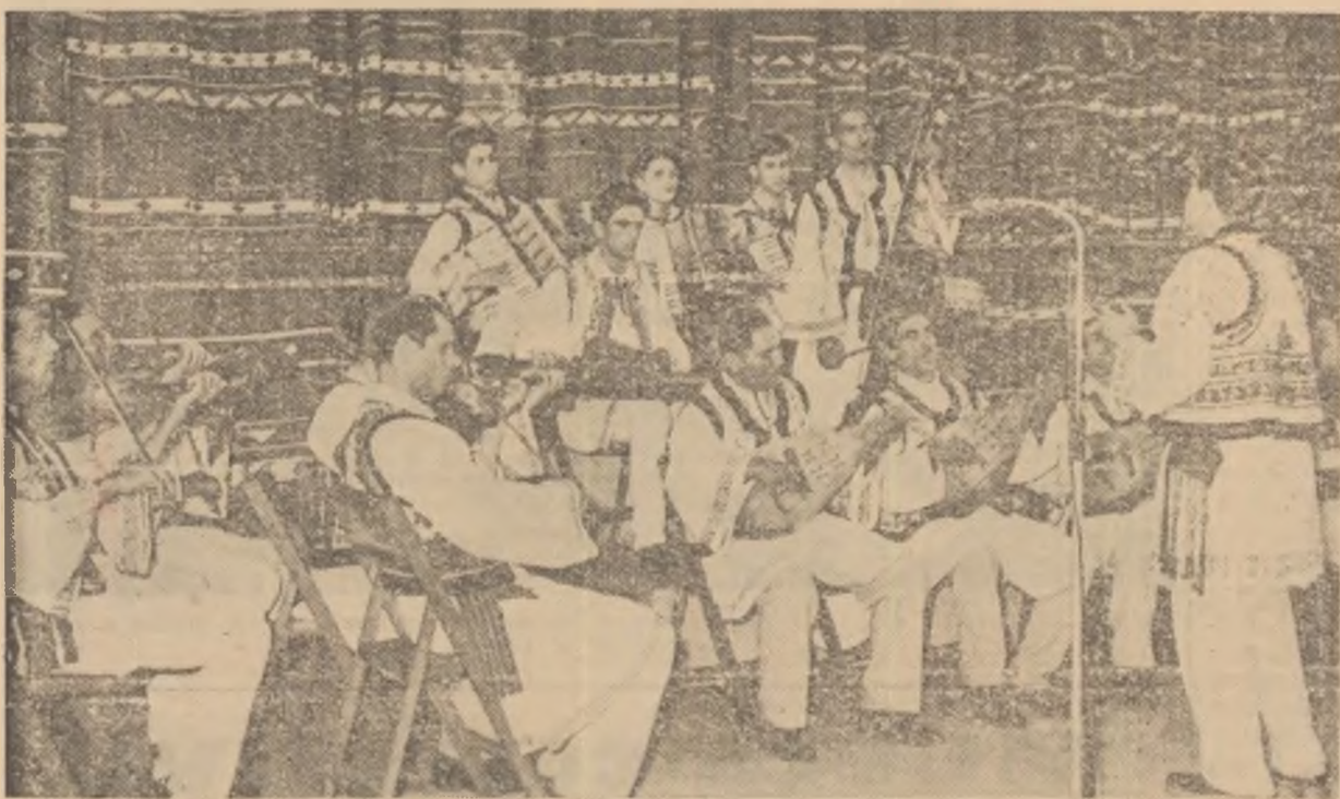
Taraful căminului cultural din comuna Cracovani, raionul Tg. Neamț, regiunea Bacău