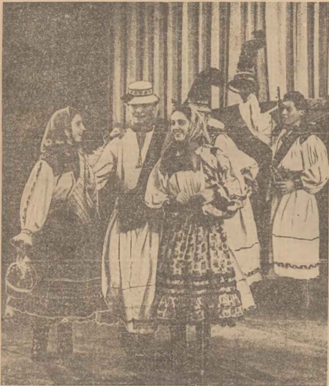
Tineri din Ţara Oaşului executind „Dansul bucuriei“

Anul 62 • Seria II • Nr. 628 • Miercuri 6 ianuarie 1960 • 8 pagini — 15 bani.