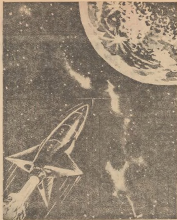
Racheta în drum spre Lună.

Politica încordării, politica de pe poziții de forță, are, ca perspectivă, lada de gunoi a istoriei. Popoarele cer ca locul nefastului „război rece” să-l ia o pace bazată pe principiile apropierii și colaborării internaționale, conviețuirii pașnice, neamestecului în treburile interne, relațiilor comerciale normale. Pentru înfăptuirea acestor țeluri vor milita în strînsă unitate și cu aceeași perseverență țările lagărului socialist, Republica Populară Romînă, care s-a străduit să-și aducă propria contribuție la începutul de destindere realizat, va consacra și în viitor acestor scopuri întreaga sa activitate pe plan internațional.