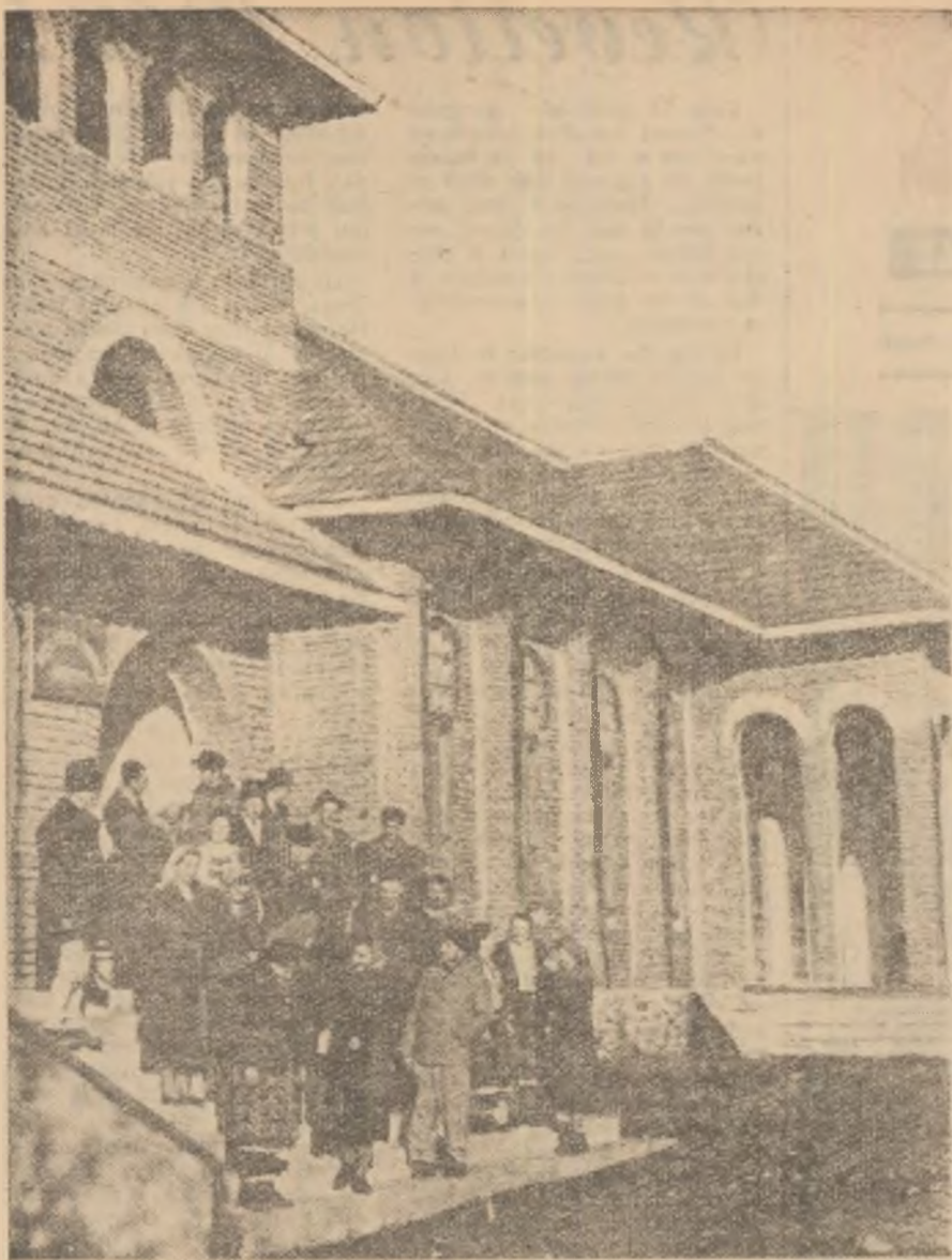
Căminul cultural din comuna Mușătești, raionul Curtea de Argeș