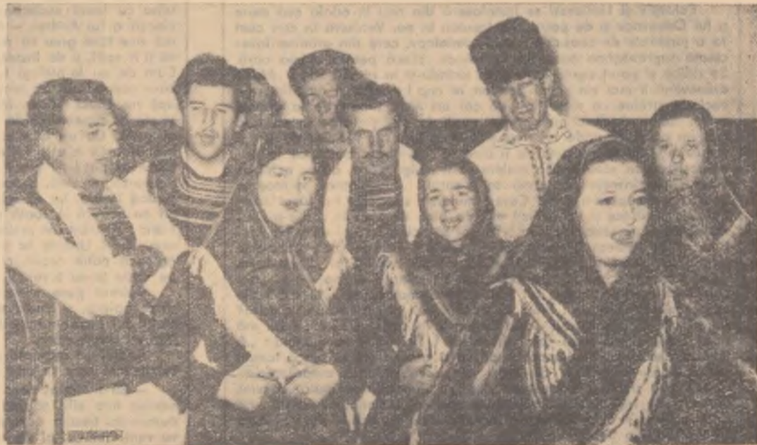
Un grup de colectiviști din echipa căminului cultural din comuna Mihail Kogălniceanu, raionul Tulcea, repetînd un nou program artistic