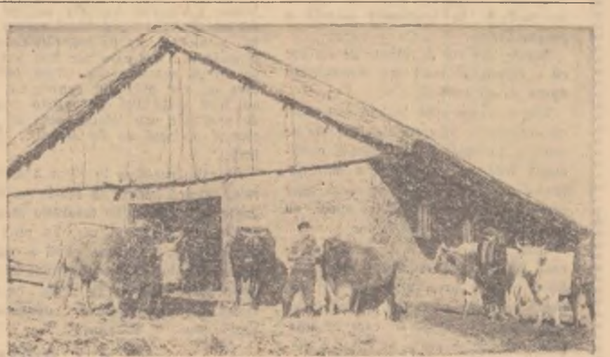
Folosind resursele locale la construirea unui grajd, colectivștii din comuna Lascăr Catargiu, reg. Galați, au realizat o economie de peste 85.000 lei.