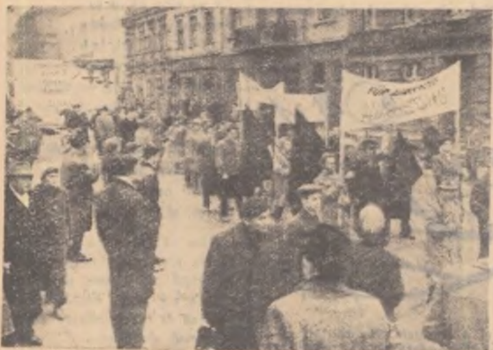
Aspect de la mitingul de protest care a avut loc de curînd în orașul Velbert (R.F. Germană), împotriva înarmării atomice a Germaniei occidentale și a provocărilor fasciste inițiate de guvernul de la Bonn