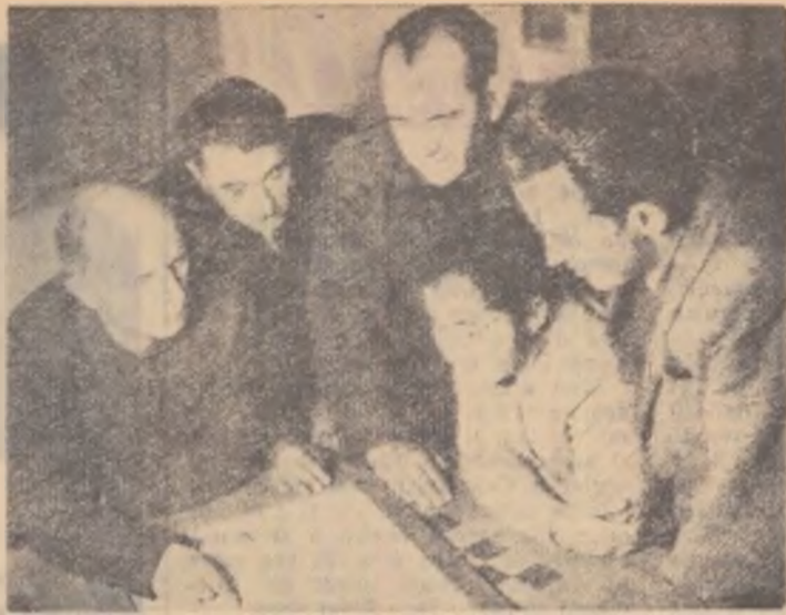
Lectori și cursanți ai Universității populare din Mușetești, raionul Curtea de Argeș, consultînd planul de învățămînt.