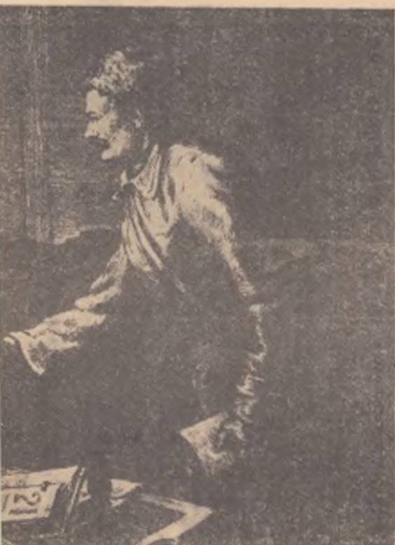
al Armatei Rosii, August 1918. Pictură de V. KASIAN