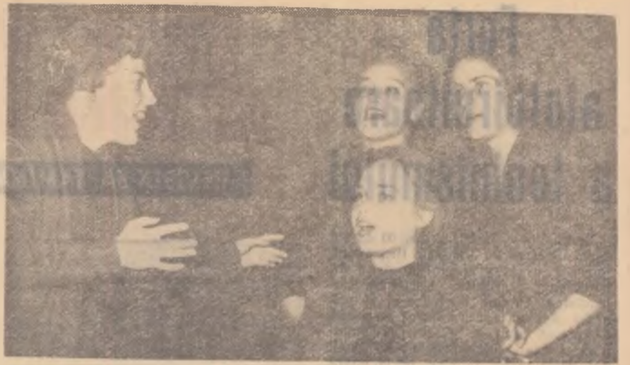
Brigada artistică de agitație a căminului cultural din Gura Oeniței, raionul Tîrgoviște, repetînd un nou program.

Mii și mii de astfel de manifestări culturale-artistice au avut loc în întreaga țară, milioanele de oameni ai muncii din fabrici și uzine, de pe ogoare și instituții, cîstînd amintirea vie și glorioasă a genialului dascăl al proletariatului internațional - Vladimir Ilici Lenin.