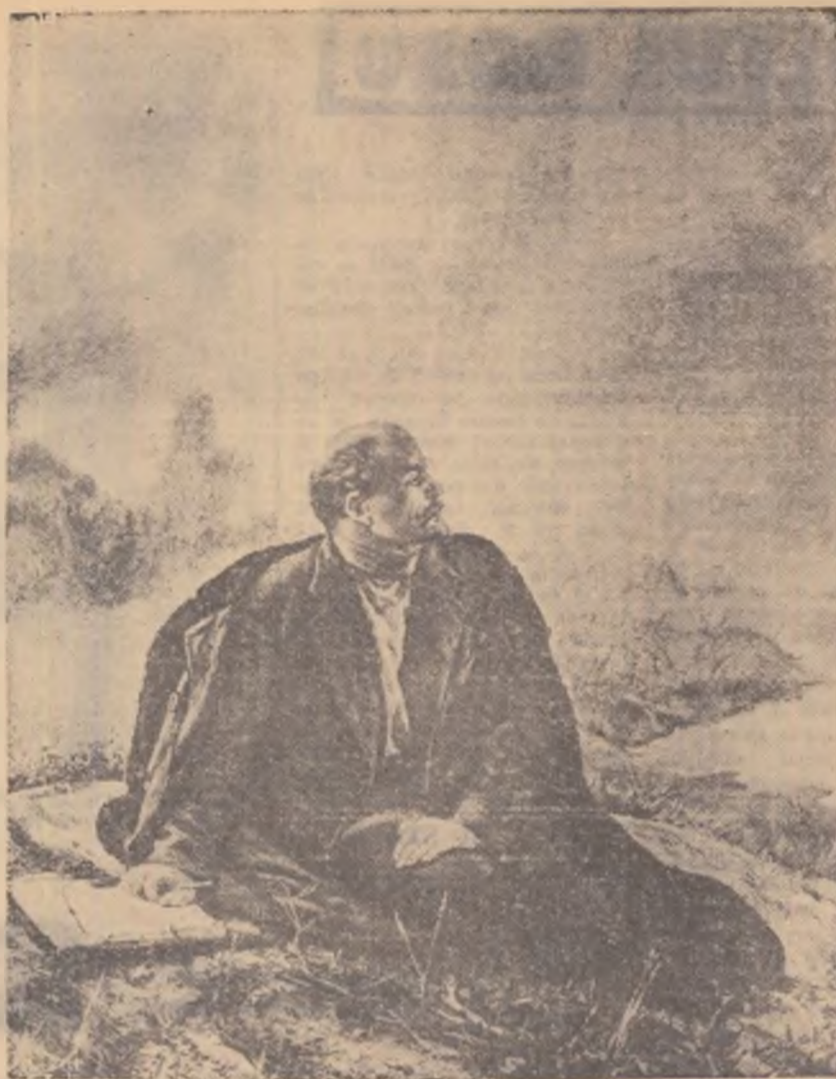
V. I. Lenin la Razliv