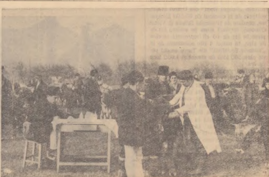
În comuna Polovraci, regiunea Craiova, se vaccinează vitole.