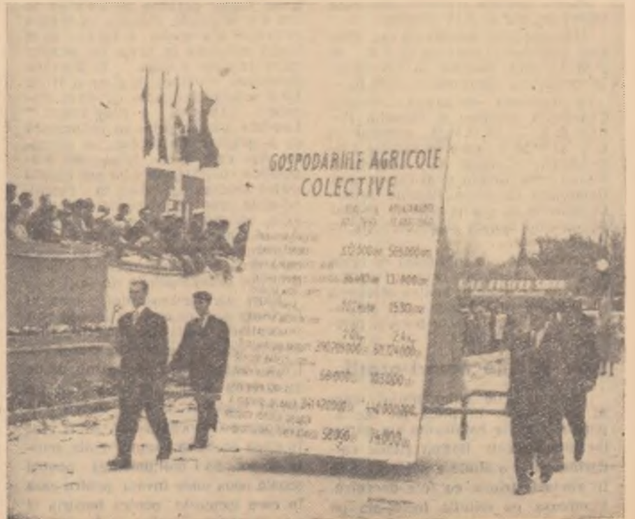
Aspect de la demonstrația oamenilor muncii din orașul Constanța