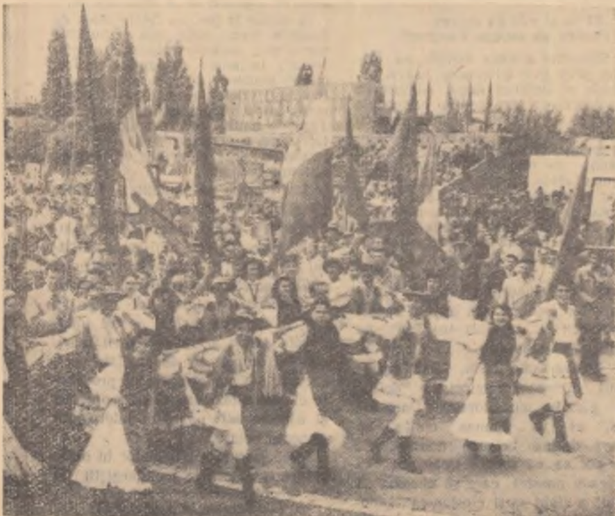
Cu cîntec și joc trec coloane după coloane prin fața tribunelor oficiale din Capitală