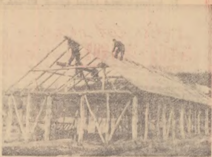
Construcții ieftine din resurse locale. Colectiviștii din Oporetu, regiunea Pitești, ridică un grajd al cărui cost nu va depăși 9.000 lei.

E bine însă ca ori de cîte ori se semnalează dăunătorii, atît în câmp cit și în vie și livezi, să anunțăm organele locale (sfatul popular) pentru a lua măsuri de prevenire.