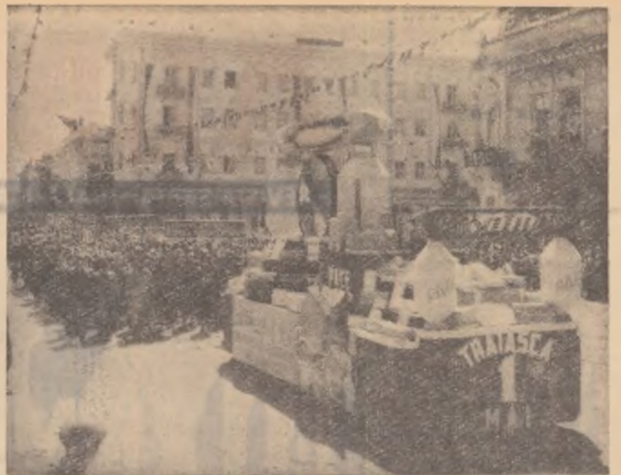
Demonstrația oamenilor muncii din Iași cu prilejul zilei de 1 Mai