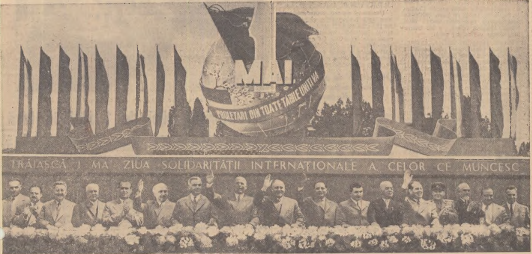
Tribuna centrală în timpul demonstrației oamenilor muncii din Capitală.