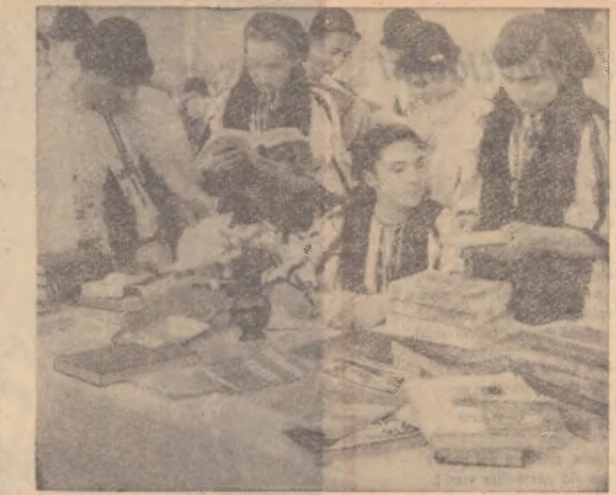
Stand de cărți în comuna Polovraci, regiunea Craiova