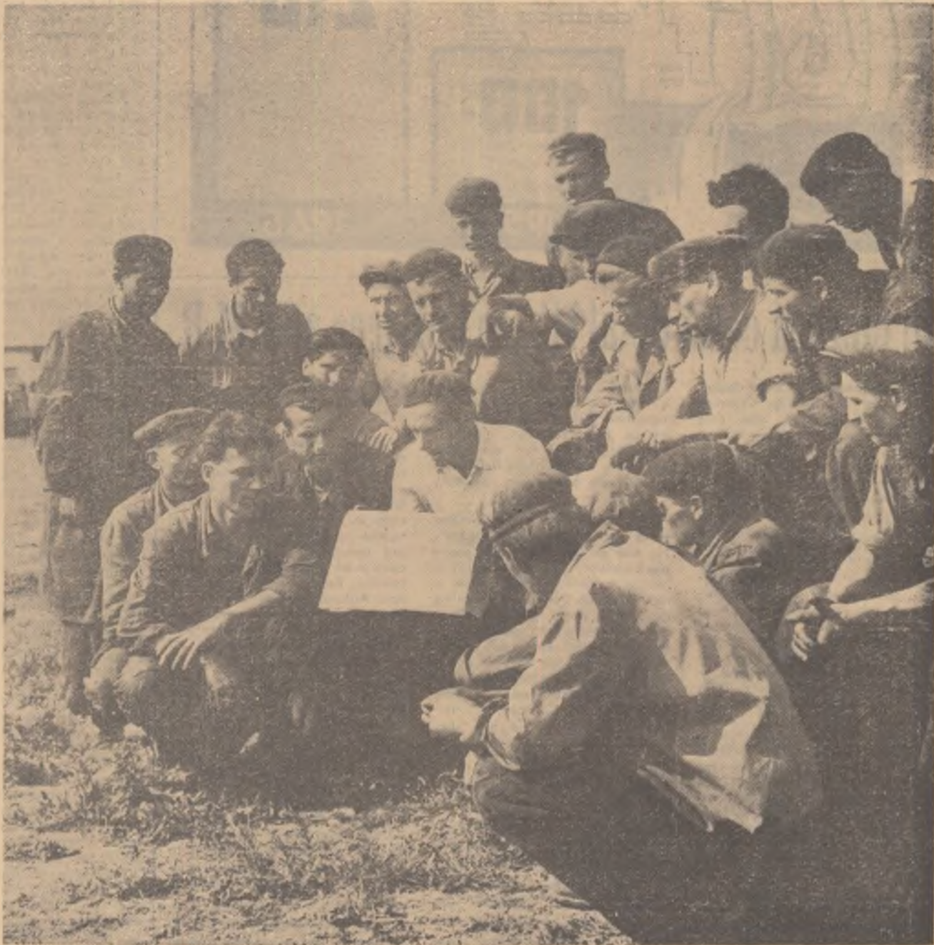
Mecanizatorul de la S.M.T. Cocioc, regiunea București, citind Proiectul de Directive ale Congresului al III-lea al P.M.R.

Proiectul de Directive al celui de-al treilea Congres al partidului arată că sarcina fundamentală a planului economic pe perioada de șase