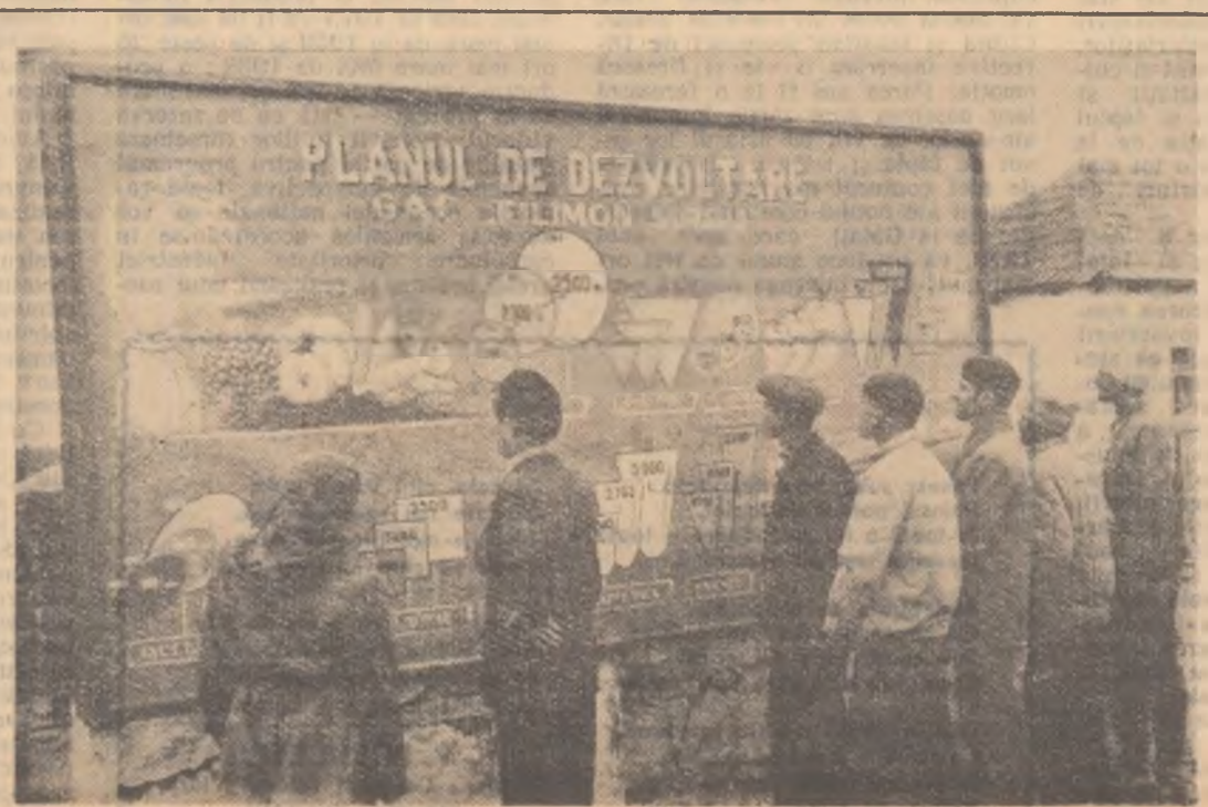
Planul de dezvoltare al C.A.C. Fîlmon Sirba din comuna Comana, regiunea Constanța.

La 19 iunie, adică în preziua începerii Congresului „Ștafeta culturală” cu cele 8 caiete și drapel, va sosi la Huedin unde, în cadrul unei adevărate sărbători ale artei și culturii, vor fi înfățișate înfăptuirile din satele raionului, adevărate cronici care îmbogățesc istoria acestor ani de putere populară.