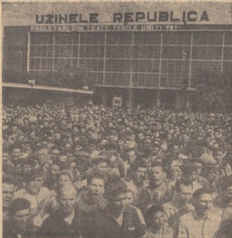
În Capitală și în țară continuă să aibă loc mitinguri în care oamenii muncii aprobă și sprijină pe deplin poziția justă a Uniunii Sovietice în tratativele de la Paris, condamnînd totodată politica agresivă a cercurilor reacționare imperialiste din S.U.A. În disșeu: mitingul de la Uzinele „Republica” din Capitală.

La 24 mai a avut loc a doua ședință a Consiliului de Securitate.