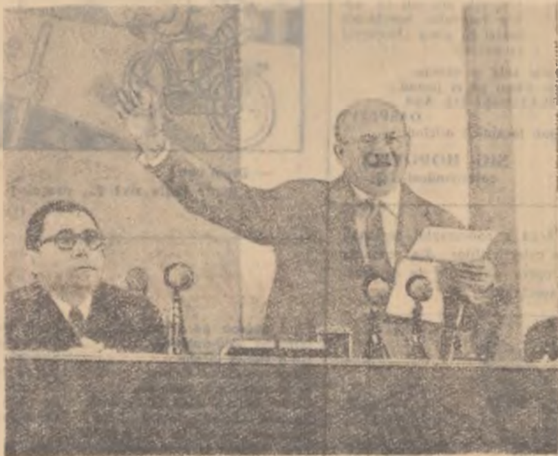
N. S. Hrușciov răspunzînd întrebărilor puse de ziariști.

zarmării, a cărei aminare poate avea urmări tragice pentru omenire, este necesară unirea tuturor forțelor iubitoare de pace pentru a zădărnici unelțile așlătorilor la război. „Dacă ne vom uni aceste eforturi — a spus la conferința de presă N. S. Hrușciov — pacea va fi salvată. Uniunea Sovietică, toți oamenii sovietici depun eforturi tocmai în această direcție. Sînt ferm convins că întregul nostru popor, popoarele tuturor țărilor socialiste și toți oamenii care se situează pe pozițiile asigu-