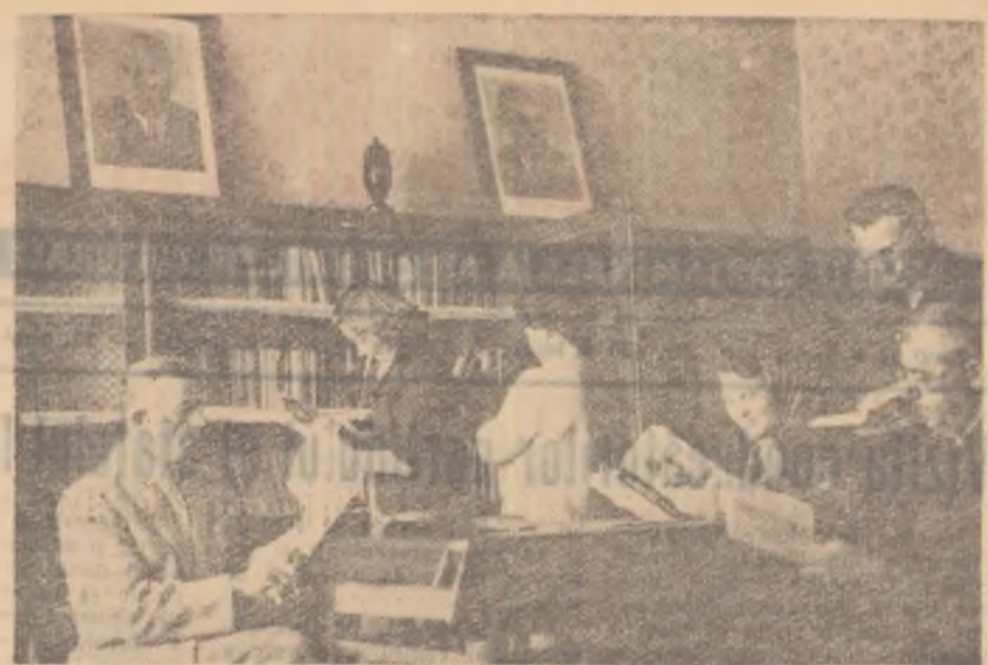
În cinstea Congresului, biblioteca din comuna Arcuș, raionul Sf. Gheorghe, și-a sporit numărul cititorilor. În fotografie: noi cititori împrumutînd cărți.