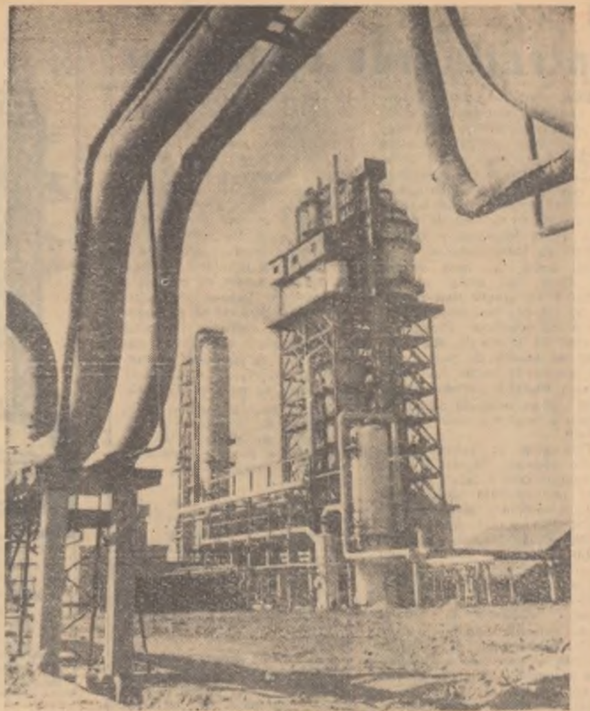
Instalația de cracare catalitică nr. 1 de la Rafinăria nr. 10 din Onești.