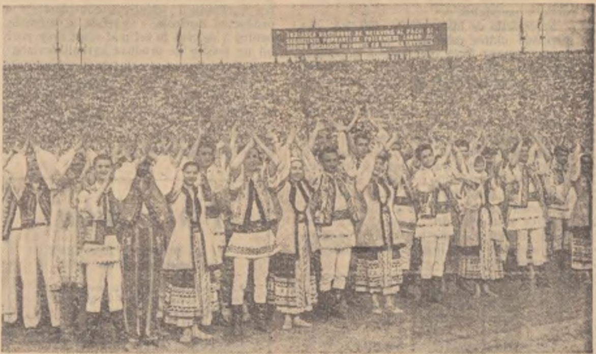
Aspect de la mitingul oamenilor muncii din Capitală.