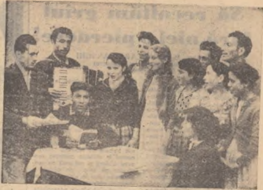
Brigada din Lehliu repetă noul program.