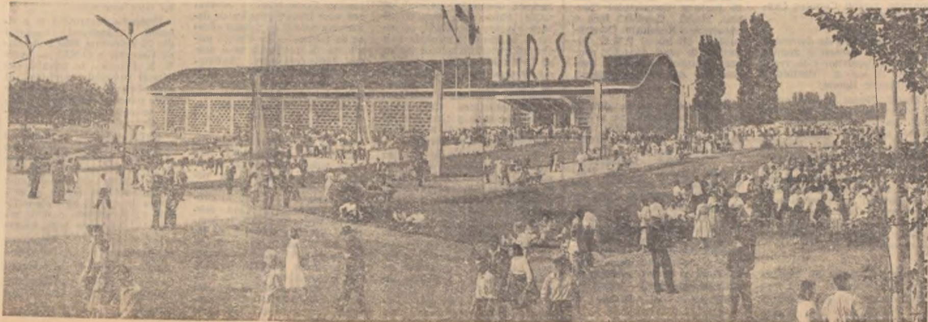
Aspect general al expoziției