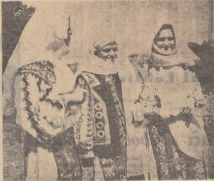
Aceste tinere prezintă frumusețea pieptarelor, a cusăturilor de pe cămăși create cu peste 150 de ani în urmă în raionul T. Măgurele

Nu numai cînd întreaga recoltă de grâu va fi înmagazinată și se vor asigura condiții bune de păstrare, putem spune că ne-am îndeplinit sarcina stringerii în bune condiții a recoltei, asigurînd astfel piinea poporului nostru muncitor.