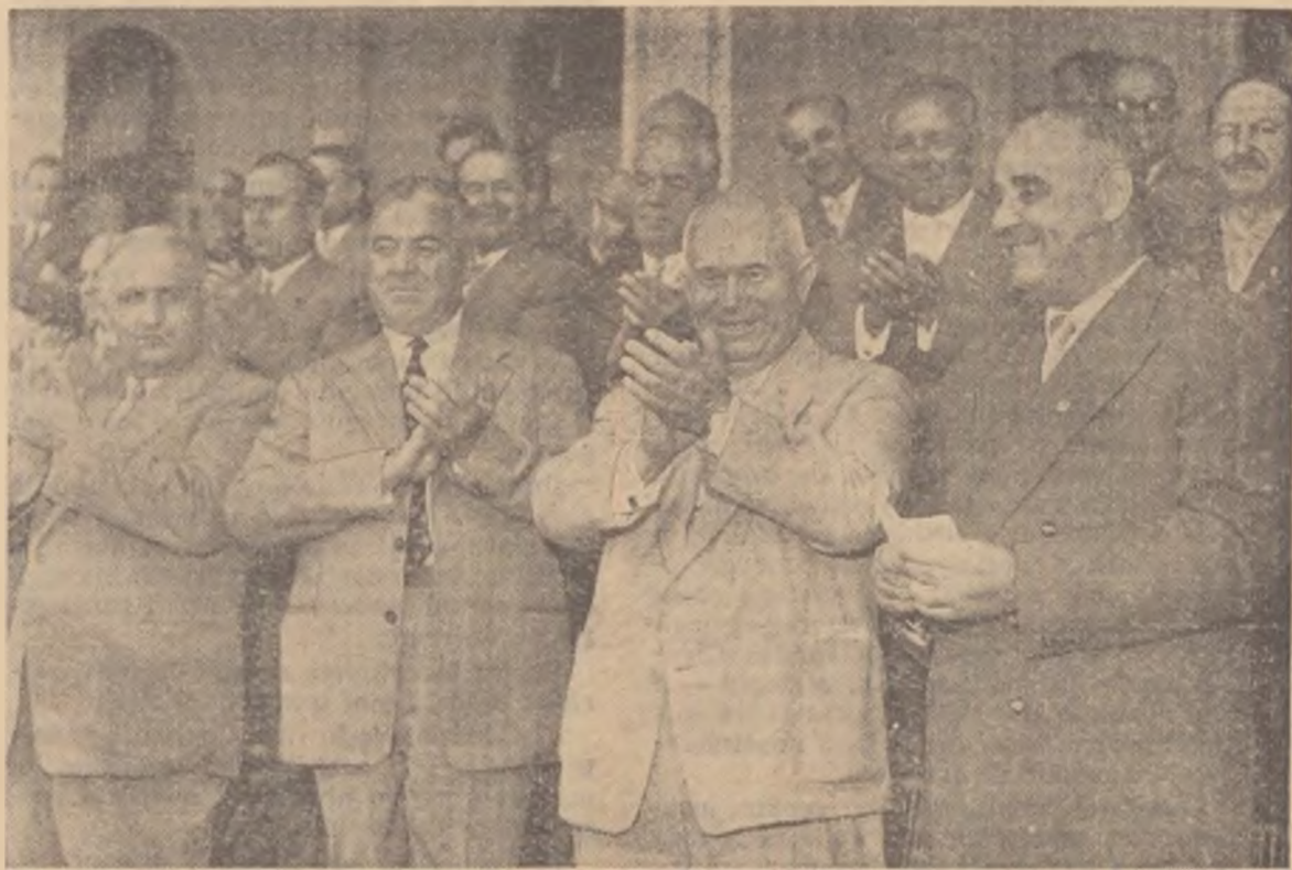
Sîmbătă după-amiază a avut loc pe stadionul „23 August” un mare miting al oamenilor muncii din Capitală organizat cu prilejul încheierii lucrărilor celui de-al III-lea Congres al Partidului Muncitoresc Român. În coliseu — un aspect al tribunei centrale.

Anul 62 • Seria II • Nr. 653 • Miercuri 29 Iunie 1960 • 8 pagini — 15 bani.