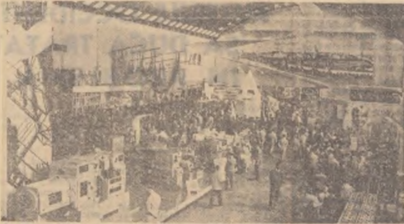
Vizitatorii cercetează cu un viu interes exponatele.

Cu totul altfel stau lucrurile în lumea socialismului. Aici totul poartă amprenta celei mai calde griji față de om și a încrederii profunde în viitorul său luminos. Totul exprimă optimismul,