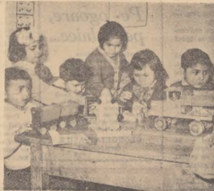
La grădinița de copii din Topraisar, regiunea Constanța.

Păulișul nu-i o comună din cele mari, dar este foarte arătoasă. Așezată între deal și cîmpie, în lunca Mureșului ce și îndeamnă apele spre Arad, comuna a cunoscut, în ultimii ani, o viață înfloritoare.